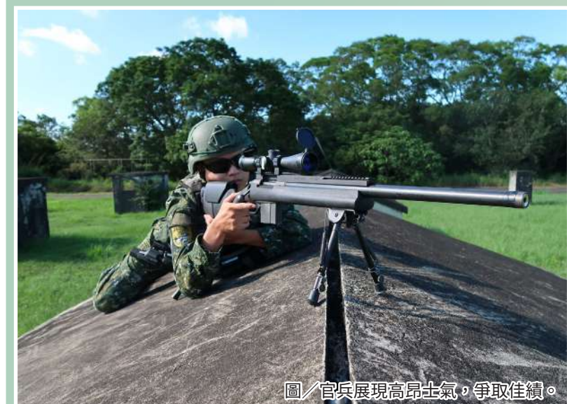
圖／官兵展現高昂士氣，爭取佳績。

嚴、從難」原則實施，藉靈活戰術執行，使官兵熟悉戰場實況，向國人展現國軍精實的戰力及保家衛國的決心。