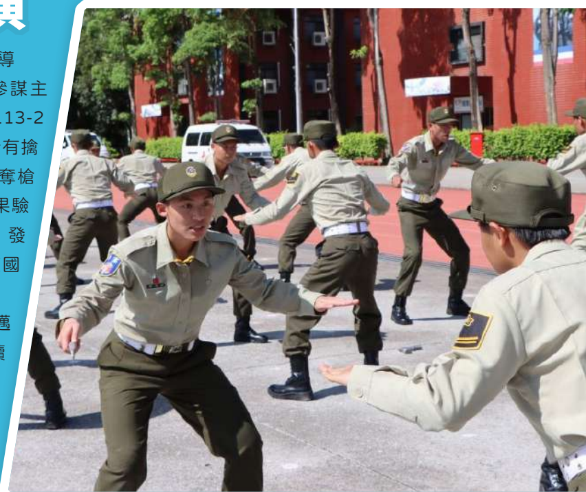
圖／官兵以整齊劃一的動作展現平時訓練成果。