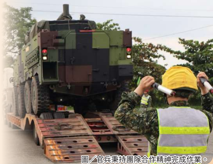
圖／官兵秉持團隊合作精神完成作業。