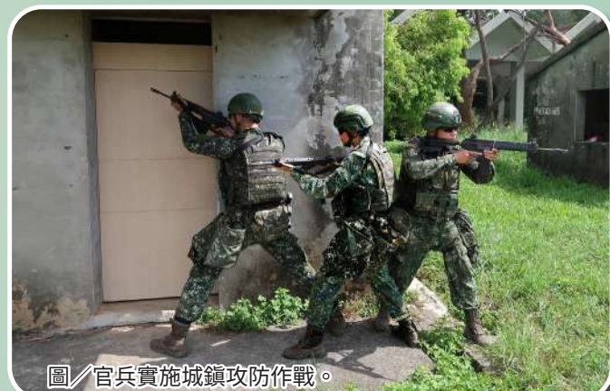
圖／官兵實施城鎮攻防作戰。