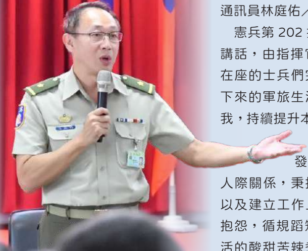
圖／陳指揮官勉勵役男秉持正向態度，不斷充實自我。

陳指揮官亦勉勵士兵們，分發到部隊後放寬心學習，培養良好人際關係，秉持「活到老、學到老」的精神，以及建立工作上的技能，學習換位思考，減少抱怨，循規蹈矩用心做好每件事情，將部隊生活的酸甜苦辣煮成美味佳餚，使自己更加成長茁壯。