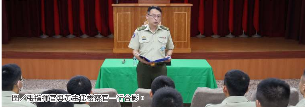
圖／張指揮官與黃主任檢察官一行合影。