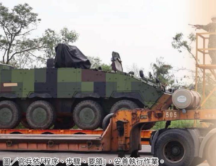
圖／官兵依「程序、步驟、要領」，妥善執行作業。

蔣副指揮官提醒，「安全」為一切根本，也是執行任務的第一要務，任務前務必做好風險管控，完善防護機制，依「程序、步驟、要領」，妥善執行作業；特別是上、下板過程中，務必依帶隊官指揮並按要領操作，齊心協力完成上板作業，確保車隊機動安全，方能順利完成任務。