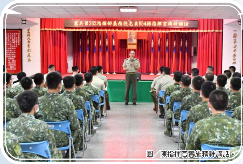
圖／陳指揮官實施精神講話。