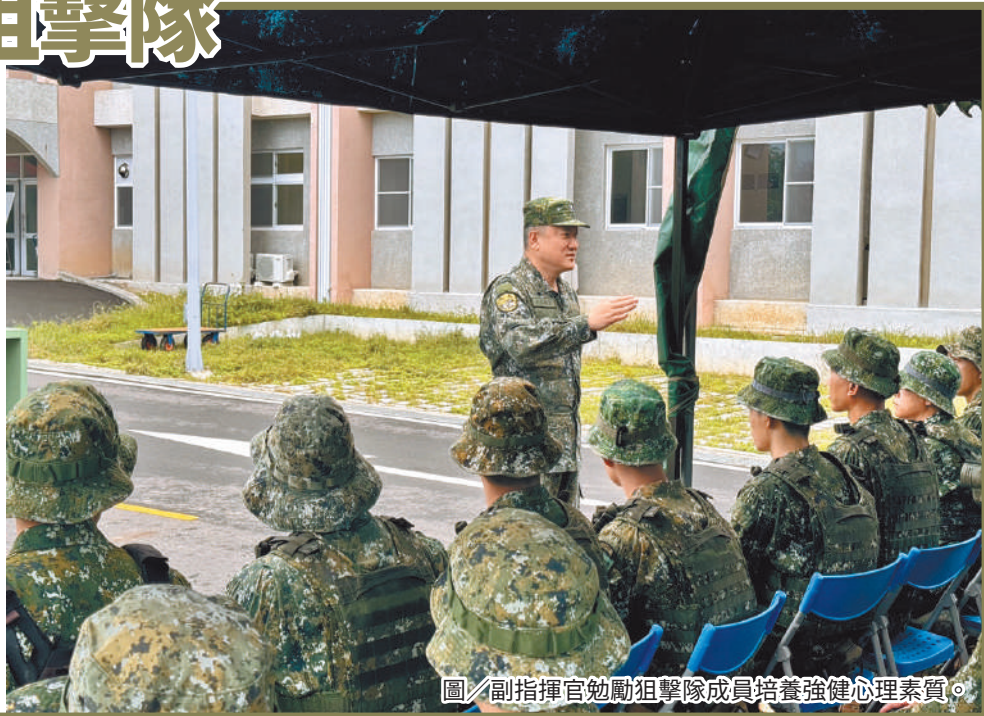
圖／副指揮官勉勵狙擊隊成員培養強健心理素質。

最後，于副指揮官提醒，幹部應以鼓勵、相互研討及落實訓後分析，協助隊員找出訓練問題成因修正改進，磨練肌肉記憶，內化為直覺反應，方能冷靜、穩定地運用所學執行任務。