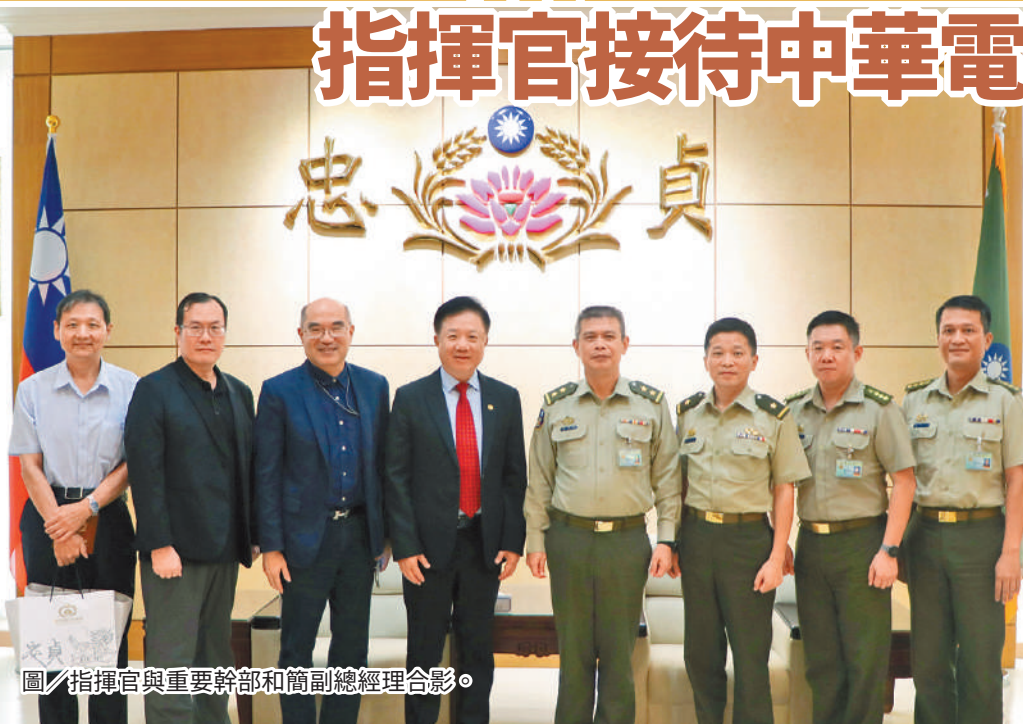
圖／指揮官與重要幹部和簡副總經理合影。

最後，鄭指揮官強調，面對複雜多變的國際安全環境及敵情威脅，憲兵將持恆與友軍、地區警力、民防團隊等單位建立完善橫向通聯機制，結合全民意志與力量，建構堅實防衛體系，確保國家整體安全。