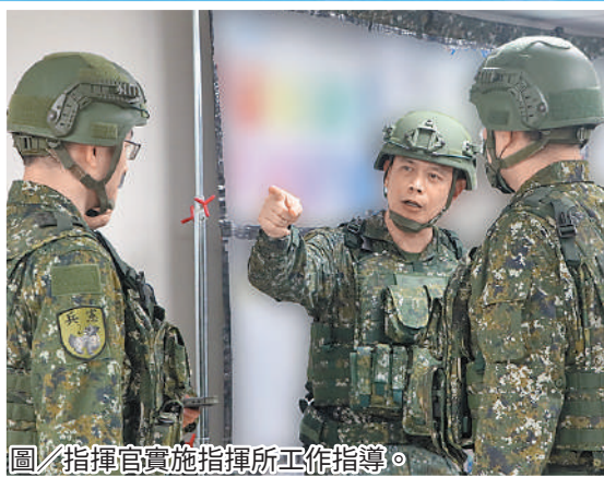
圖／指揮官實施指揮所工作指導。