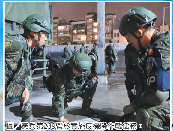
圖／憲兵第239營於實施反機降作戰任務。