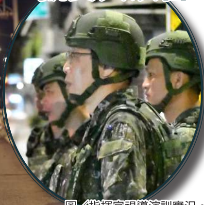
圖／指揮官視導演訓實況。

陳指揮官亦提醒，本次演習強調結合實戰環境，設計不同狀況誘導部隊實施演練，各級幹部應注意「風險管理」的重要性，針對演練中發生的狀況，須以靈活的方式轉換戰術運用，同時掌握所屬官兵任務執行的現況，以確保演習萬全。