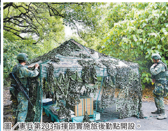
圖／憲兵第203指揮部實施旅後勤點開設。