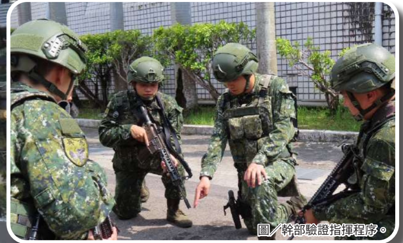
圖/幹部驗證指揮程序。

為充分驗證各項聯戰計畫作為與戰力防護的能力，憲兵第239營於忠愛營區實施陣地防空防護演練，展現出國防衛作戰能力，並顯現部隊高效能戰力。 營長周中校表示，透過平時的狀況演練，使部隊於演練時能依程序及各項步驟要領執行任務，除能強化部隊戰術作為及培養突發狀況的應變能力，確維整體作戰效能。 (文/憲兵第239營吳芷容中尉)