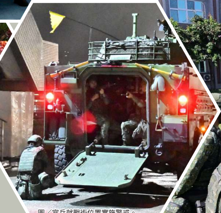
圖/官兵就戰術位置實施警戒。