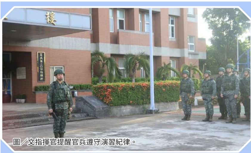
圖／文指揮官提醒官兵遵守演習紀律。