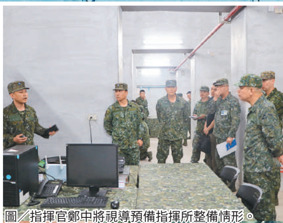
圖／指揮官鄭中將視導預備指揮所整備情形。