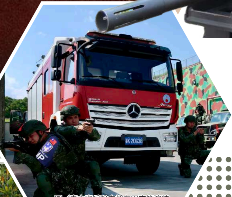
圖/臺中憲兵隊支援友軍交管演練。