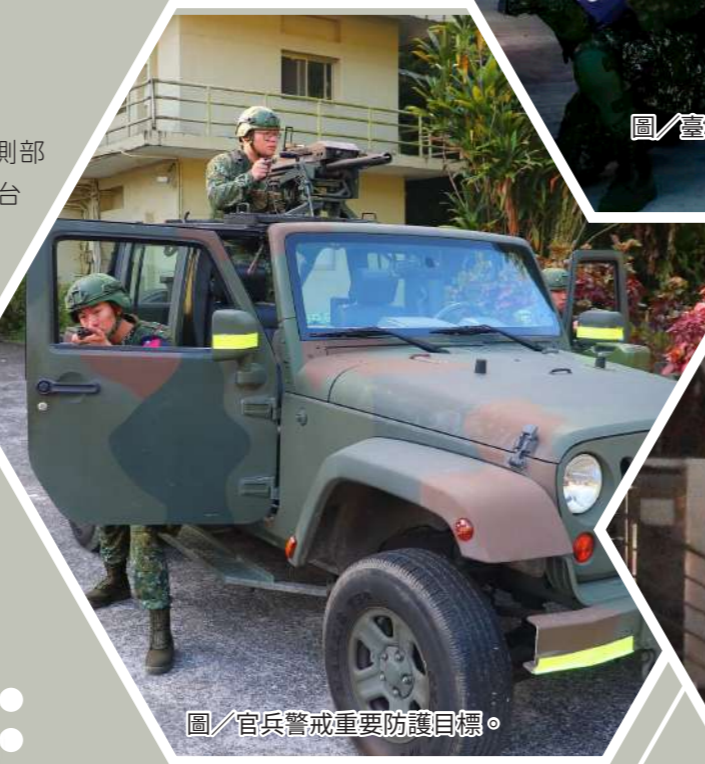
圖/官兵警戒重要防護目標。