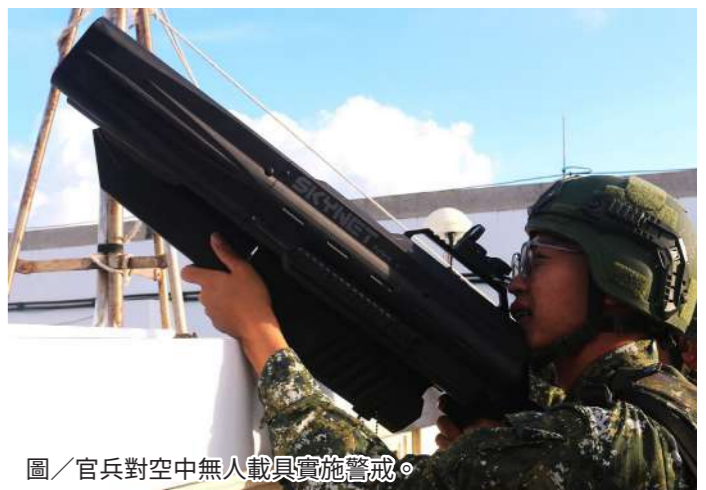
圖/官兵對空中無人載具實施警戒。

為提升營區整體防護能量，憲兵第204指揮部於「漢光40號演習」實兵操演第一日實施「電光操演」，置重點於驗證「營區整體防護」、「指管通聯」及「戰傷救護」等3項作為，使參演官兵能更進一步瞭解戰時營區整體安全防護技巧。 指揮官文少將表示，期盼透過本次實兵驗證，強化官兵執行「營區整體安全防護」與「指管通聯」等能力，深化人員標準作業程序觀念，藉以建構憲兵堅實戰力，確保作戰區軍事任務達成。 (文/憲兵第204指揮部少校張翰浚)