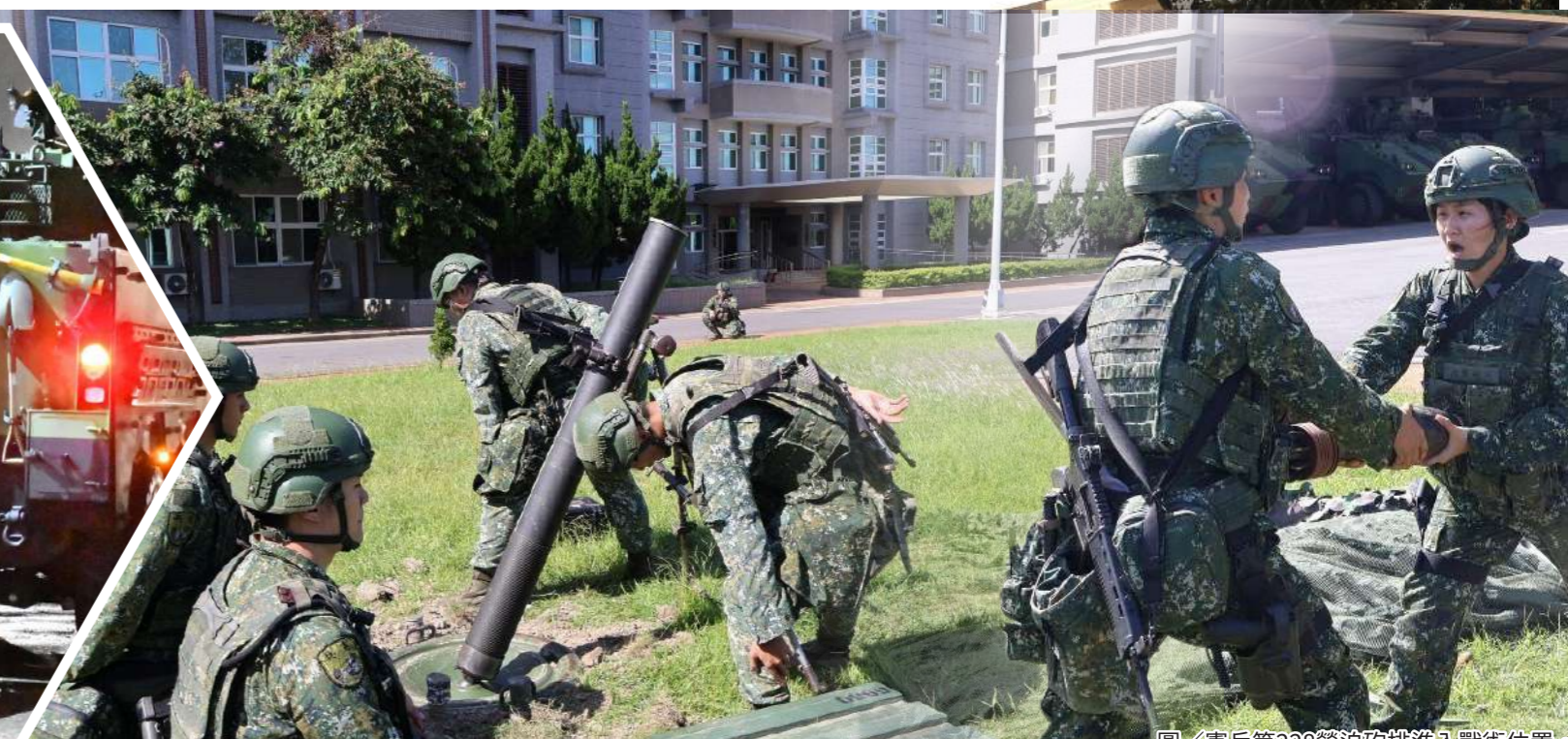
圖/憲兵第228營迫砲排進入戰術位置。