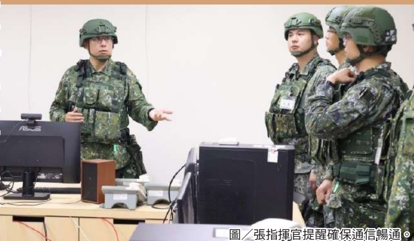
圖／張指揮官提醒確保通信暢通。