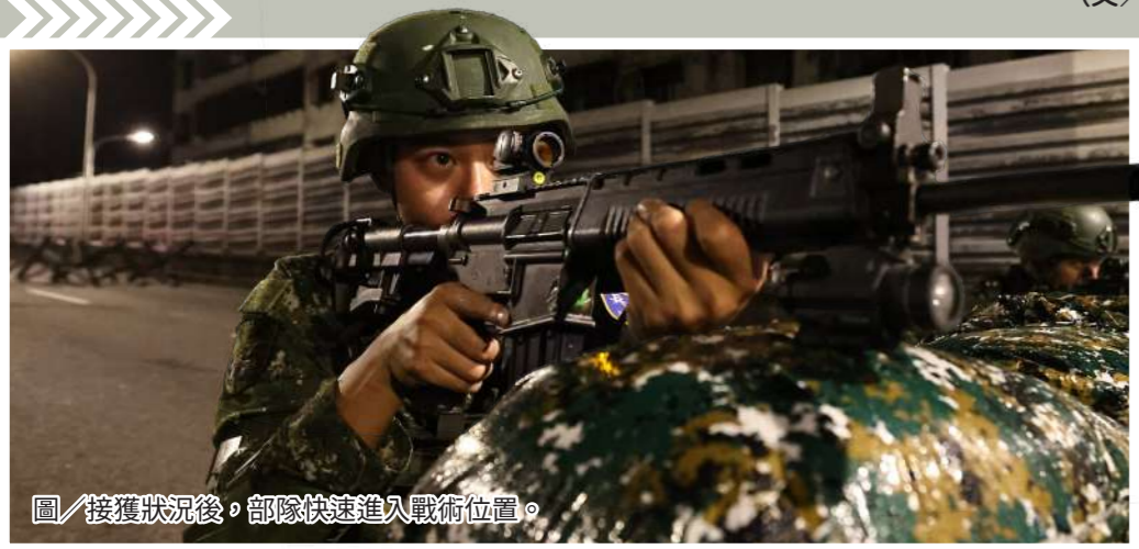
圖/接獲狀況後，部隊快速進入戰術位置。

共同執行橋樑與重要道路檢管作業，檢測部隊實戰化訓練成果。此外，藉模擬散播「台北市淪陷」等錯假訊息，透過運用當地里長廣播，並向民眾進行澄清，以驗證錯假訊息處置方式。 (文/本報訊)