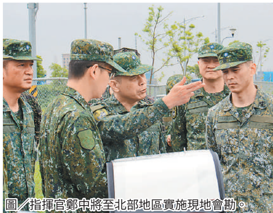
圖／指揮官鄭中將至北部地區實施現地會勘。