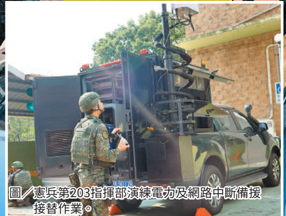
圖／憲兵第203指揮部演練電力及網路中斷備援接替作業。