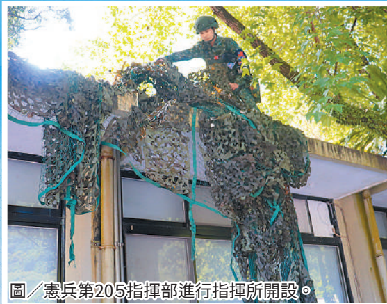
圖／憲兵第205指揮部進行指揮所開設。