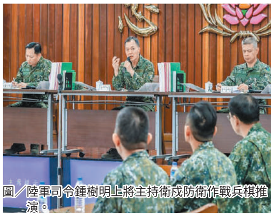
圖／陸軍司令鍾樹明上將主持衛戍防衛作戰兵棋推演。