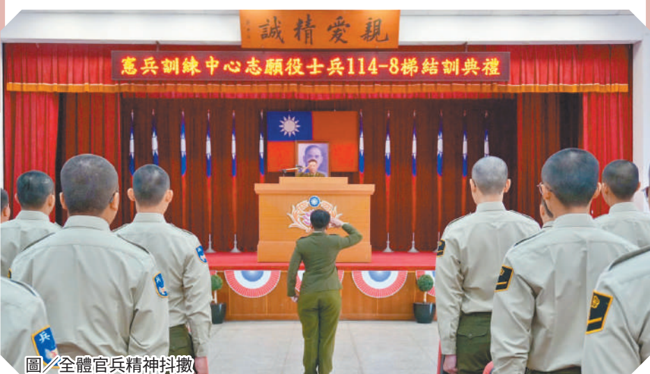
圖／全體官兵精神抖擻

莊指揮官期勉結訓人員延續訓練期間建立之自律與團隊觀念，分發新單位後，儘速適應單位環境，投入各項任務，逐步累積經驗，發揮所學。