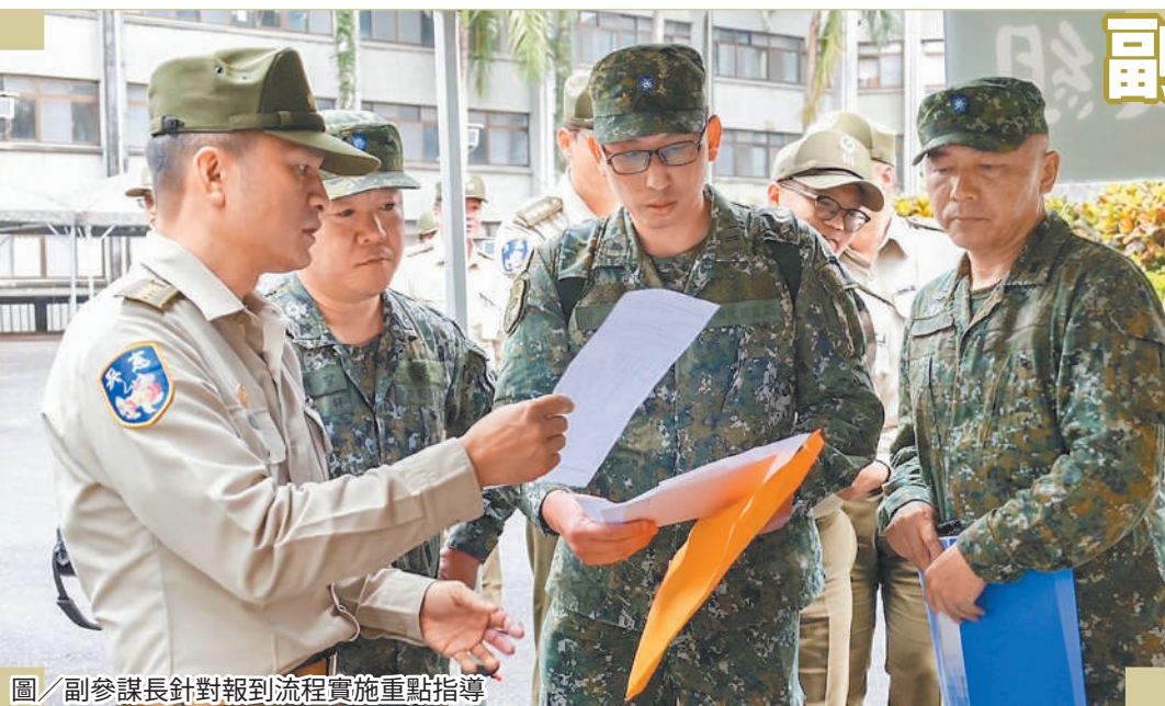
圖／副參謀長針對報到流程實施重點指導

楊副參謀長表示，示範觀摩在於統一作業標準，各級幹部應透過現地觀摩與經驗交流，檢視作業流程，將相關作法融入後續教育召集訓練，以發揮實效。