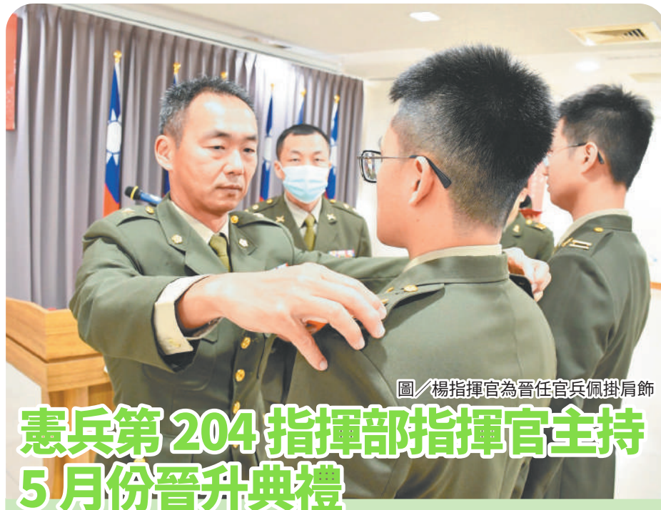
圖／楊指揮官為晉任官兵佩掛肩飾