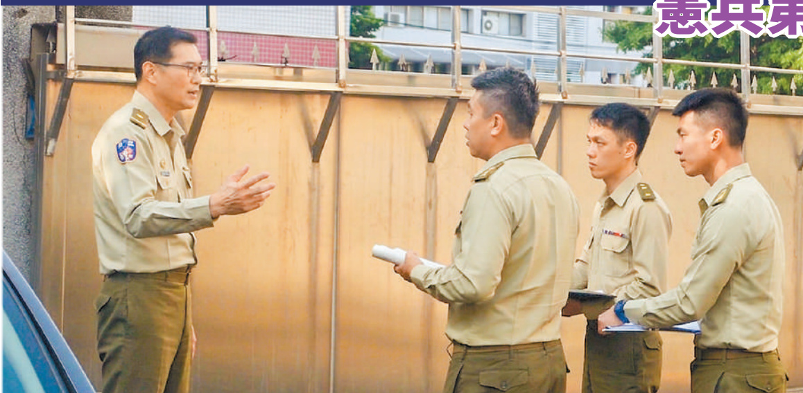
圖／李指揮官提醒幹部重視內部管理

視導期間，李指揮官指示單位幹部善用集會時機，加強行車安全、防詐騙及飲食衛生等宣導作為；同時檢討值日官室動線與門禁管制作業，明確律定人員進出規範，妥善規劃會客室運用，並要求各級幹部持續落實安全管理與風險防制作為，以防杜危安。