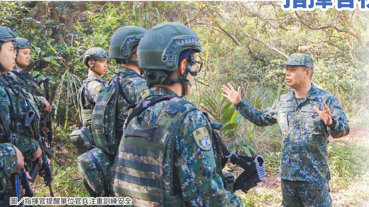
圖／指揮官提醒單位官兵注重訓練安全

最後鄭指揮官強調，各項訓練工作首重安全，夏令期間訓練應加強熱傷害防範，落實水分補充與急救整備，並提醒幹部重視官兵心緒掌握與情緒管理，在確保安全前提下有效發揮部隊整體作戰能量。