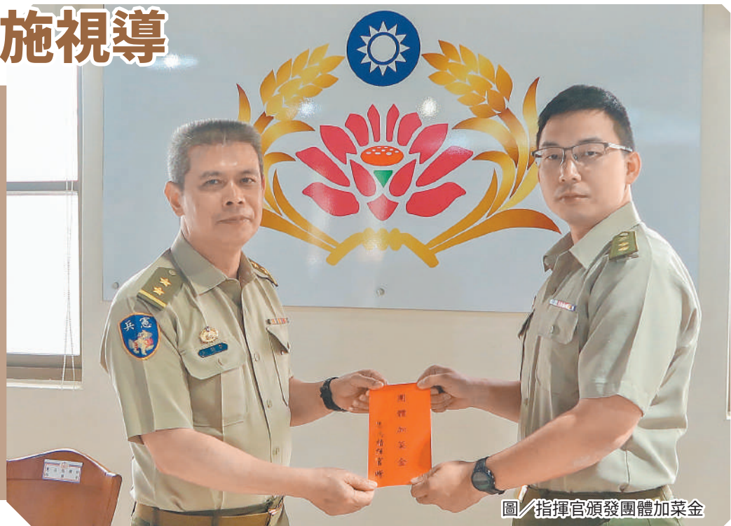
圖／指揮官頒發團體加菜金

另鄭指揮官提醒，憲兵隊係軍司法警察機關，對各類案件應即時受理，各級幹部須妥善律定平、假日待命機制，確保突發狀況能迅速應處，維持勤務運作順暢。