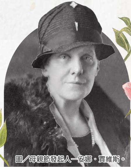
圖/母親節發起人—安娜·賈維斯。

訂於五月第二個星期日，成為法定節日。我國以孝道立國，自民國 42 年起，與世界各地一同慶祝母親節。而節日制定的意義，一是表彰母親對家庭、社會及國家的貢獻，二是希望子女能在母親健在時及時盡孝，傳承家庭倫理親情。