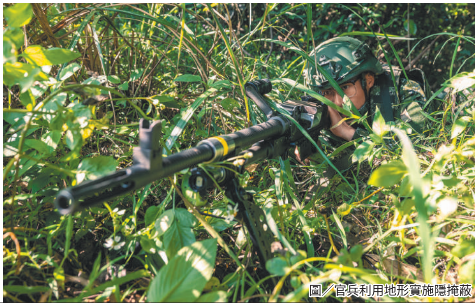
圖／官兵利用地形實施隱掩蔽

演練過程中，小部隊作戰組長著重指令簡化與口令統一，運用前進、後退及左右移等明確用語，使官兵迅速掌握行動方向與作戰目標，強化協同默契。