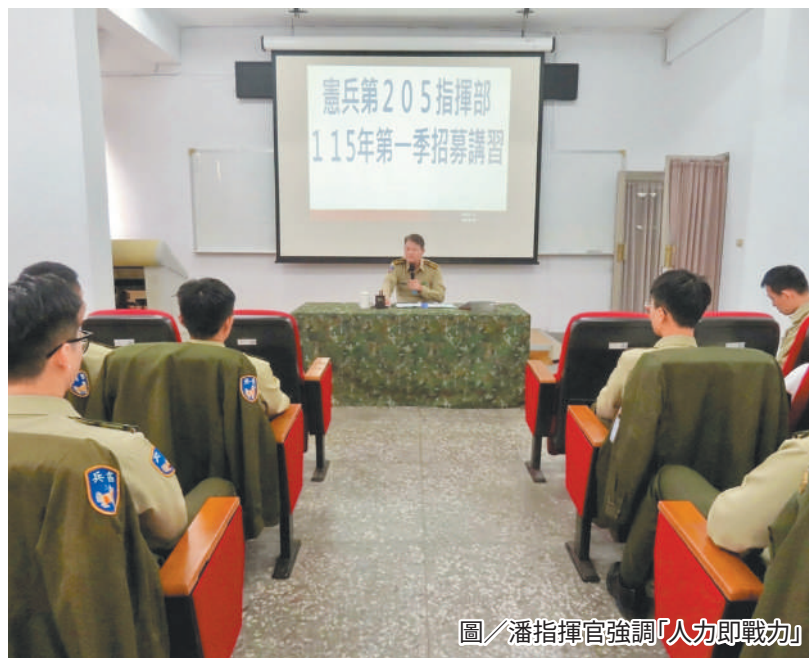
圖／潘指揮官強調「人力即戰力」