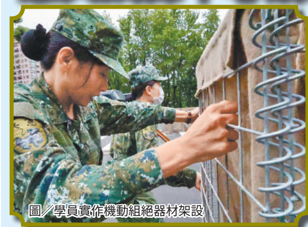
圖／學員實作機動組絕器材架設