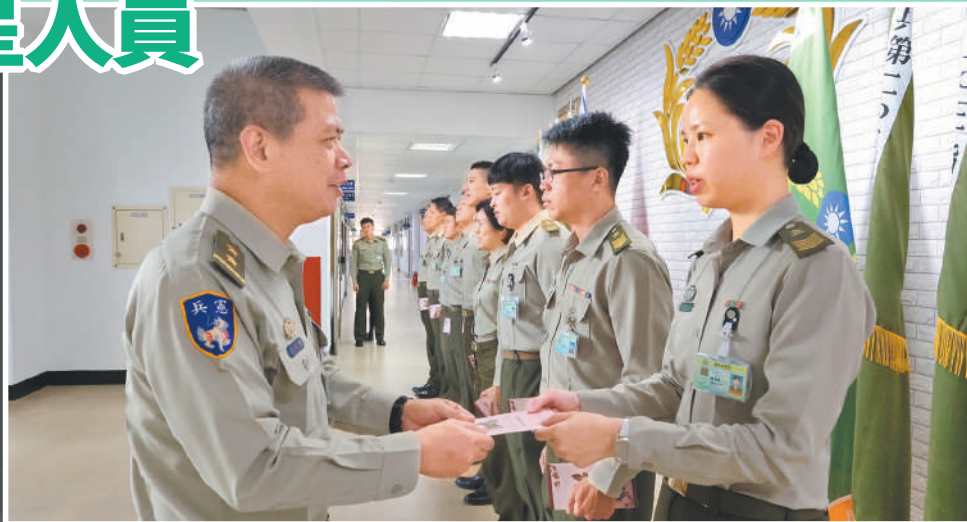
圖／指揮官致贈壽星生日禮券

鄭指揮官指出，部隊是一個團結的大家庭，壽星官兵不僅是同袍，更是並肩作戰的夥伴，透過簡單的慶生活動，不僅增進彼此情感聯繫，也使大家在工作之餘感受關懷與支持，並期勉官兵持續秉持初衷堅守崗位，展現專業素養與高度使命感，共同為憲兵部隊爭取榮譽。