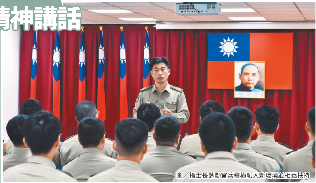
圖／指士長勉勵官兵積極融入新環境並相互扶持

陳士官長以自身經驗分享部隊歷練，提醒幹部在落實領導統御同時，應重視人員適應狀況，適時關懷與輔導，確保訓練與任務安全，進而凝聚團隊向心力；另期勉調職人員隨時掌握自身及同袍狀況，遇有問題即時反映並尋求協處，透過相互支持與照顧，建立穩定安全之工作環境。