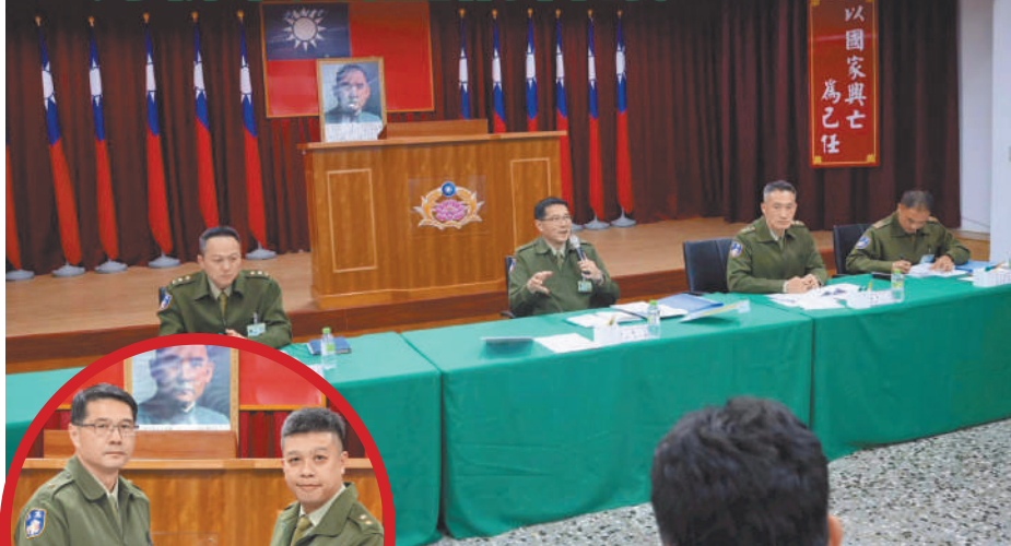
圖／李指揮官強調幹部應落實各項工作執行