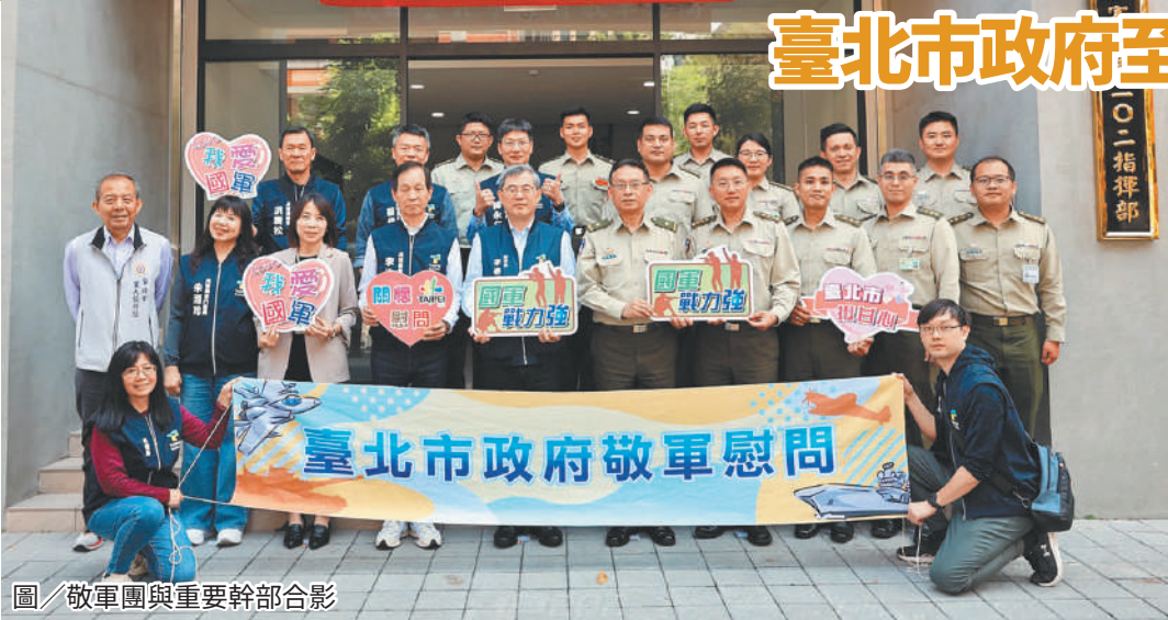
圖／敬軍團與重要幹部合影