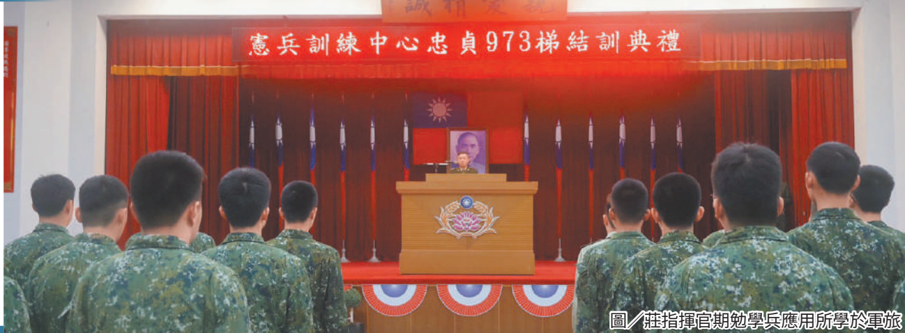
圖／莊指揮官期勉學兵應用所學於軍旅

莊指揮官期勉役男分發至部隊後，能持續精進本職學能，並恪守軍紀規範，成為值得信賴的國家戰士。