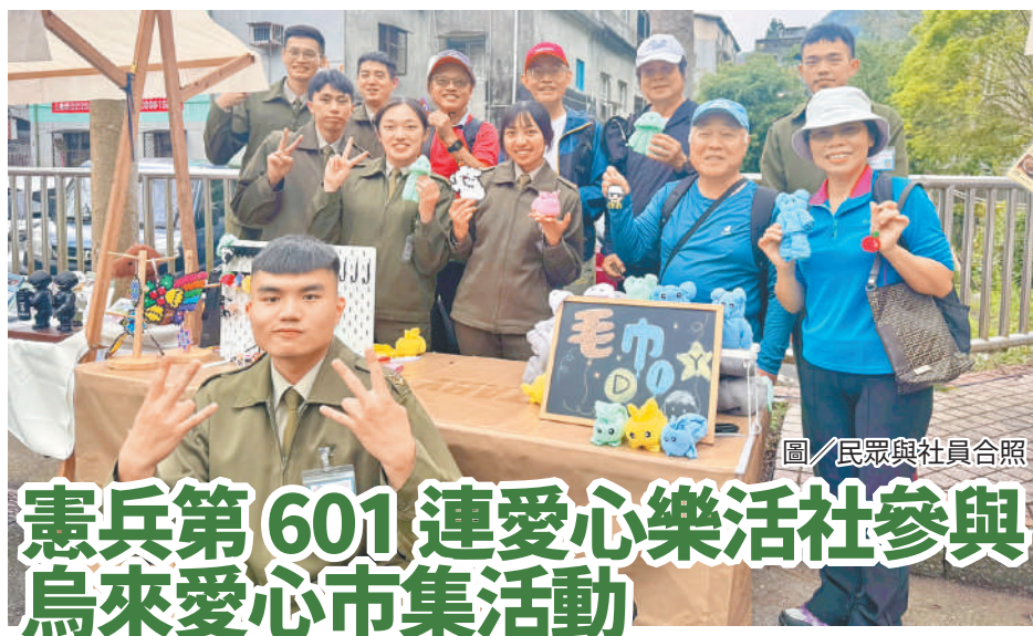
圖／民眾與社員合照