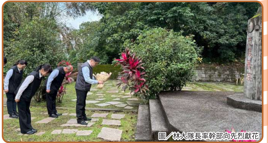
圖／林大隊長率幹部向先烈獻花

林大隊長表示，歷史為部隊傳承之基，應承繼先人無私奉獻精神，精進本職學能，落實各項警衛任務，確保勤務執行周延，以實際行動延續忠貞與榮譽。