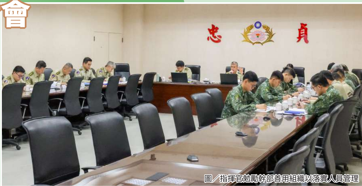
圖／指揮官勉勵幹部善用組織以落實人員管理

鄭指揮官強調，憲兵肩負衛戍中樞及特種警衛勤務之重責，各級主官（管）應落實知官識兵，發掘潛存危安人員與狀況，適時輔導與轉介，並發揮建制組織功能，加強內部管理，提高幹部風險預警敏銳度，妥採應處作為，才能確保任務萬全。