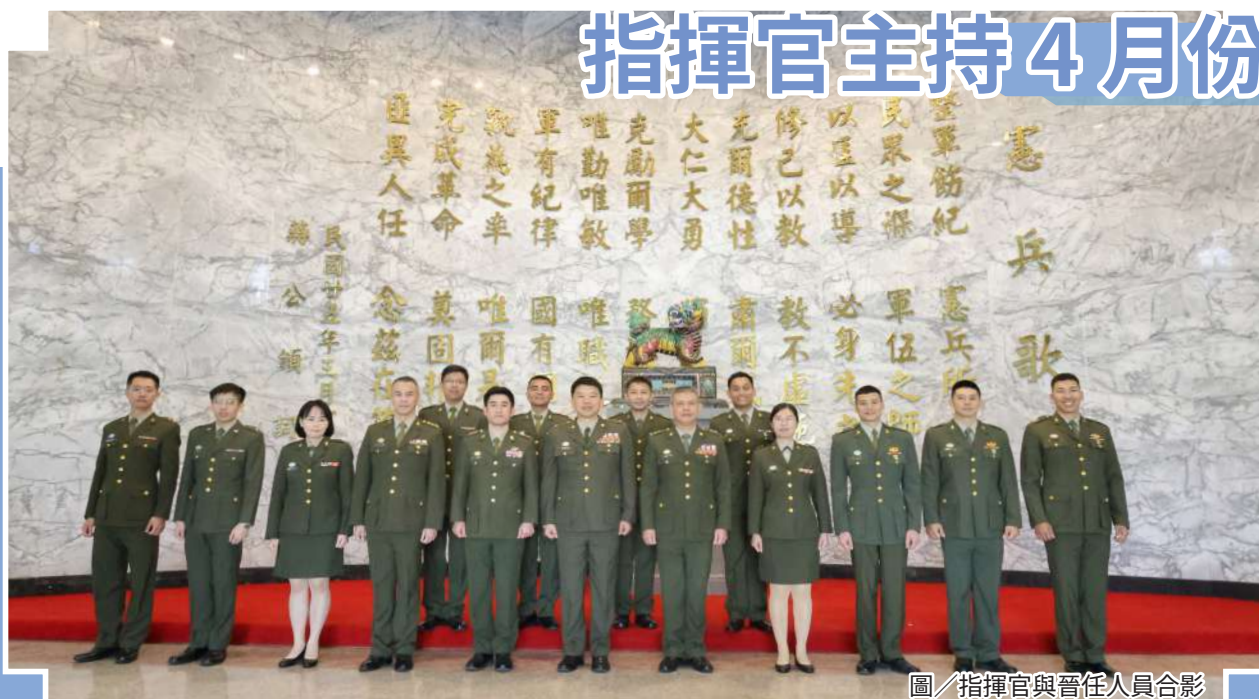
圖／指揮官與晉任人員合影