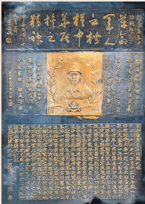
圖／楊榮華烈士紀念碑

為拯救誤闖鐵軌之學童，遭火車撞擊身故，其英勇事蹟為官兵樹立典範。烈士雖已逝去，卻不曾被人遺忘，今日，每一位官兵都有責任，信守「捍衛國土、守護民眾」的堅定立場，共同寫下屬於當代憲兵的榮光。