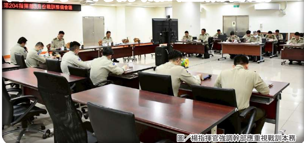
圖／楊指揮官強調幹部應重視戰訓本務

楊指揮官表示，各級幹部應秉持務實態度，落實戰訓本務與內部管理作為，並強化官兵生活照顧與軍紀宣導，針對不當借貸及營外兼差等風險加強防處；另適逢清明連續假期，須嚴守戰備留值規定，妥善規劃休假與勤務調配，確維部隊紀律與整體戰力。