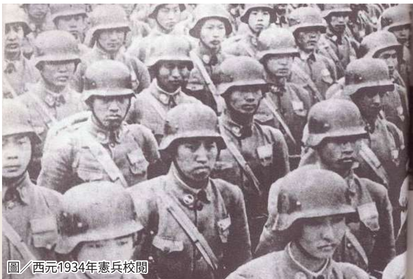
圖／西元1934年憲兵校閱

飲水思源，感謝曾為這片土地灑下血汗的先人和憲兵前輩，展現軍人不忘本、不忘史實，最真誠的信念。