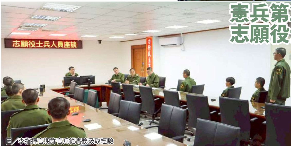
圖／李指揮官期許官兵從實務汲取經驗

李指揮官表示，新進官兵若在適應或生活上遭遇問題，可第一時間向幹部反映尋求協助；另鼓勵運用軍中進修資源，在不影響本務工作前提下持續精進專業能力，同時提醒官兵嚴守法規與勤務紀律，展現忠貞、專業與榮譽的憲兵形象。