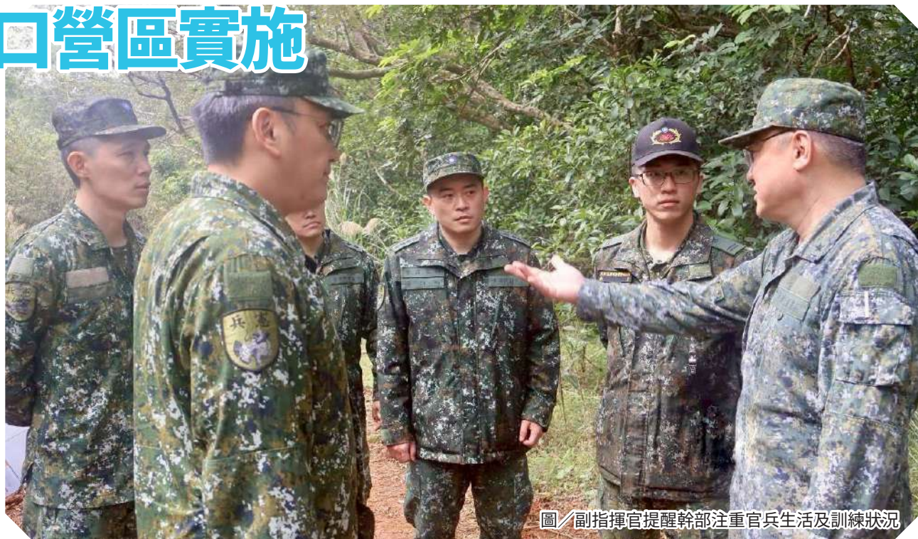
圖／副指揮官提醒幹部注重官兵生活及訓練狀況

于副指揮官表示，針對小部隊戰鬥、CQB 及戰傷救護等核心課目，單位除全力投入訓練外，亦須實施訓後回顧與研討；另提醒各級幹部確實掌握官兵心緒與生活照顧，適時給予關懷與協助，勉勵渠等堅持完成訓練、精進本職學能，以從容面對未來各項任務挑戰。