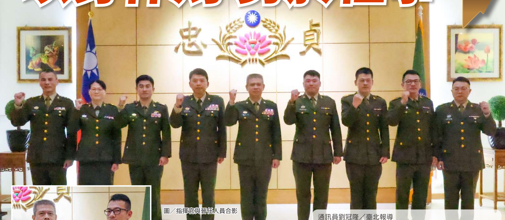
圖 / 指揮官與晉任人員合影