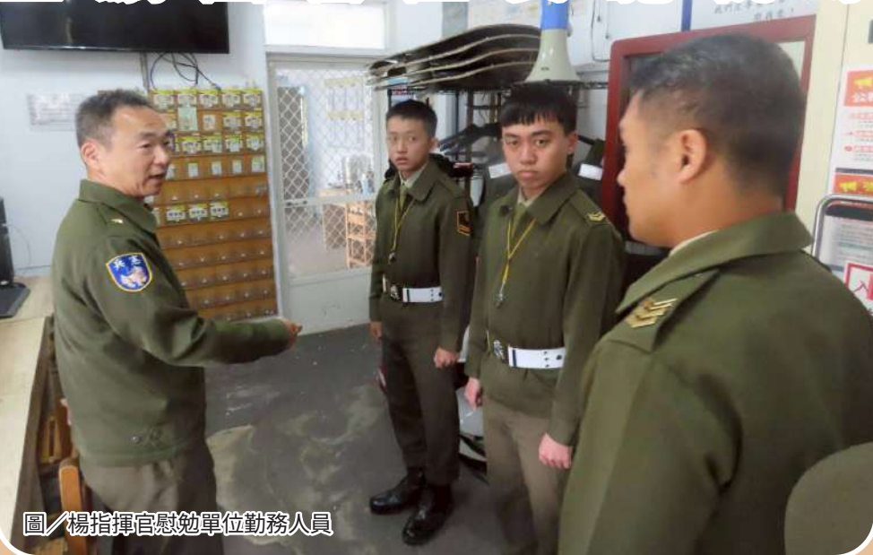
圖／楊指揮官慰勉單位勤務人員