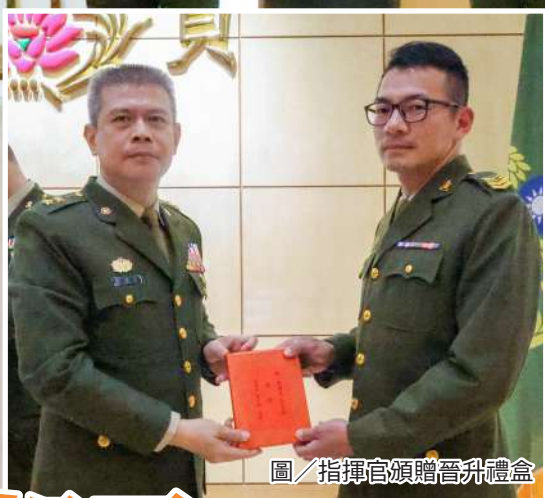
圖 / 指揮官頒贈晉升禮盒