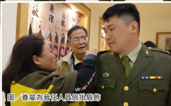
圖 / 眷屬為晉任人員佩掛肩飾