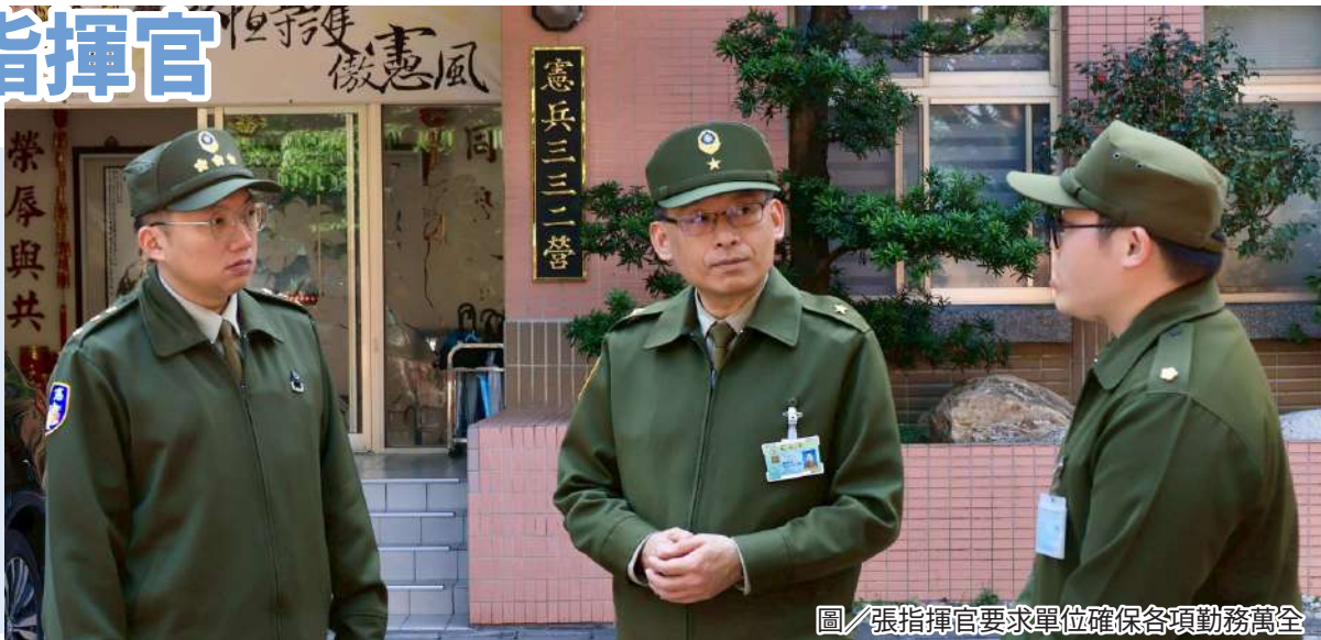
圖／張指揮官要求單位確保各項勤務萬全

張指揮官表示，單位平時執行各項戰備與警衛任務，各級幹部應落實人員管理與勤務交接，確保任（勤）務萬全，最後提醒官兵注意天候變化，加強保暖與自我照顧，以維持良好執勤狀態。