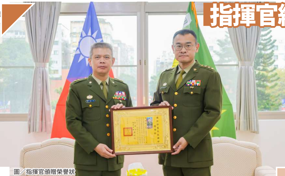
圖／指揮官頒贈榮譽狀

鄭指揮官期勉屆退幹部在卸下戎裝後，仍能保持「一日憲兵、終身憲兵」的信念，在人生新階段持續發光發熱，並祝福其未來生活順遂、健康平安。此外，單位亦安排專人說明退伍相關福利、服務及離退保密注意事項，為屆退幹部多年並肩奮戰的歲月畫下圓滿句點，同時也幫助其展開嶄新的人生旅程。