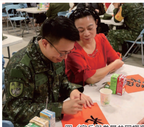
圖／官兵與眷屬共同揮毫