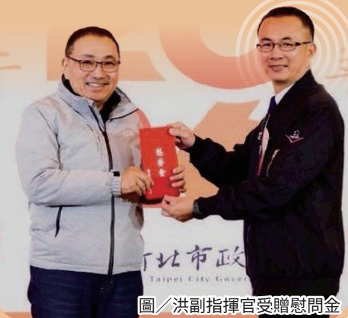
圖／洪副指揮官受贈慰問金

洪副指揮官表示，此次感謝晚會，不僅深化軍民情誼，也進一步凝聚全民共識，期盼未來持續與後備體系保持密切合作，共同攜手守護美麗家園。