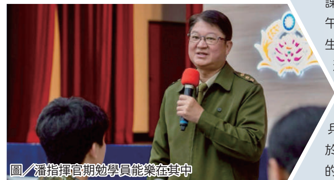
圖/潘指揮官期勉學員能樂在其中