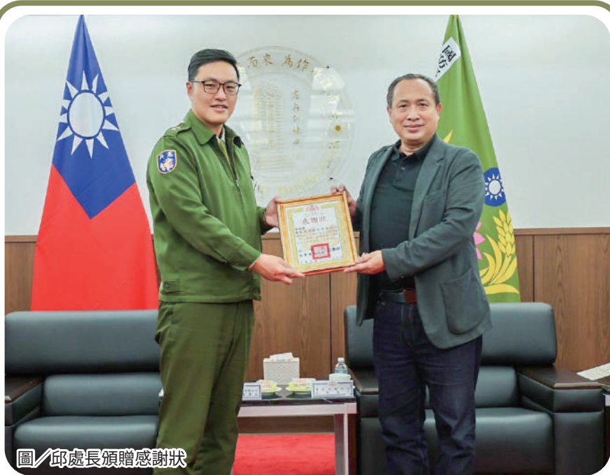
圖／邱處長頒贈感謝狀