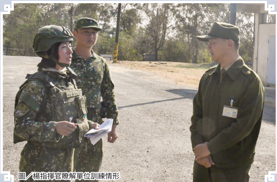
圖／楊指揮官瞭解單位訓練情形

楊指揮官期勉官兵持續精進本職學能，保持訓練動能，穩健提升整體戰力，圓滿達成駐地輪訓任務。