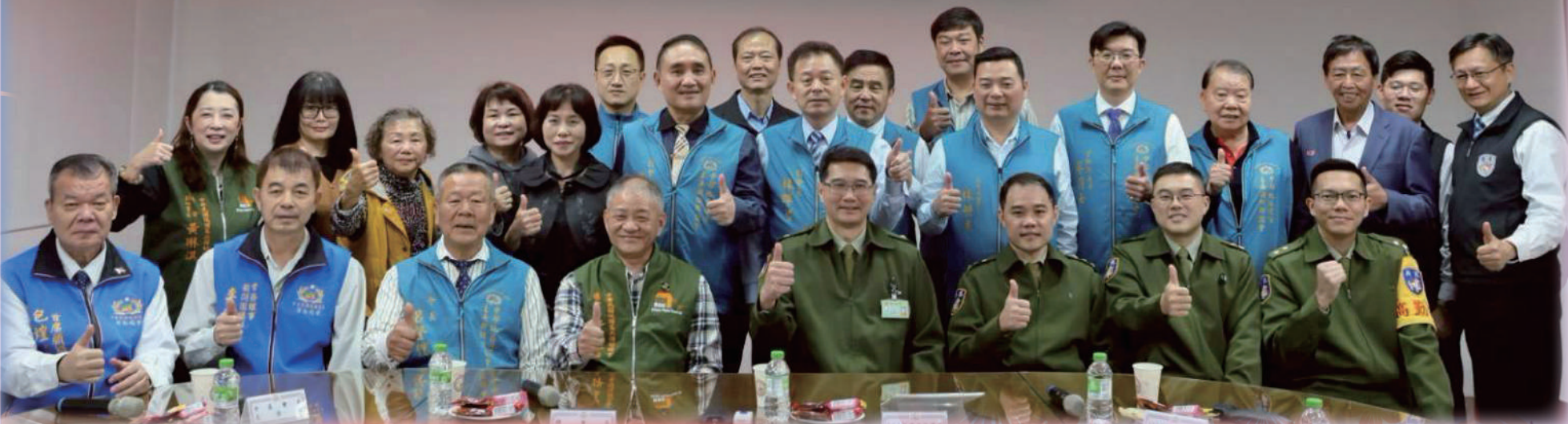
中區後憲歷任主委聯誼會春節敬軍慰問