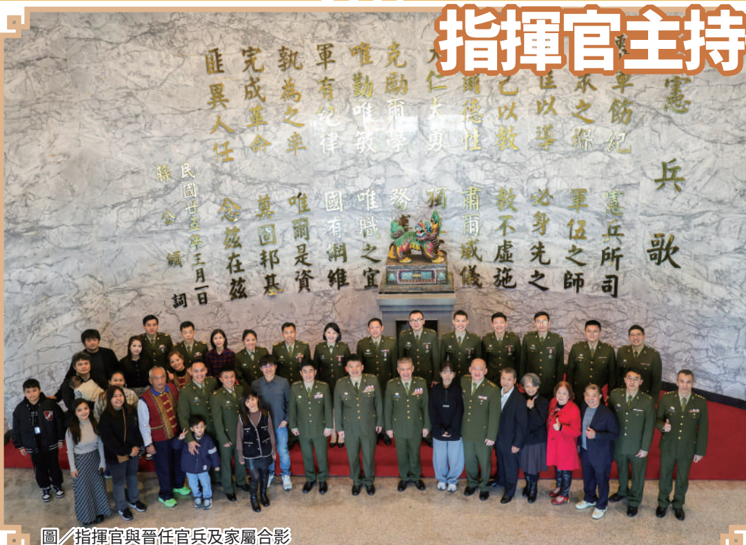
圖／指揮官與晉任官兵及家屬合影