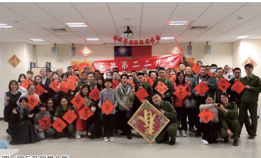
圖／官兵及家屬合影

營長邱中校表示，懇親會是家屬實際了解官兵在部隊生活與工作的好時機，期盼在眷屬的支持與鼓勵下，官兵能全心投入戰訓本務，共同維護憲兵忠貞軍風，為守護國家安全貢獻心力。