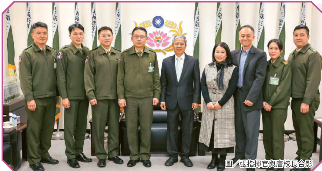
圖／張指揮官與唐校長合影

張指揮官表示，國軍持續完善進修制度與學習環境，鼓勵官兵在服役期間精進專業職能，並透過多元管道強化個人競爭力；唐校長亦表示，學校將結合教學特色，提供友善且具彈性的學習支持，期許透過持續互動交流，建立穩固合作基礎，使軍方與學校在人才培育與從軍志業上相輔相成。