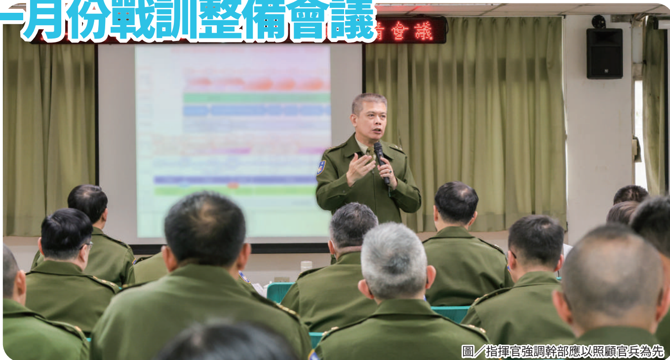
圖／指揮官強調幹部應以照顧官兵為先

鄭指揮官指出，戰演訓為部隊戰力之根本，各單位應依任務特性持續精進訓練規劃與整備作為，確保戰備水準，同時強調內部管理不可偏廢，須兼顧官兵照護、住用空間與營舍環境整潔，營造良好生活與工作環境。勤務派遣方面，應秉持公平原則妥適分配，並要求憲兵隊恪遵執法紀律，以維護部隊形象與公信力。