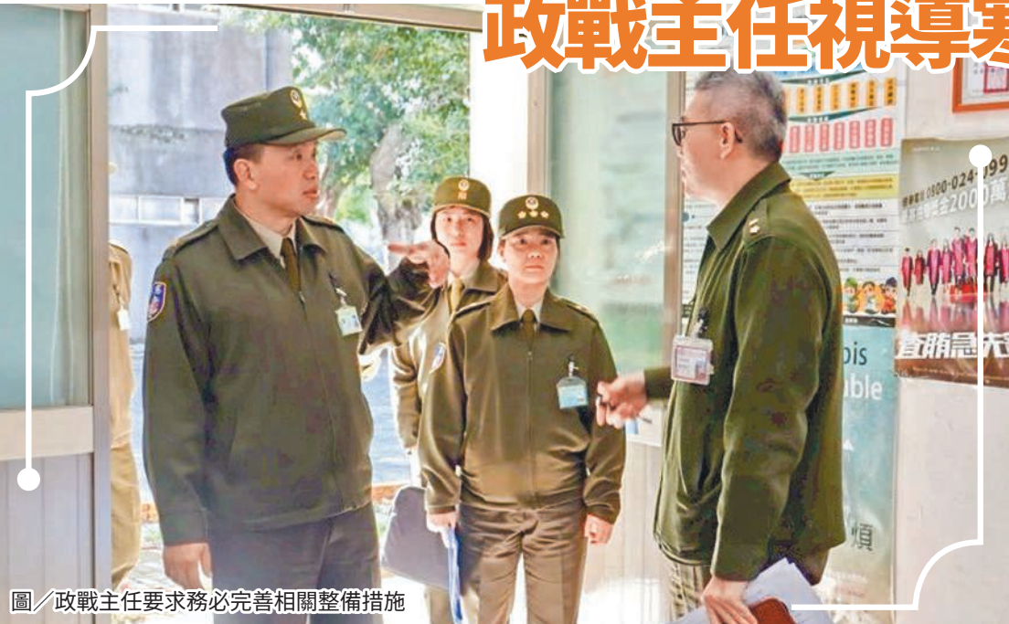
圖／政戰主任要求務必完善相關整備措施

吳主任表示，「鐵衛體驗營」為推動全民國防教育之重要平臺，期勉承辦單位秉持審慎嚴謹態度，周延規劃各項細節，確保活動全程安全無虞，並透過完善課程設計與實務體驗，展現憲兵部隊專業形象，深化國人對憲兵任務特性及國防理念之認識。