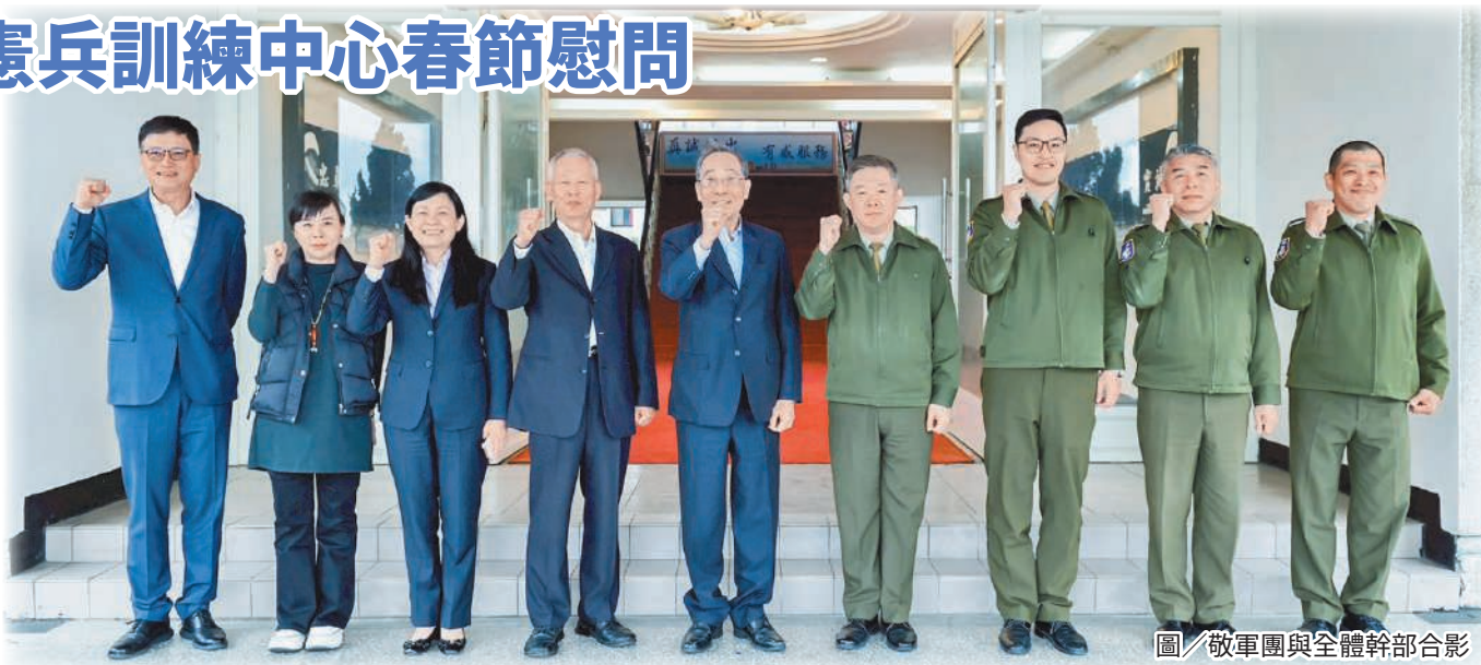
圖／敬軍團與全體幹部合影

莊指揮官表示，軍友保險秉持「取之於社會，回饋於社會」理念，長期於重要節慶慰問國軍官兵，亦感謝企業長期支持國軍建軍備戰，此次慰問不僅讓官兵感受社會溫暖，更彰顯軍民同心、共同推動全民國防的堅實力量。