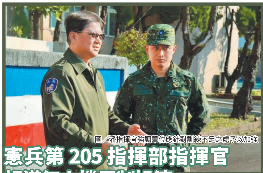
圖／潘指揮官強調單位應針對訓練不足之處予以加強

楊指揮官強調，憲兵任務多元且具挑戰性，幹部應持續落實忠貞氣節教育與軍紀要求，結合實務經驗精進本職學能，深化官兵對單位的認同與責任感，以穩健戰力迎接各項戰演訓及突發任務挑戰。