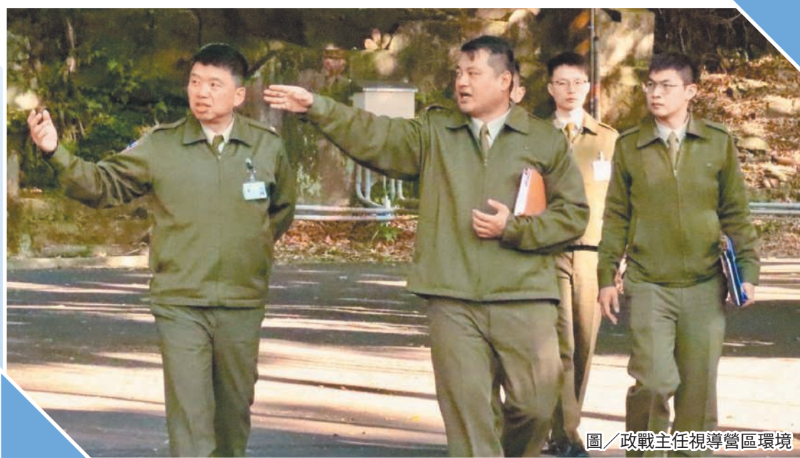
圖／政戰主任視導營區環境

此外，吳主任提醒，近期共諜滲透風險升高，單位須持續強化保密與安全作為，落實官兵生活狀況掌握與異常徵候查察，並加強監視系統管理與營區周邊巡查，確保各項防護措施周延到位，維護營區安全與單位純淨，確保部隊戰力穩定發揮。