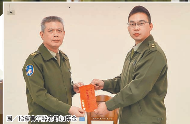
圖／指揮官頒發春節加菜金

鄭指揮官表示，適逢春節前夕，提醒各單位於年節期間，務必周延規劃戰備整備與勤務安排，妥善調配人力，確保任務遂行無虞，同時叮囑官兵嚴守軍紀，注意行車安全與休假紀律，平安過節、安心返營，確保部隊戰力與整體運作穩定。