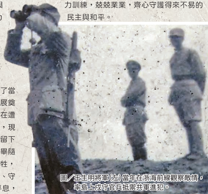
圖／王生明將軍(左)當年在浙海前線觀察敵情，率島上戍守官兵抵禦共軍進犯。

但中共從未對我停止威脅，國軍官兵更未曾妥協，我們緬懷誌念光榮的戰役，我們更會傳承先烈精神，踵武前賢，持續為捍衛國家安全與人民福祉戮力訓練，兢兢業業，齊心守護得來不易的民主與和平。