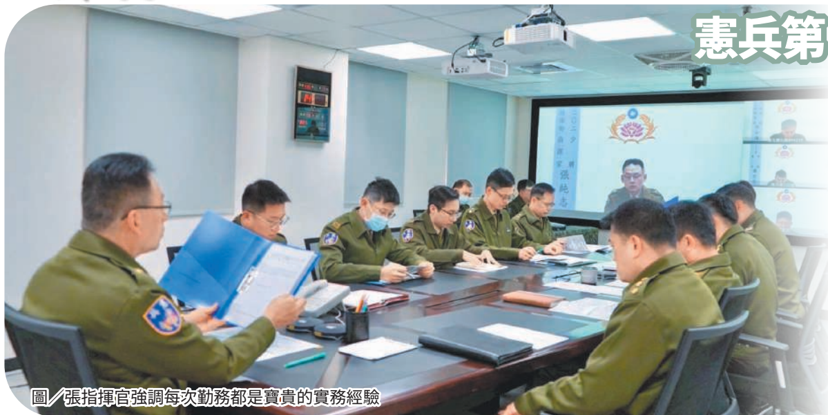
圖／張指揮官強調每次勤務都是寶貴的實務經驗

張指揮官肯定官兵能在高度勤務壓力下恪遵作業程序，確保重要目標與社會秩序安全無虞，並指導幹部務必將本次勤務可再精進之處納入後續重大活動及專案任務整備的重要參考，持續強化整體警衛勤務效能。