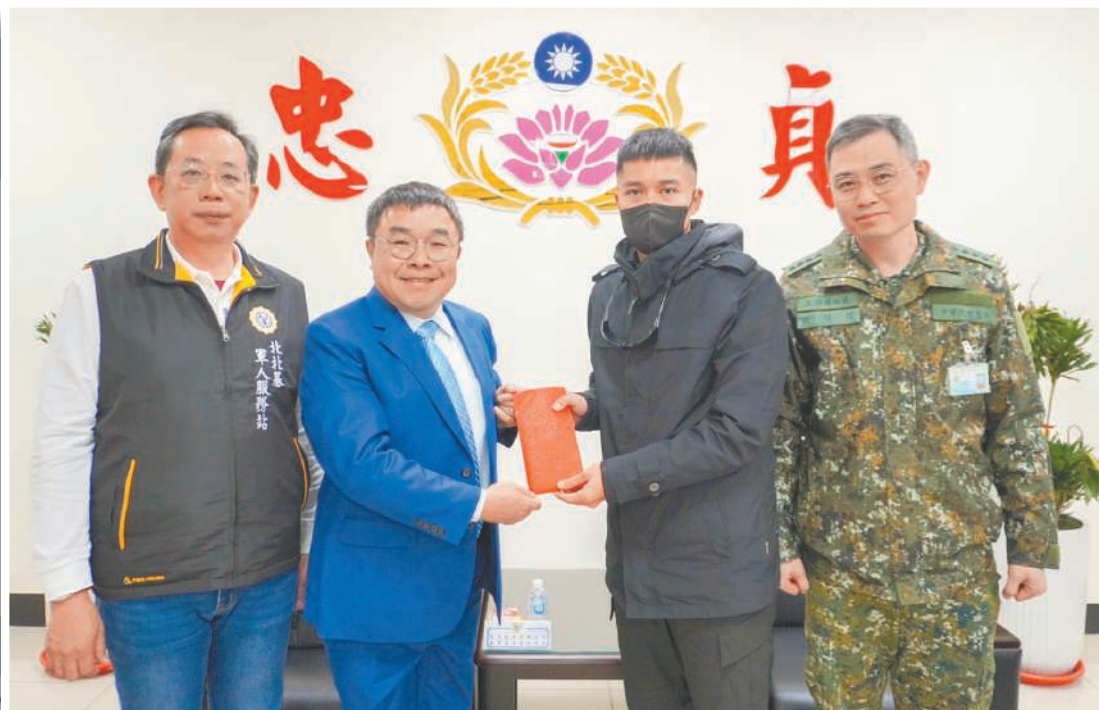
圖／卓董事長頒發慰問金

卓董事長表示，官兵平日全心投入戰備整備與任務遂行，肩負保國衛民重任，展現高度專業與奉獻精神，令人由衷敬佩；此次敬軍慰問，除表達感謝之意，也期盼透過實際行動支持國軍，鼓舞官兵士氣，讓部隊感受到社會各界的肯定與支持。