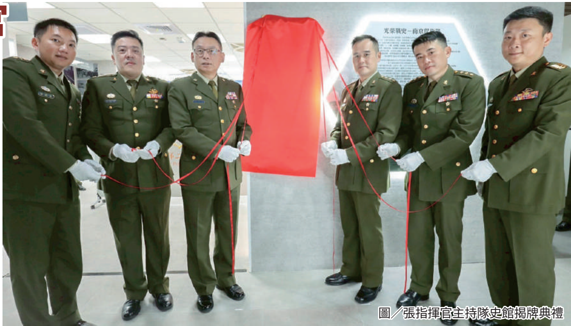
圖／張指揮官主持隊史館揭牌典禮

活動期間同步舉行「憲兵第 202 指揮部隊史館」揭牌典禮，全體官兵共同見證隊史館正式啟用。館內透過史料文物、影像紀錄與任務展示，完整呈現部隊發展脈絡，深化官兵對前輩奉獻精神的認識。張指揮官肯定全體官兵一年來的努力與付出，並期勉同仁秉持憲兵核心價值，嚴守紀律、精進本務，在各項任務中展現專業與榮譽感，持續為部隊發展與國家安全貢獻心力。