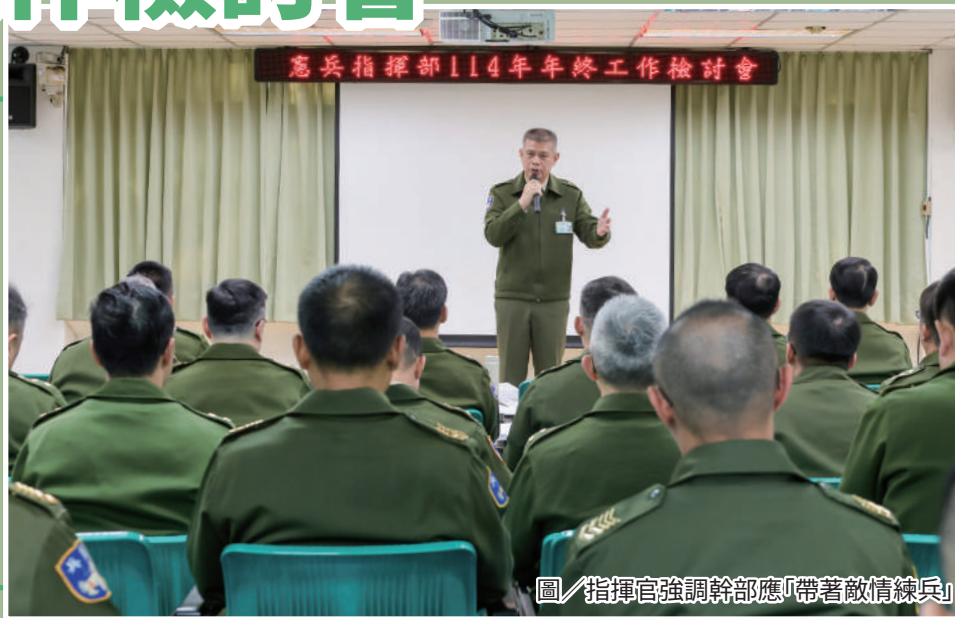
圖／指揮官強調幹部應「帶著敵情練兵」

鄭指揮官指出，情偵能力為憲兵執法基礎，各隊應強化官兵專業職能並熟稔新修訂相關法規，確保任（勤）務依法遂行；在教育訓練方面，強調「訓練即戰力」，各單位除落實駐地訓練外，應結合演訓時機強化戰術位置演練，提升實戰化成效。最後期勉各級幹部，將會議共識轉化為具體行動，落實基層工作，齊心建構堅實憲兵戰力，確保國家與人民安全。