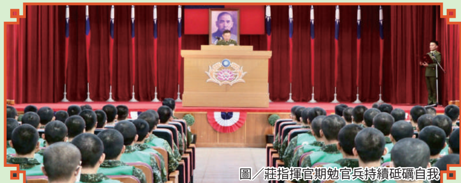
圖／莊指揮官期勉官兵持續砥礪自我

莊指揮官勉勵官兵厚植專業能力，強化部隊核心戰力，並以忠貞氣節精神落實軍風紀律與品德教育，以發揚憲兵優良軍風及傳統。