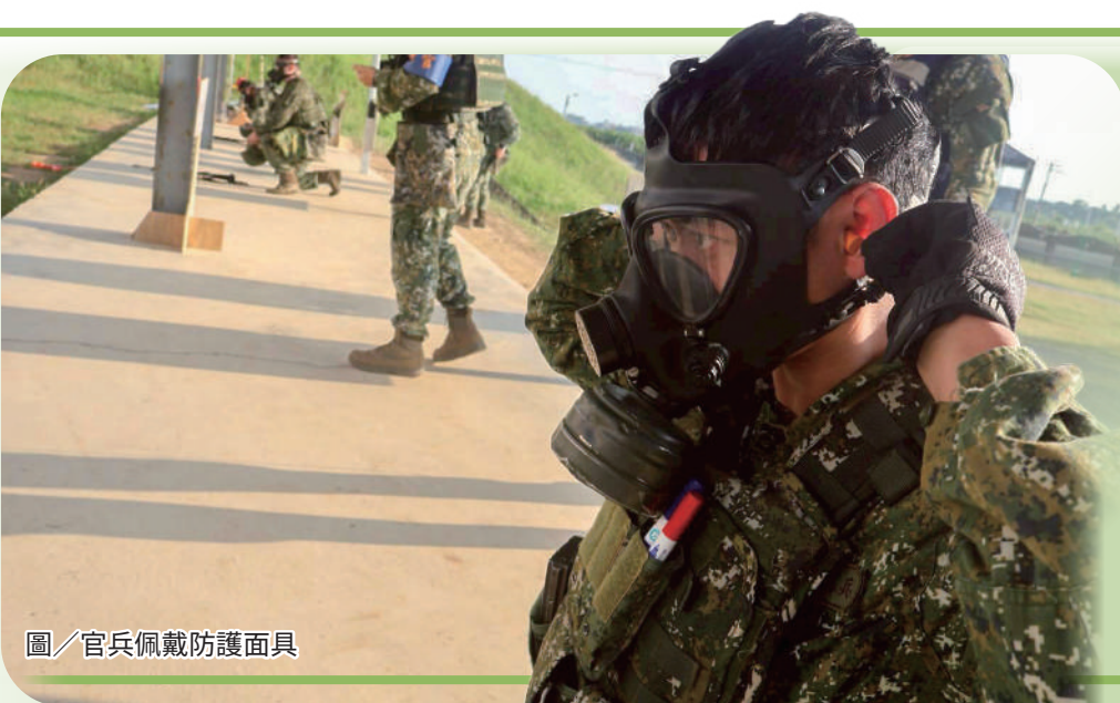
圖／官兵佩戴防護面具

測驗期間，官兵士氣高昂、應處得宜，以最佳狀態完成各項測考，充分展現平日扎實訓練成效。透過本次期末測驗，不僅驗證官兵戰技熟練度與作戰能力，也凝聚單位向心力，為後續任務執行奠定穩固基礎。