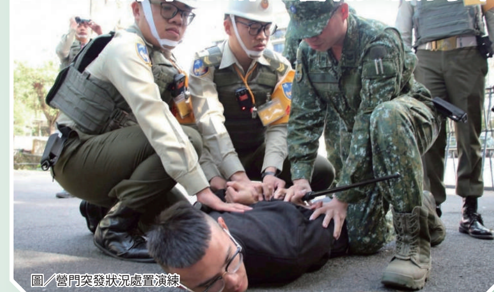
圖／營門突發狀況處置演練