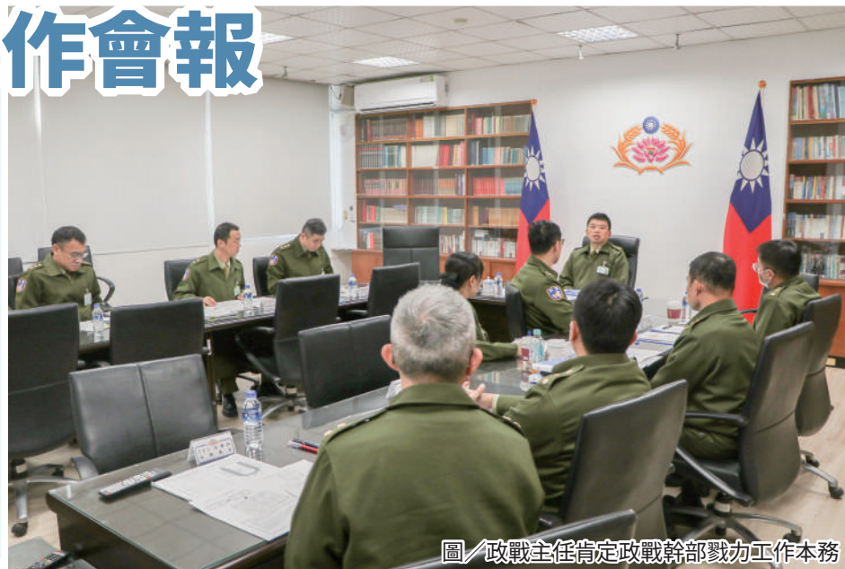
圖／政戰主任肯定政戰幹部戮力工作本務

吳主任提醒各級政戰幹部，政戰幹部務須展現專業職能，落實人員考核及心緒掌握，做好保密檢管與民事協調工作，完善各項政戰整備及危安防處作為，展現政戰工作與時俱進、不可或缺的重要性。