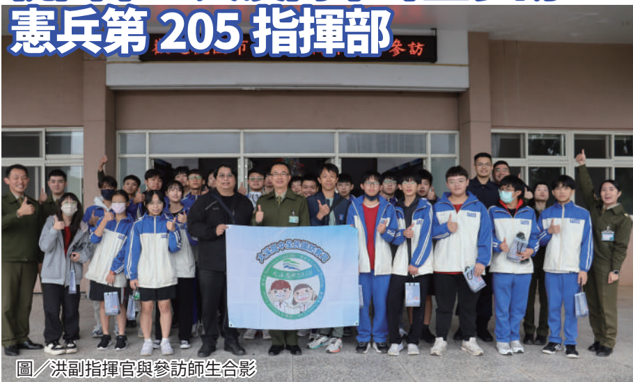
圖／洪副指揮官與參訪師生合影