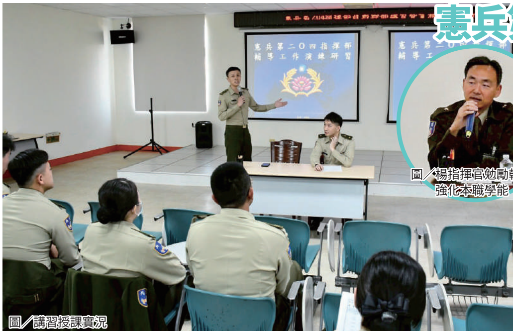
圖／楊指揮官勉勵幹部強化本職學能

憲兵第 204 指揮部指揮官楊少將日前主持 114 年政戰幹部講習暨實務工作研討會，指出政戰幹部肩負穩定思想、凝聚士氣與團結軍心的重要任務，是維繫部隊戰力不可或缺的核心力量，勉勵全體政戰幹部恪守本職，成為主官最堅實的輔佐力量，確保部隊在訓練、勤務與戰備上運作順遂。