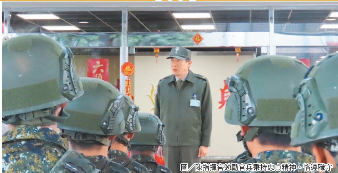
圖／陳指揮官勉勵官兵秉持忠貞精神、恪遵職守

陳指揮官特別指出，幹部要多留意收假人員的心緒狀況，及時發掘協處，以團結部隊向心。