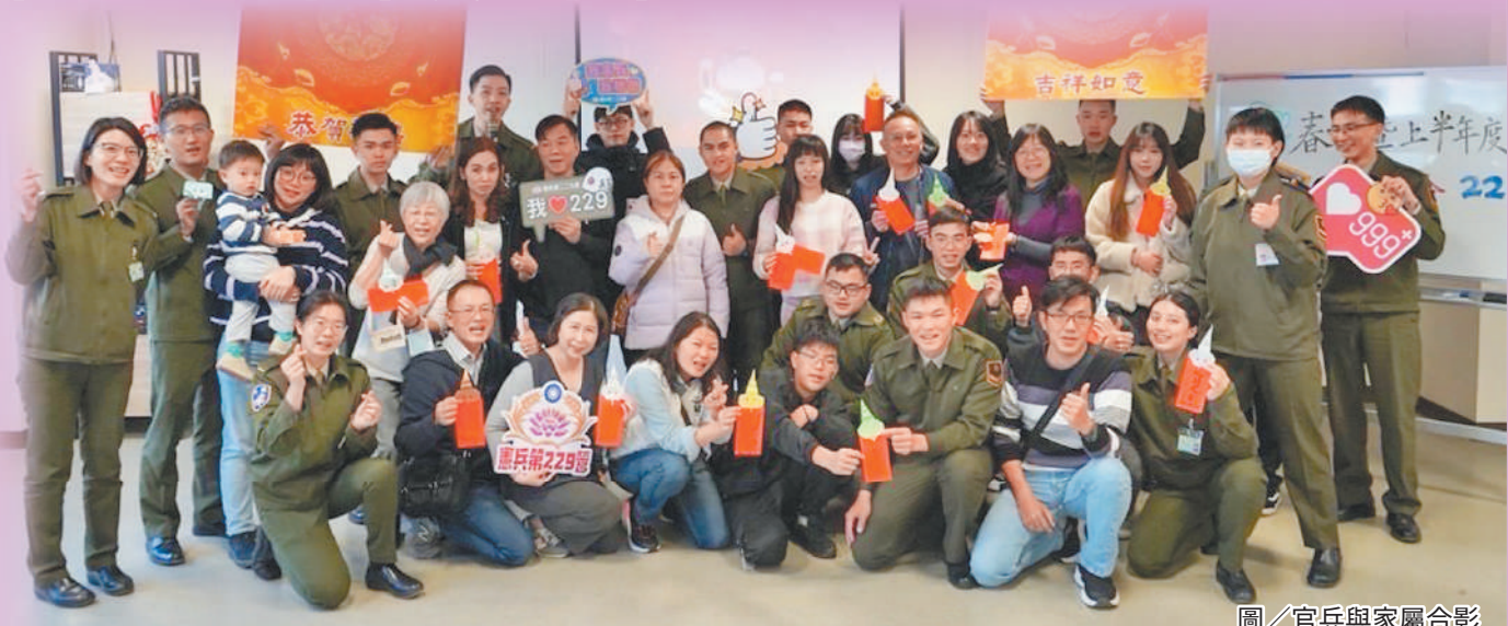
圖／官兵與家屬合影

營長邱中校表示，感謝家屬撥空前來參加懇親會，並提醒官兵利用休假好好珍惜與家人相處的時光，秉憲兵忠貞精神，嚴守軍法紀相關規範，並祝福寶眷新年快樂。