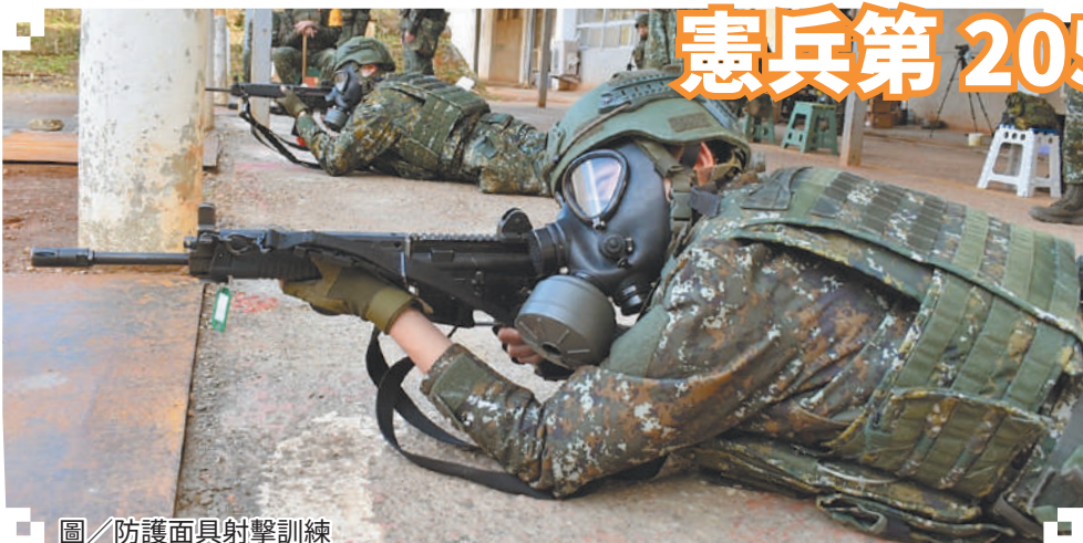
圖／防護面具射擊訓練

參謀主任孫中校指出，射擊能力的培養非一蹴可及，唯有落實扎實訓練，射手方能達到高水準的熟練度，官兵應珍惜每次射擊機會，熟悉射擊要領，確保每位射手在訓練過程中貫徹「程序、步驟、要領」，達成訓練目標。