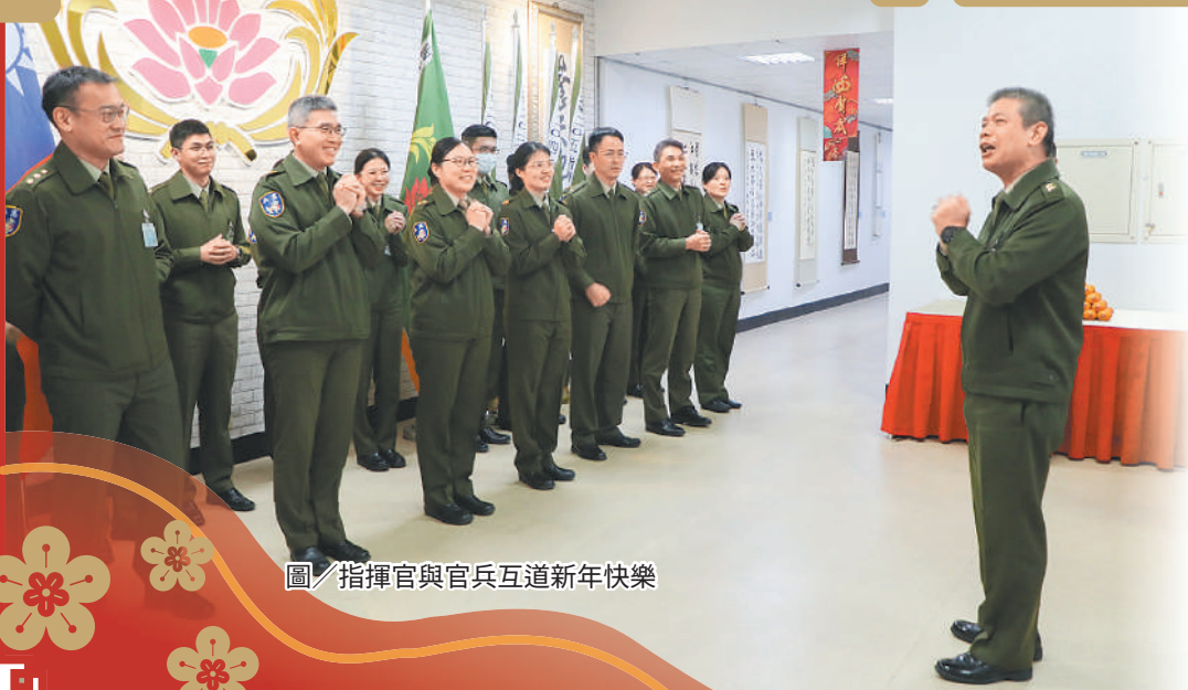
圖／指揮官與官兵互道新年快樂