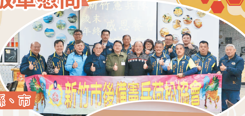
新竹市後備憲兵荷松協會