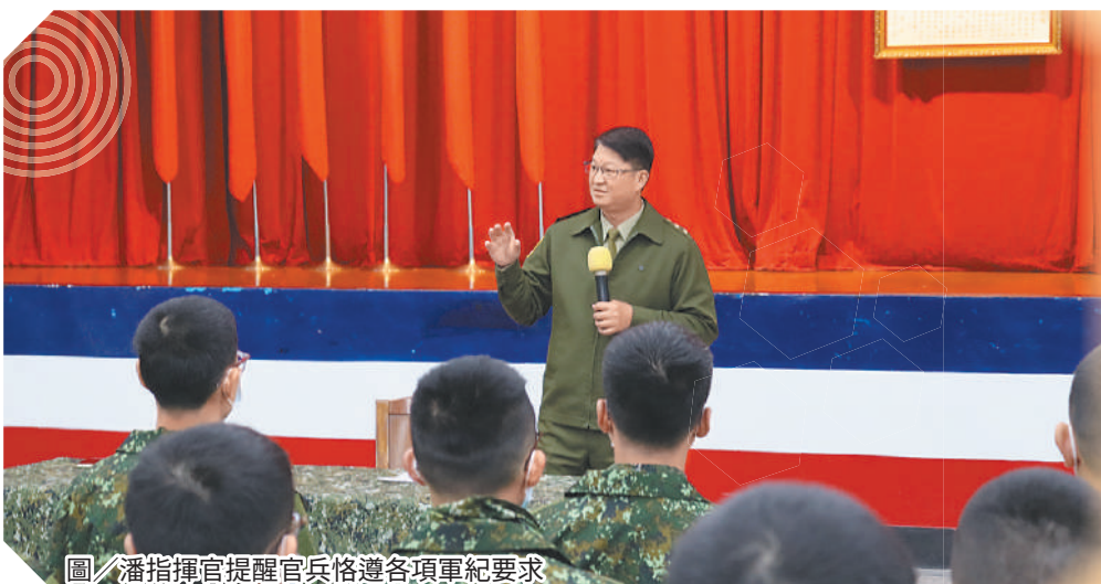
圖／潘指揮官提醒官兵恪遵各項軍紀要求