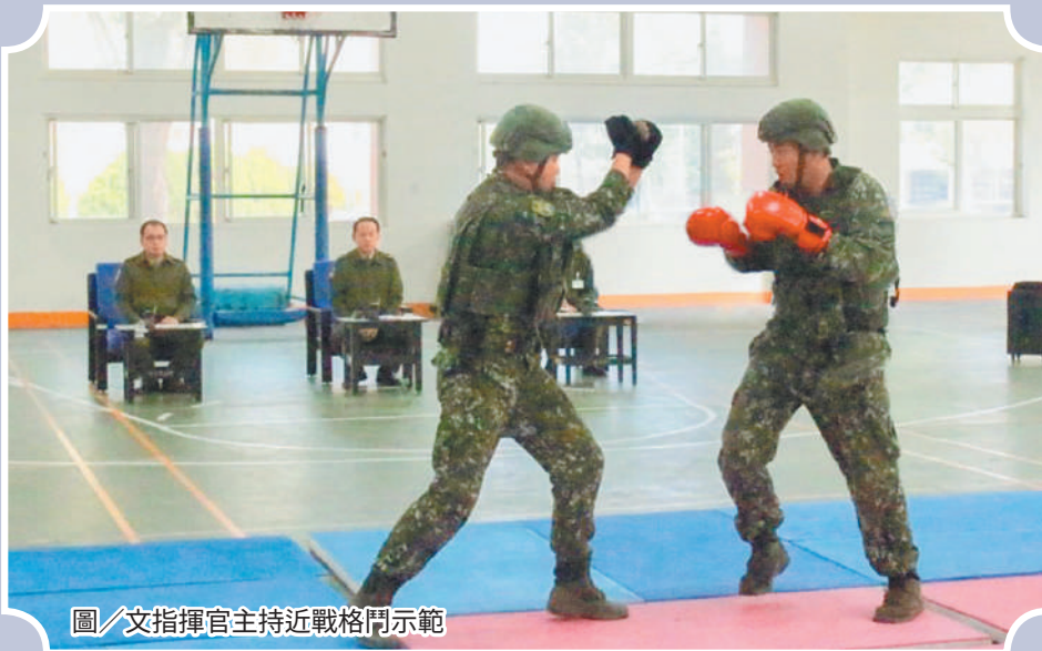
圖／文指揮官主持近戰格鬥示範

文指揮官表示，近戰格鬥為戰場存亡重要的一環，本次示範藉由人員操作、教學觀摩等方式統一標準，期使各單位作法一致，落實教育訓練，才能確保官兵戰場的存活率。