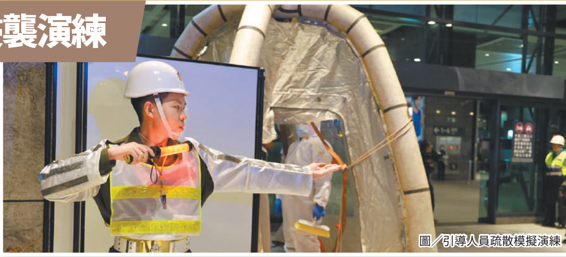
圖／引導人員疏散模擬演練

隊長史上校表示，期許爾後官兵持續藉由各項的演練暨訓練，強化處置及應變的能力，展現憲兵平時勤訓精練的成果。