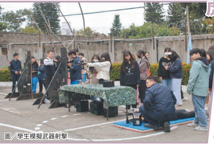
圖／學生模擬武器射擊