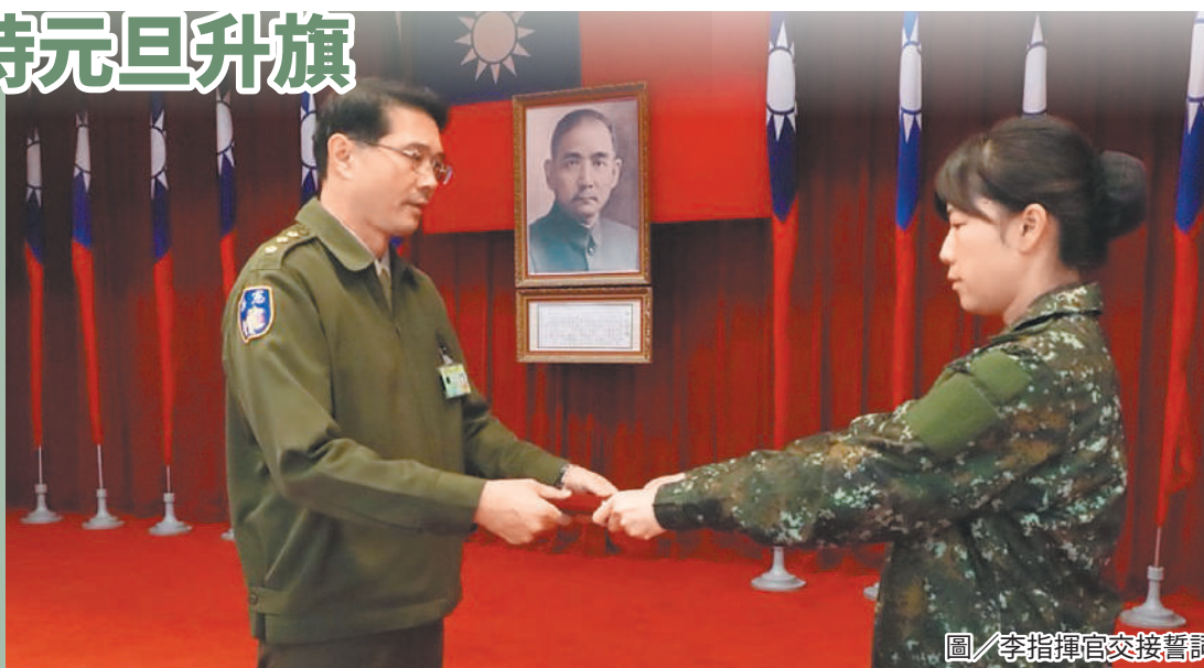
圖／李指揮官交接誓詞

李指揮官強調，勤訓精練是部隊培訓戰力的重要途徑，透過綿密的狀況應處訓練，加強官兵臨機應變之能力，於執勤過程期間，方能預判風險，確保警衛對象萬全。