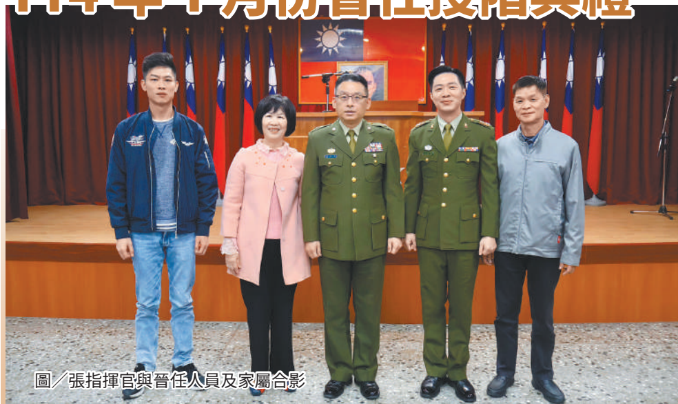
圖／張指揮官與晉任人員及家屬合影