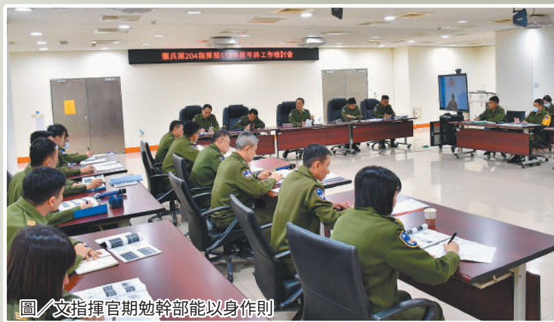
圖／文指揮官期勉幹部能以身作則

最後，文指揮官頒獎表揚年度執行各項工作績優單位，並肯定渠等平時在工作崗位上的努力與付出，期勉來年持續精進，再創新猷。