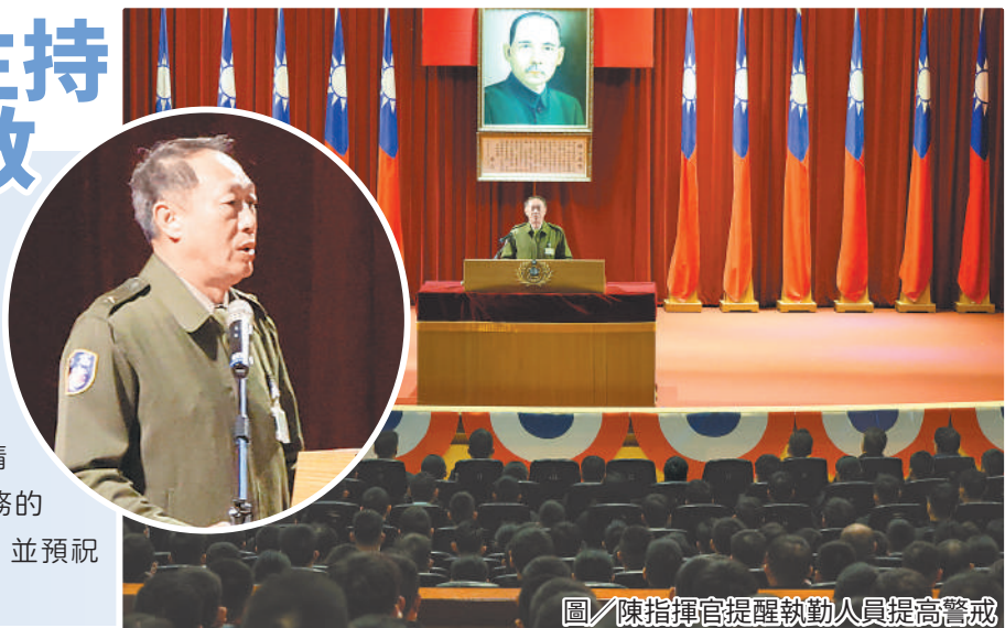
圖／陳指揮官提醒執勤人員提高警戒

最後，陳指揮官期勉勤員在外需謹言慎行，並以竭盡全力的精神，鞏固安維對象安全，完成任務的同時也驗證平日勤訓精練之成果，並預祝本次升旗典禮警衛勤務圓滿順利。