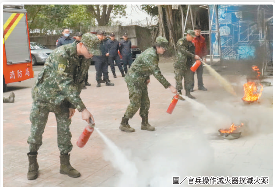
圖／官兵操作滅火器撲滅火源