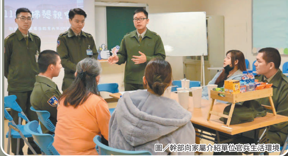
圖／幹部向家屬介紹單位官兵生活環境