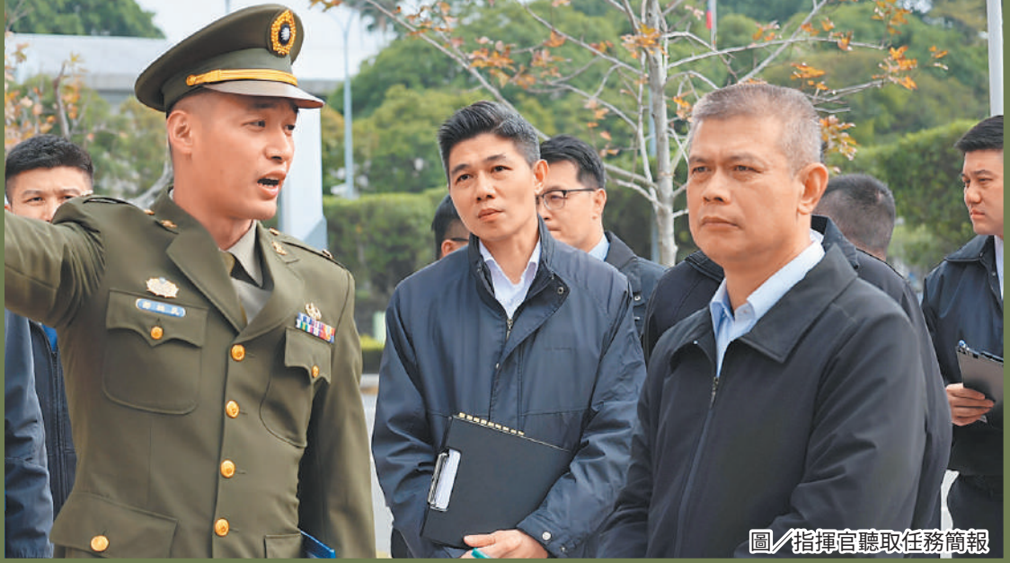
圖／指揮官聽取任務簡報

最後，鄭指揮官強調，近期天氣濕冷，幹部應確實檢查勤務人員保暖裝備，善盡官兵照護工作，主動協助解決問題，有效確保官兵執勤安全。