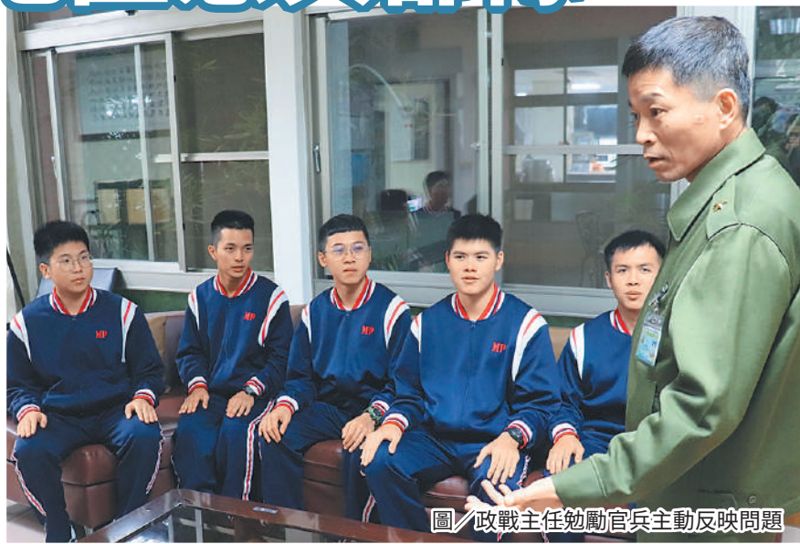
圖／政戰主任勉勵官兵主動反映問題

最後，唐主任強調，幹部領導統御管理需秉持說清楚、講明白原則，切勿意氣用事、心直口快，衍生其他爭議，並要求單位落實內部管理，運用集會時機查察人員手機有無留存公務資訊，並定期安全檢查，確保違禁品無攜入營內，有效消弭風險因子。