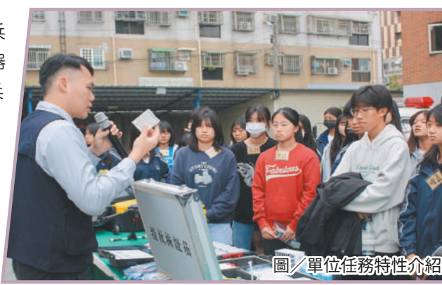
圖／單位任務特性介紹