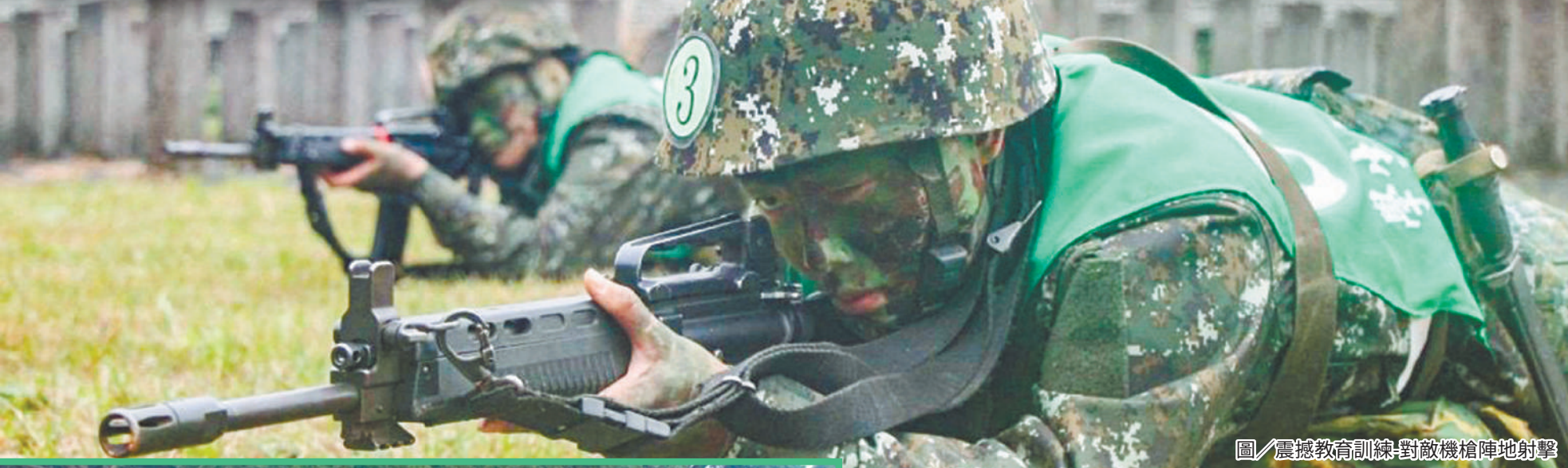
圖／震撼教育訓練-對敵機槍陣地射擊