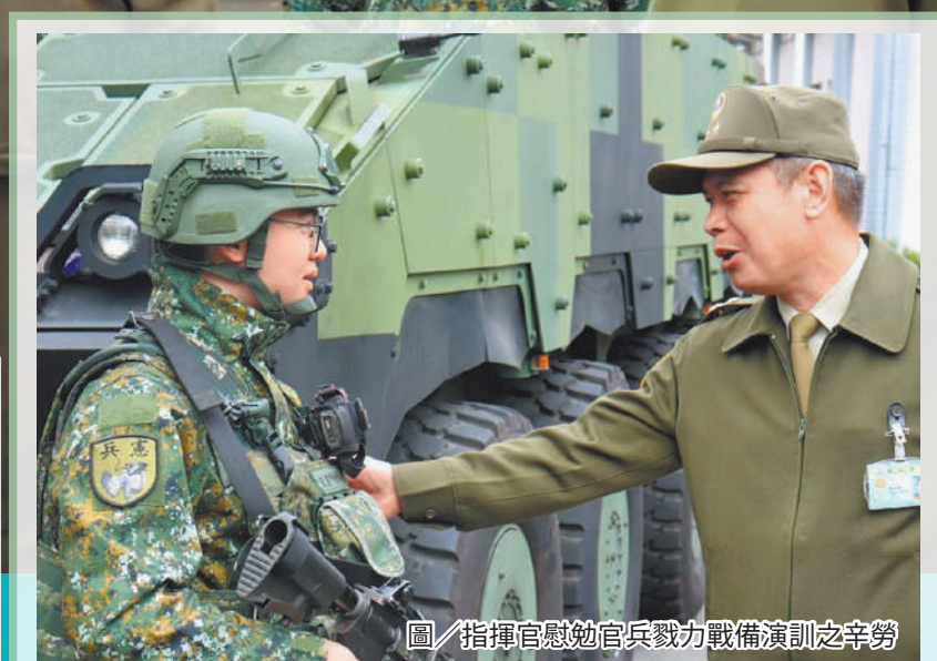
圖／指揮官慰勉官兵戮力戰備演訓之辛勞

指揮官鄭中將日前視導北部地區部隊，除慰勉官兵訓練辛勞，也要求幹部應落實人員編組及按表操課，結合現地偵查、戰術演練，使官兵熟稔作戰地境及任務，建構共同作戰圖像，強化區域聯防機制及危機應處效能。