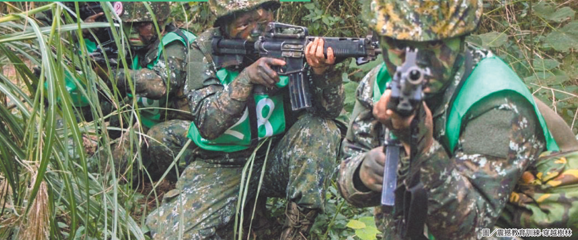
圖／震撼教育訓練-穿越樹林

造 T91 步槍機械訓練、10 公里戰術行軍、步槍實彈射擊訓練以及三天兩夜的宿營等，驗證入伍 8 週的精實訓練成效，發揚忠貞精神。