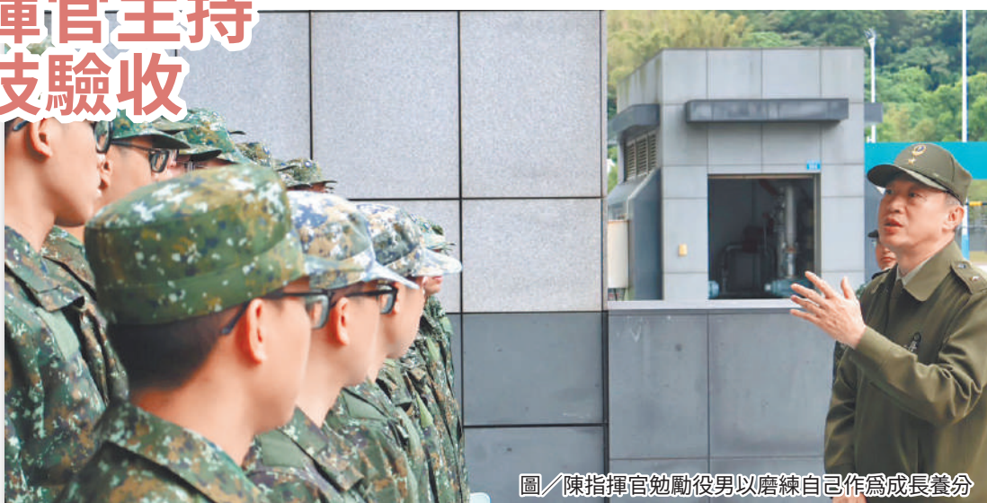
圖／陳指揮官勉勵役男以磨練自己作為成長養分

士氣高昂的戰技操演給予高度肯定，勉勵役男在服役期間，鍛造出堅忍不拔的梅荷精神，為國家安全貢獻力量。