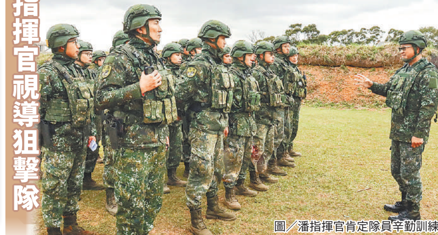
圖／潘指揮官肯定隊員辛勤訓練

潘指揮官表示，城鄉作戰為我憲兵部隊主要戰場，狙擊手能量極為關鍵；應熟悉並善用有利地形地勢，有效戰場經營，於關鍵時刻針對重要目標及資源有效狙擊，使敵不敢貿然進犯。並提醒狙擊手是重要關鍵戰力，應由資深人員帶領新手，有效累積經驗與精進技術，使單位狙擊手量能倍數增長，成為憲兵可恃戰力。