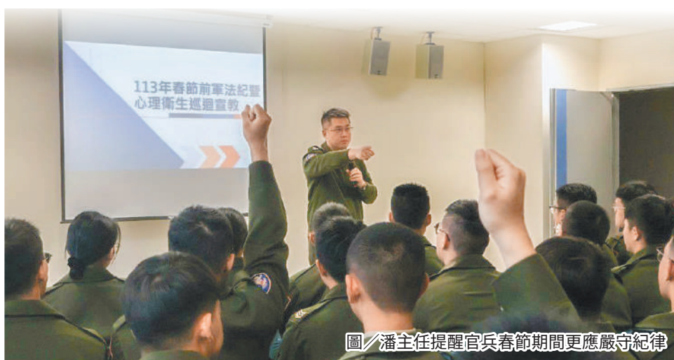
圖／潘主任提醒官兵春節期間更應嚴守紀律

自覺與榮譽心，在春節期間更應嚴守紀律，以維繫部隊榮耀，幹部應運用組織關懷連上弟兄，掌握危安風險，發揮敏銳觀察力及同理心，主動發覺危安異常徵候，並採採輔導管制措施，維持部隊戰鬥力與向心。