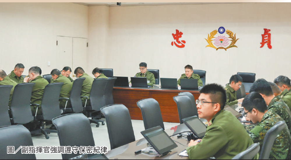
圖／副指揮官強調遵守保密紀律

于副指揮官提醒，「保密工作要從自己做起，每個人都是保密督導官。」保障工作除了宣導外，更要落實執行，從教育面、法規面、工作面著手，使官兵深刻了解「一語外洩，身敗名裂；一字外洩，全軍覆沒」的嚴重性。