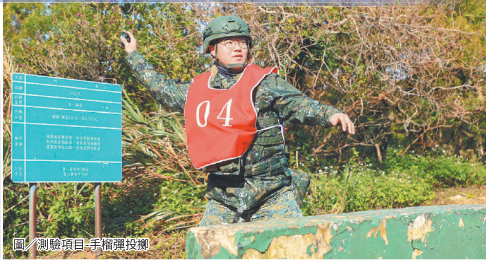
圖／測驗項目-手榴彈投擲