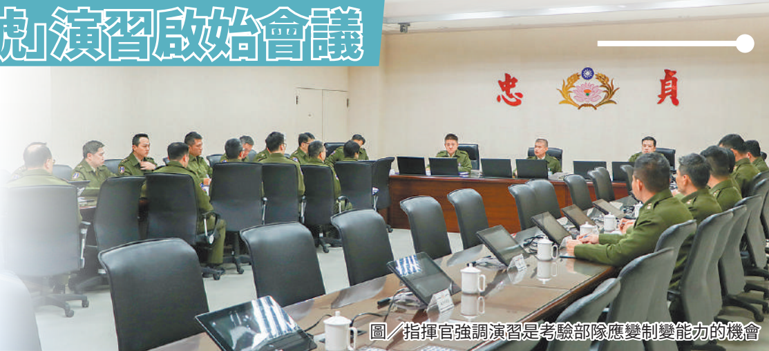
圖／指揮官強調演習是考驗部隊應變制變能力的機會

鄭指揮官提醒幹部應以「帶著敵情練兵」的角度思考及設計狀況、誘導官兵訓練，強化應變制變能力，並秉持「實兵、實地、實時、實裝」務實精神，妥適完成任務分工，並依各工作節點管制，落實人員訓練、裝備維保等整備工作，並實踐平日訓練與要求，確保部隊整體戰力發揮。