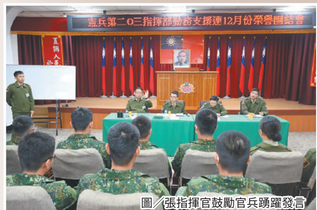
圖／張指揮官鼓勵官兵踴躍發言

張指揮官表示，藉貫徹「人事、賞罰、財務、意見」等4大公開，暢通單位溝通管道，期藉榮譽會凝聚單位和諧，並共同研討如何改善單位環境，使官兵團結一致，同心協力為單位奉獻，以營造優質工作環境。