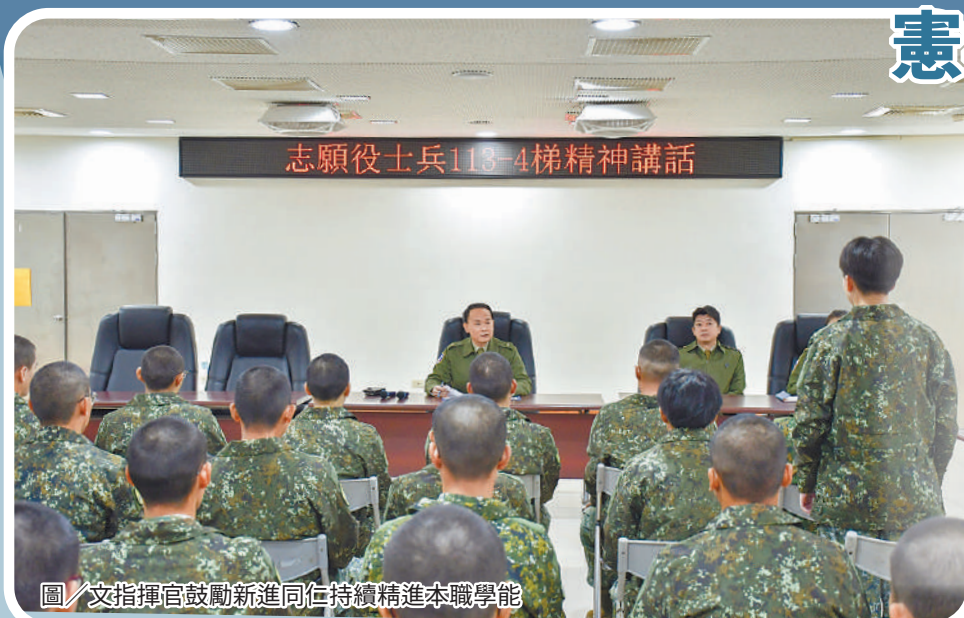
圖／文指揮官鼓勵新進同仁持續精進本職學能

最後，文指揮官期許新進同仁未來至各單位後，持續以認真的態度學習各項憲兵勤務，若遇勤務或生活上之問題，均要立即向建制幹部反映，並依層級尋求幹部協處；另鼓勵同仁充實本職學能，也可運用軍中資源公餘進修，提升個人競爭力。