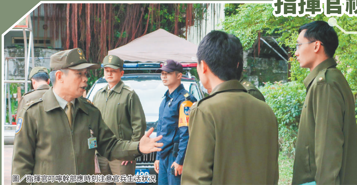
圖／指揮官叮嚀幹部應時刻注意官兵生活狀況

鄭指揮官提醒，單位應落實內部管理，善用手機偵測系統、門禁檢管及安全檢查等方式複式巡管，主動查察危安罅隙，防杜有心人士洩密，並對各項軍紀要求、性別分際持恆宣導，以防微杜漸之心，發掘違常因子，確保單位純淨。