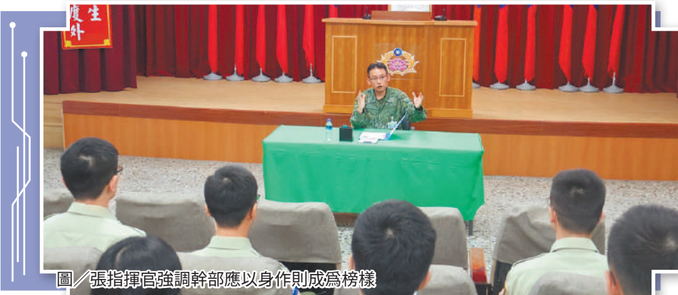
圖／張指揮官強調幹部應以身作則成為榜樣

最後，張指揮官以近期軍紀案件為例，提醒幹部應嚴格自律，成為官兵學習榜樣，並主動關懷所屬官兵，如發掘官兵任何疑難雜症，應適時介入協處並即時向上反映，與官兵鏈結革命情感。