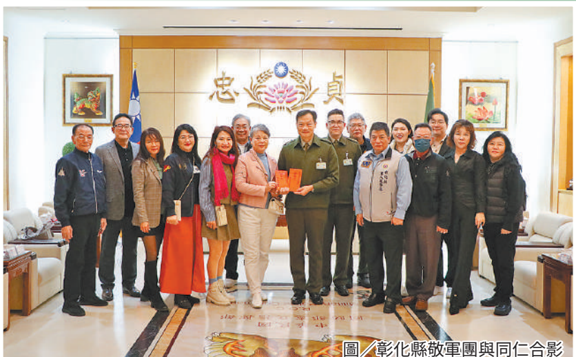
圖／彰化縣敬軍團與同仁合影

最後，陳董事長再次肯定所有官兵弟兄姐妹們秉持積極、努力之態度，持續為國家及社會貢獻心力，「訓練以安全第一，生活以積極為首要」，達到「軍愛民、民敬軍」之目的，讓國軍成為國家最穩定堅守的力量。