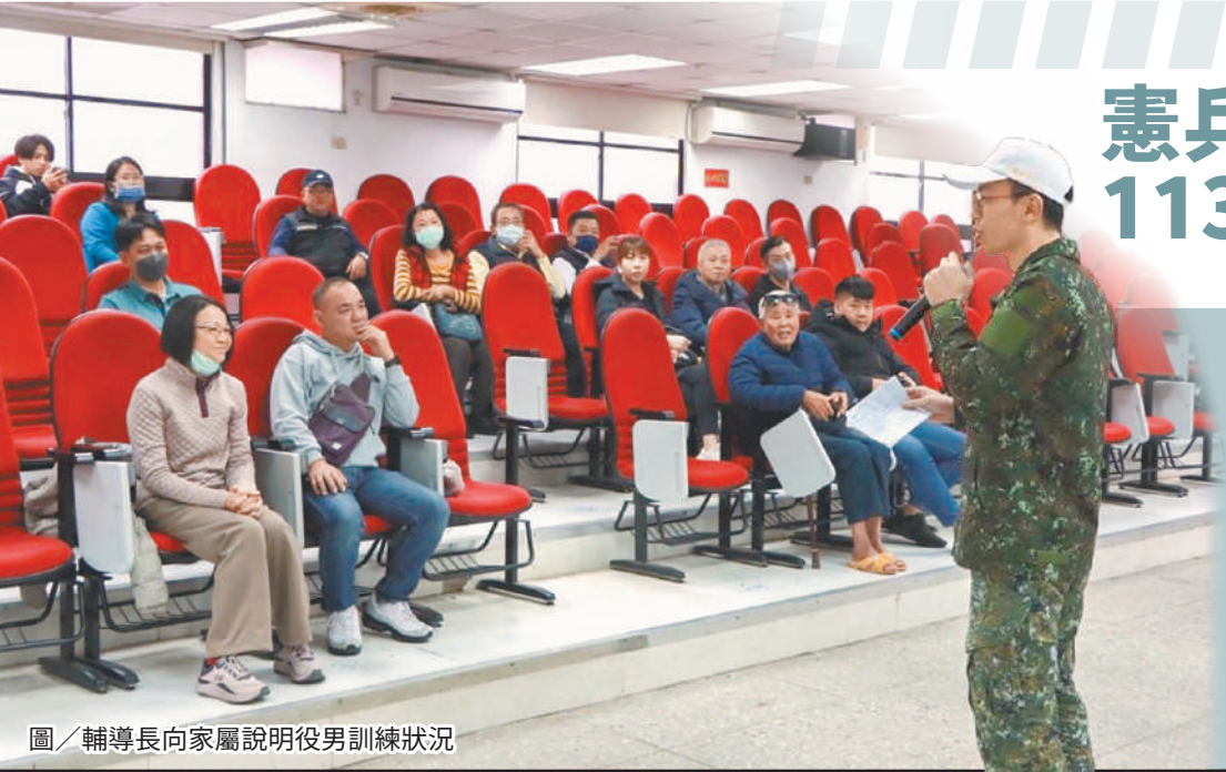
圖／輔導長向家屬說明役男訓練狀況

的家屬表達致意，並勉勵所有入伍生在4個月的受訓期間，能夠全程用心感受並享受其中，期許未來成為憲兵最重要的一員；另提醒家長共同注意其子女休假期間的營外行為，恪遵軍紀規定，共同維護憲兵榮譽，建立部隊與家屬的互信及共識。