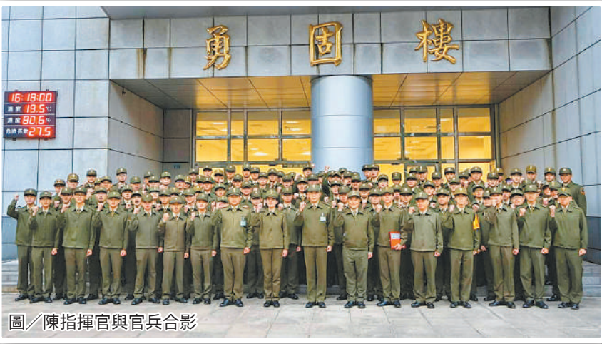
圖／陳指揮官與官兵合影

陳指揮官表示，團體合作是成功的關鍵，第一連能有優異的成績，除了官兵本身的努力外，也有賴於其他連隊弟兄的理解與包容，讓第一連在鑑測期間可以無後顧之憂，展現不凡的成果，這是全營團結一心的成果。