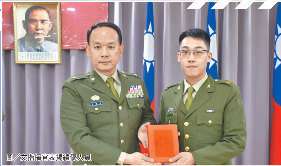
圖／文指揮官表揚績優人員

文指揮官表示，各級幹部應落實任務、訓練及工作推展，並以優異領導統御及綿密忠貞氣節教育，建立同仁正確觀念，充分展現身為三軍表率的精神與士氣，嚴守紀律、恪盡職責，以建構紀律嚴整、戰力堅實的憲兵部隊。