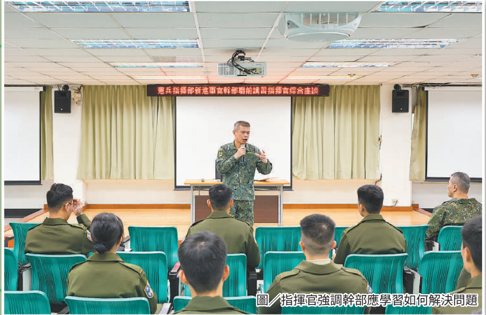
圖／指揮官強調幹部應學習如何解決問題

鄭指揮官強調，軍旅生涯初期難免遭遇挫折，但新進幹部仍須勇於承擔責任，克服各項困難，協助官兵解決問題，從部隊實務工作中學習，力行身教及言教，發揮領導統御才能，成為部隊堅實戰力。