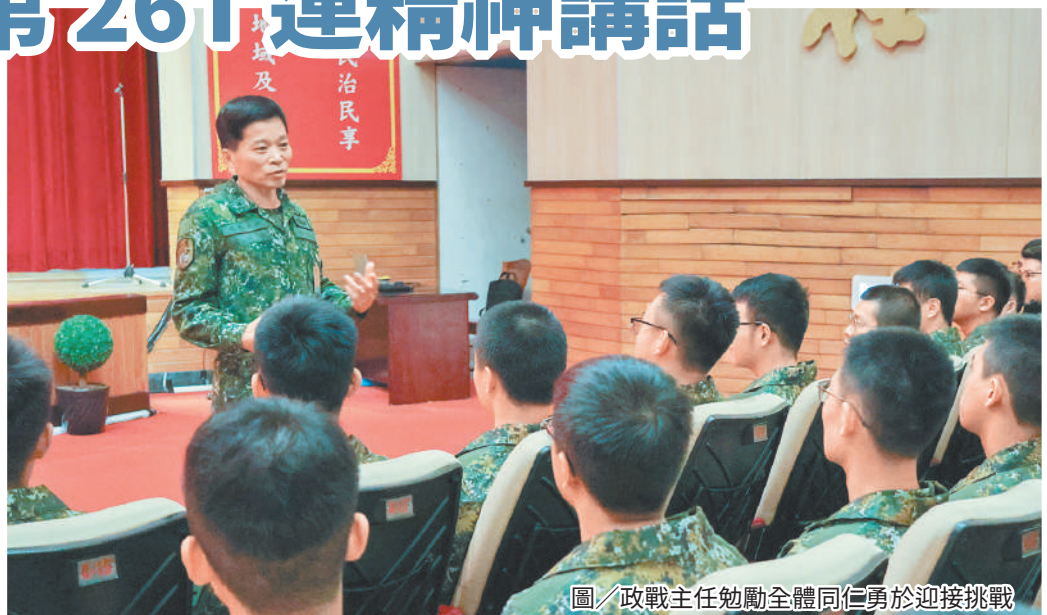
圖／政戰主任勉勵全體同仁勇於迎接挑戰

政戰主任提醒，不論是訓練或日常生活中，同袍之間應相互幫忙，並由資深幹部從旁協助，以建制體系進行人員輔考，達成「人安、物安、零危安」之目標，共同完成任務。最後，政戰主任叮嚀官兵務必恪遵法規及各項軍紀要求，貫徹「重榮譽、守紀律」精神，為單位及憲兵爭取最高榮譽。