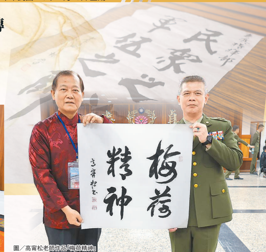
圖/高甯松老師作品「梅荷精神」