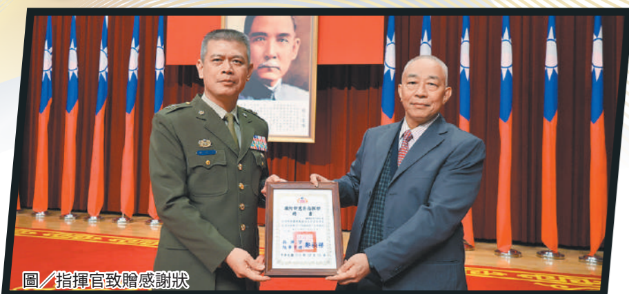
圖/指揮官致贈感謝狀