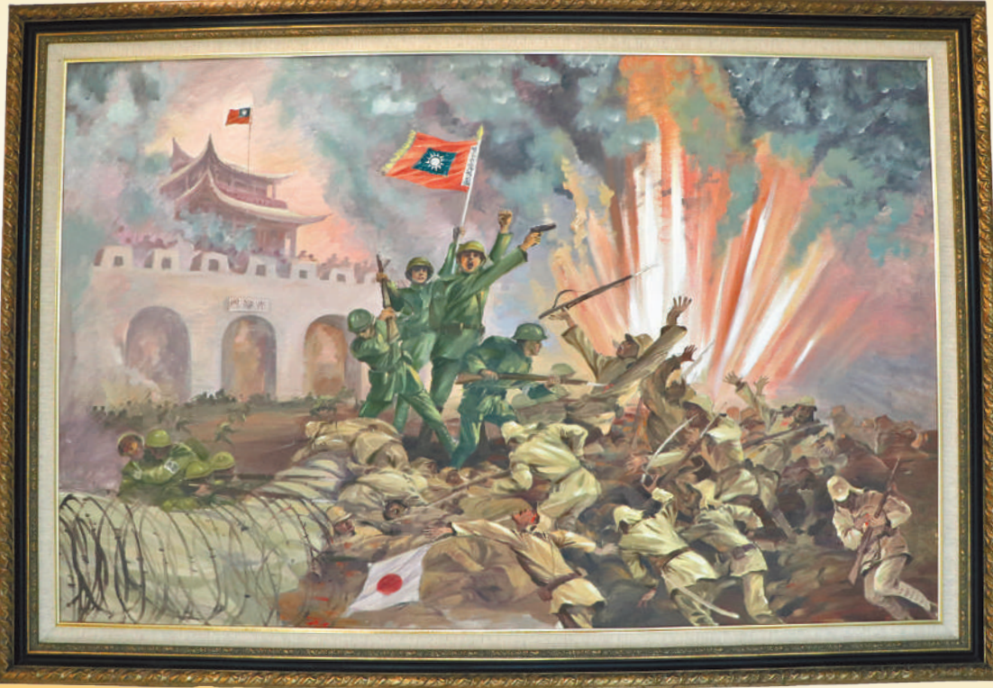
▲圖／「南京保衛戰」