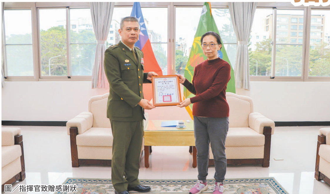
圖／指揮官致贈感謝狀

最後，鄭指揮官特別叮囑退伍人員莫忘對國家的責任，切記對岸仍持續運用各種方式，刺探國家機密與國防事務，需時刻保持警覺，防範敵諜滲透利用，以確保國家機密安全。