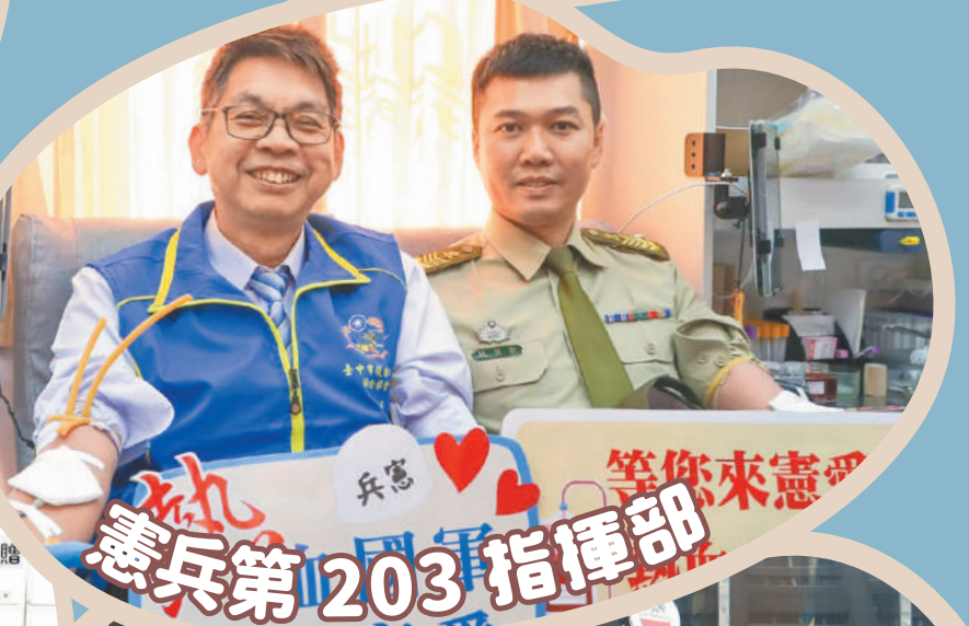
憲兵第 203 指揮部