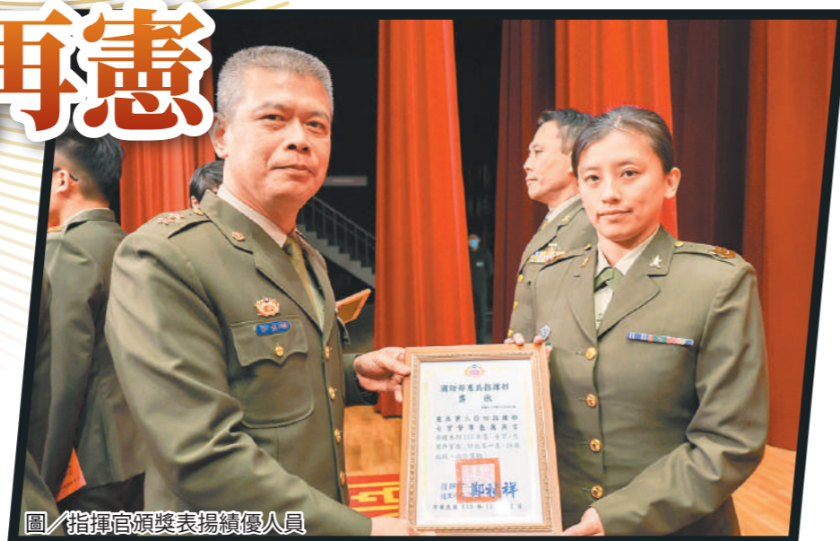
圖/指揮官頒獎表揚績優人員