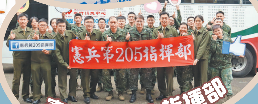
憲兵第 205 指揮部