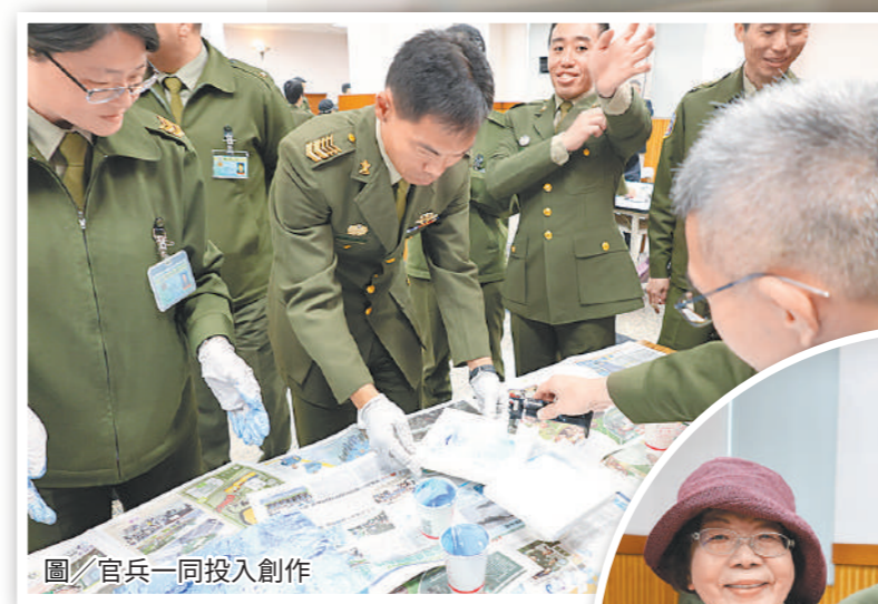
圖/官兵一同投入創作