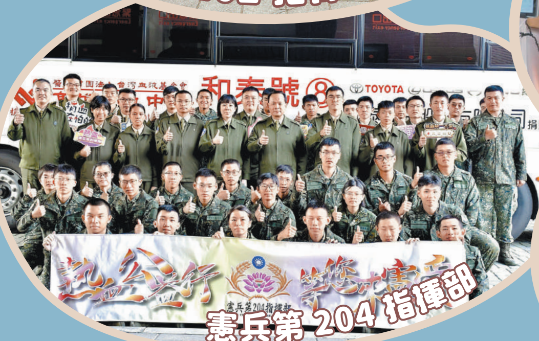
憲兵第 204 指揮部