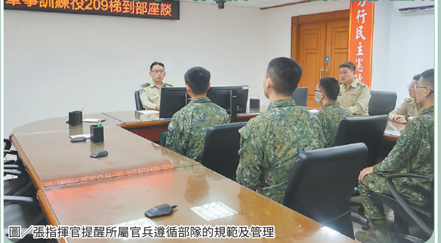
圖／張指揮官提醒所屬官兵遵循部隊的規範及管理