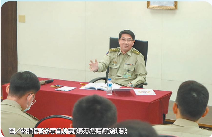
圖／李指揮官分享自身經驗鼓勵學員勇於挑戰

張指揮官鼓勵有志青年在營轉服，詳細說明投身軍旅可運用的各項福利資源，進而擁有穩定且有品質的生活。最後提醒無論在營訓練還是休假期間，都應遵循部隊的規範與管理，只有時刻恪遵各項軍紀營規，方能彰顯憲兵的優良紀律。