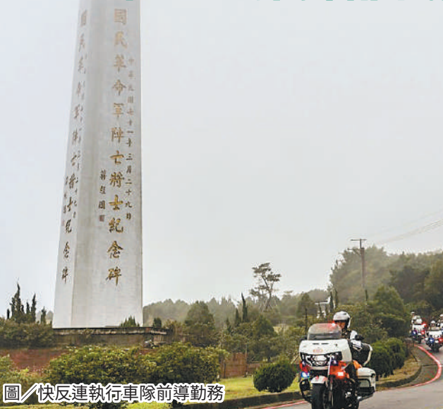
圖／快反連執行車隊前導勤務