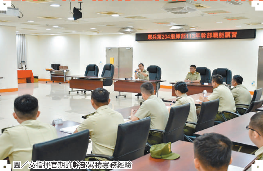
圖／文指揮官期許幹部累積實務經驗