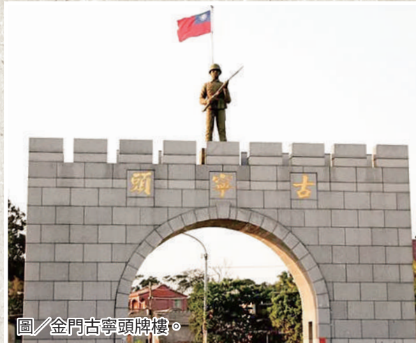
圖/金門古寧頭牌樓。