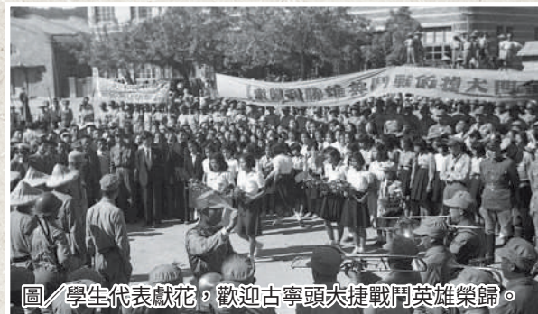
圖/學生代表獻花，歡迎古寧頭大捷戰鬥英雄榮歸。

靜靜坐落於太武山西麓谷地中，鍾靈毓秀，氣聚風藏，共祀奉參與古寧頭、南日島、東山島、大二膽、八二三等戰役中的殉國將士們。民國 41 年，胡璉將軍感念烈士託命斯土，古寧頭戰役陣亡官兵忠骨無依，因此著手肇建公墓，為為國捐軀的袍澤建立安息之地，依稀可憶戰役之慘烈。回顧歷史，民國 38 年 10 月 24 日晚間，共軍發動突襲，自大嶼、小嶼、蓮河及廈門方面，傾萬餘兵力渡海進犯，向金門北海岸壟口至