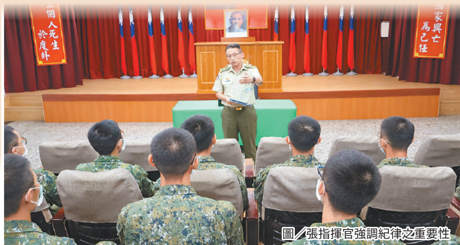
圖／張指揮官強調紀律之重要性

張指揮官表示，幹部應時刻恪遵三大紀律「生活紀律、工作紀律、休假紀律」，共同維護憲兵榮譽；並提醒接訓幹部務必綿密家屬聯繫，發揮組織功能與家屬共管共教，避免肇生人員心緒失衡問題，確維部隊安全無罅隙。