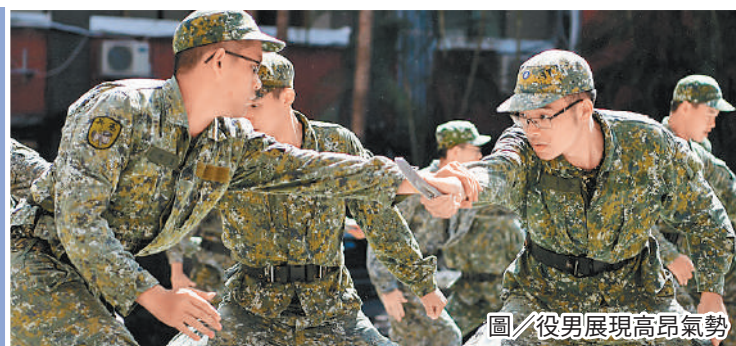
圖／役男展現高昂氣勢

水平，強化實戰中的生存和作戰能力。最後，提醒訓員未來仍應保持學習熱忱，並以身為憲兵為榮。