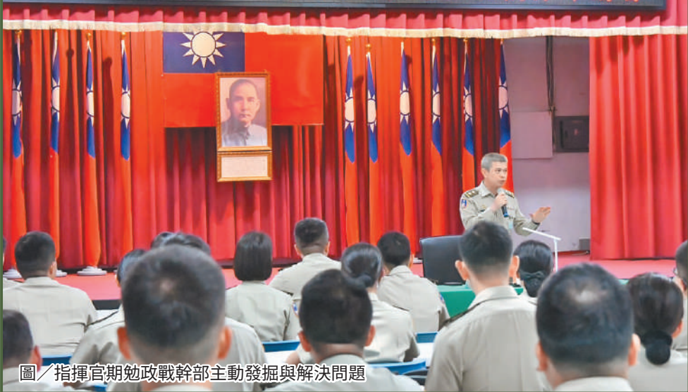
圖／指揮官期勉政戰幹部主動發掘與解決問題