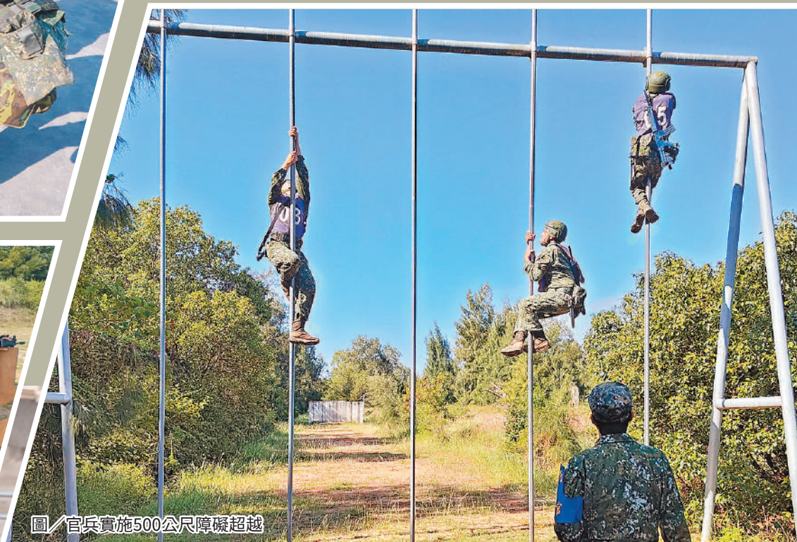
圖／官兵實施500公尺障礙超越