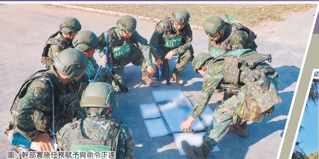
圖／幹部實施任務賦予與命令下達