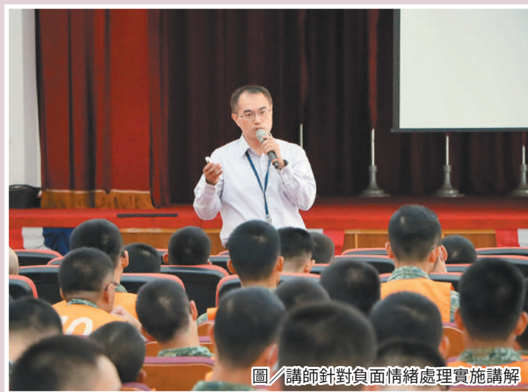
圖／講師針對負面情緒處理實施講解

宣教提醒官兵適時檢視自我內心深處，瞭解當前自身身心狀況，明確認知「異常行為就是求助的訊號」，並持續倡導珍愛生命守門人「一問、二應、三轉介」的概念，發揮團結互助精神，共同營造愉悅的部隊環境。