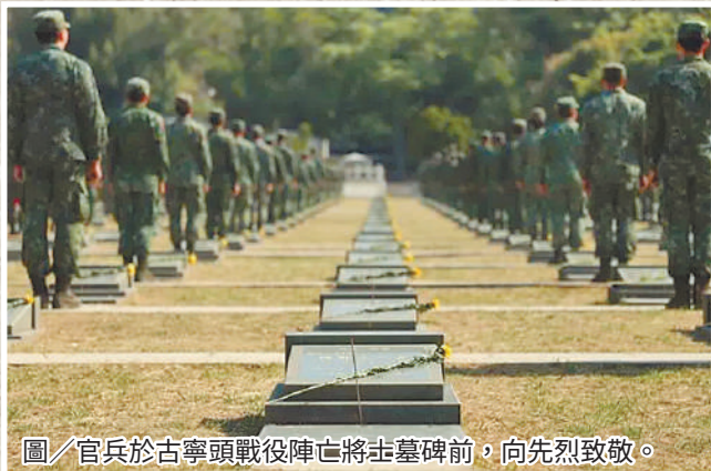
圖/官兵於古寧頭戰役陣亡將士墓碑前，向先烈致敬。