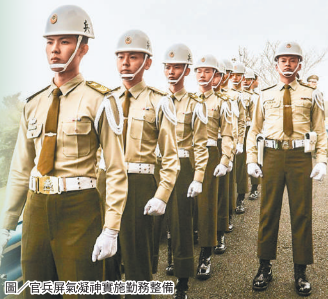
圖／官兵屏氣凝神實施勤務整備

此次除擔任軍禮勤務除了慎終追思外，更因而喚起記憶中那股感懷與感動，陳上將是我們的楷模更是國家的典範，跟隨先烈的腳步，我們要學習付諸實行，進而達成最終目標，戮力完成戰訓本務。