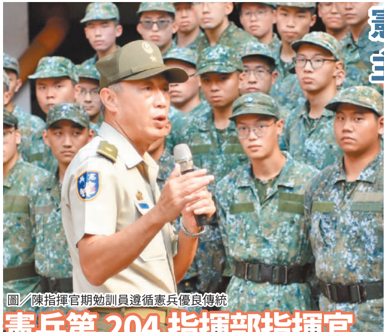
圖／陳指揮官期勉訓員遵循憲兵優良傳統

水平，強化實戰中的生存和作戰能力。最後，提醒訓員未來仍應保持學習熱忱，並以身為憲兵為榮。