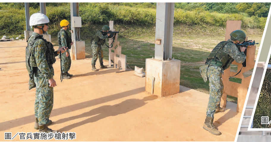
圖／官兵實施步槍射擊