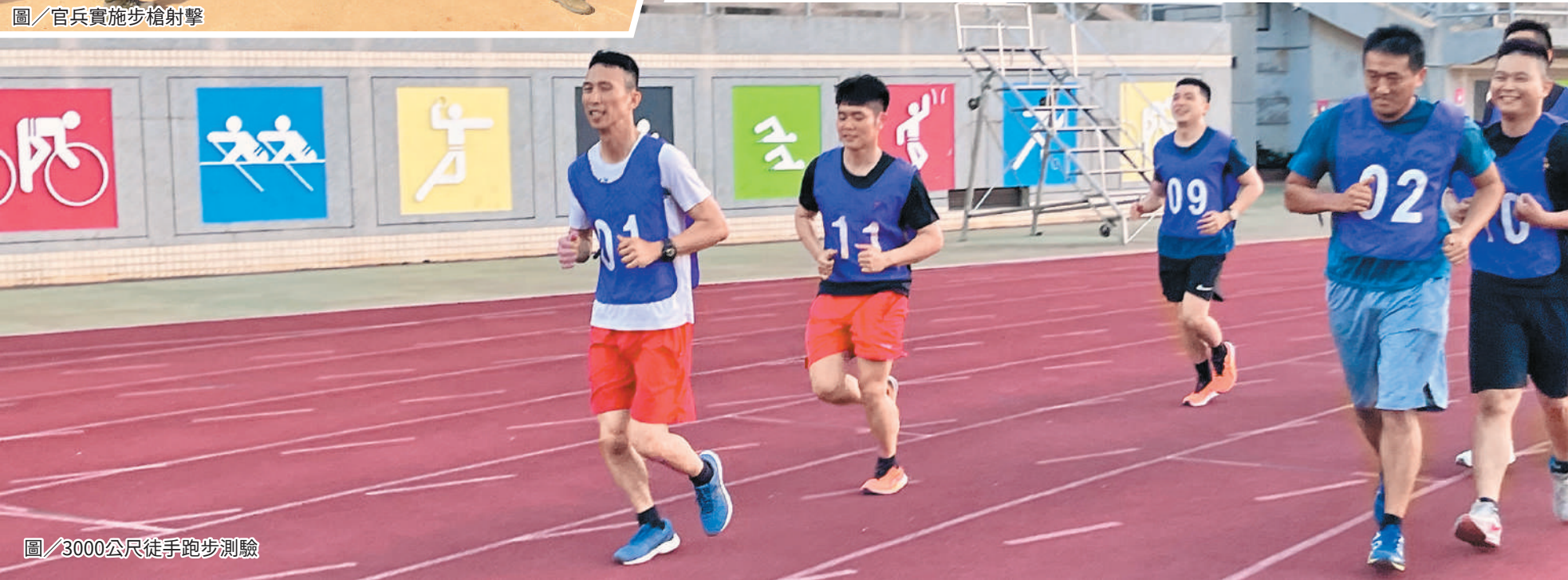
圖／3000公尺徒手跑步測驗