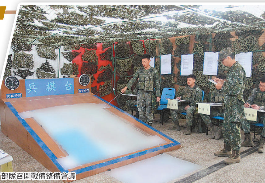
圖／部隊召開戰備整備會議