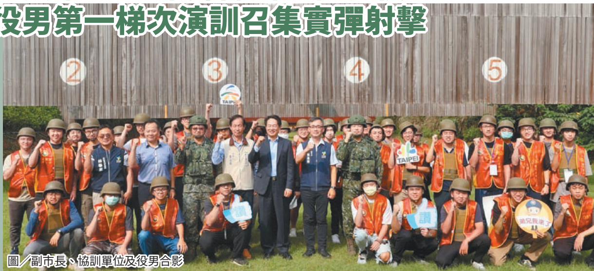
圖／副市長、協訓單位及役男合影