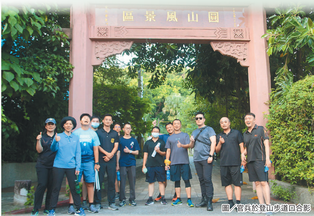
圖／官兵於登山步道口合影