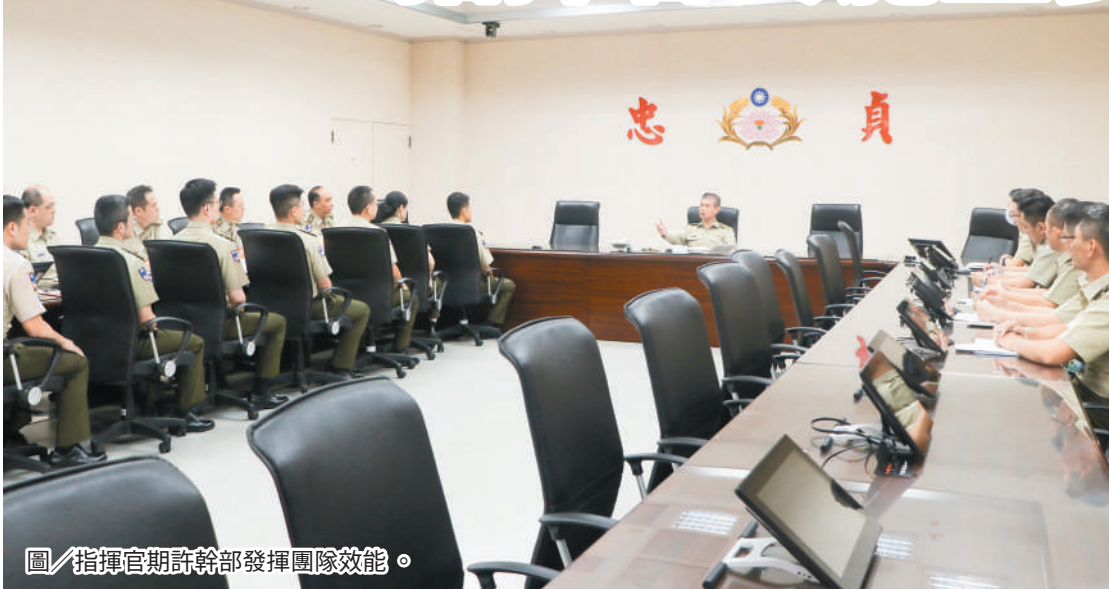
圖／指揮官期許幹部發揮團隊效能。