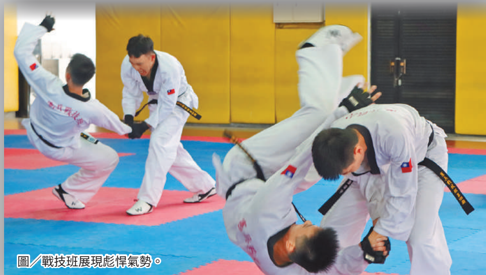
圖／戰技班展現彪悍氣勢。

每個學員自我期許，結訓後作為一名文武兼備的體能戰技師資，將自身所學之精髓帶回單位，相信唯有從嚴從難的訓練，方能塑造國軍精實之戰力。