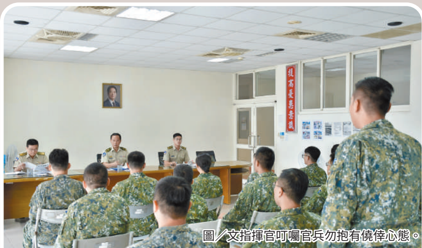
圖／文指揮官叮囑官兵勿抱有僥倖心態。