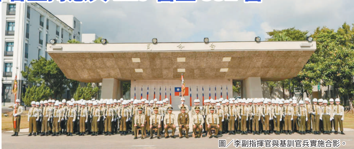
圖／李副指揮官與基訓官兵實施合影。

李副指揮官表示，基地是單位平時駐地訓練成果的驗收，每位官兵應秉「處處皆戰場，時時都訓練」之精神，全心投入其中，期勉參訓官兵都能團結一致、戮力訓練，共同為個人及單位爭取佳績。