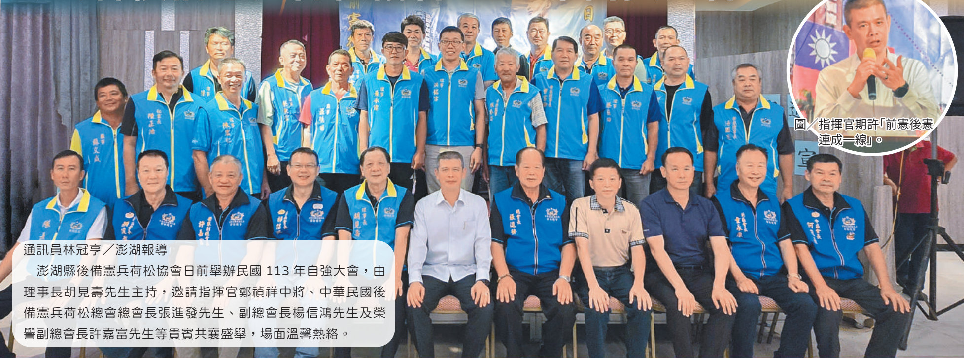
圖／指揮官期許「前憲後憲連成一線」。