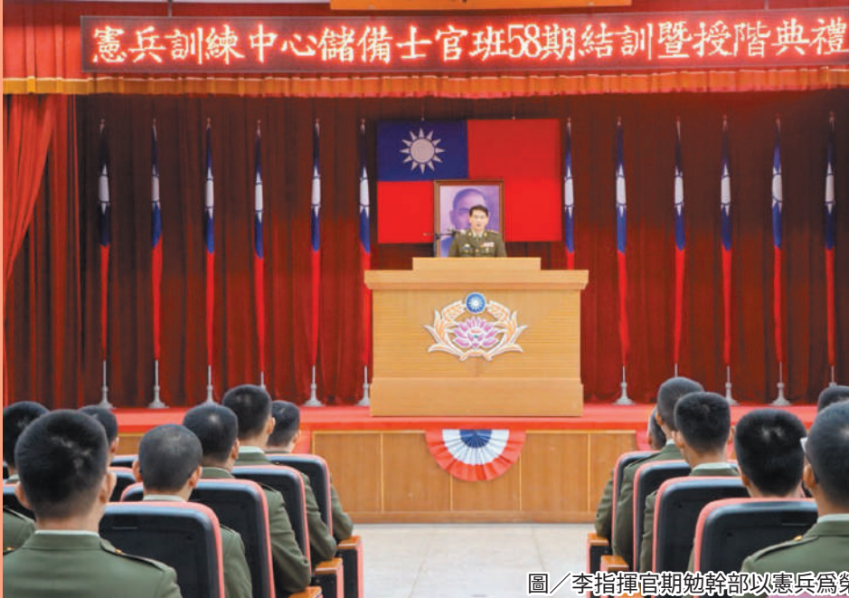
圖／李指揮官期勉幹部以憲兵為榮。