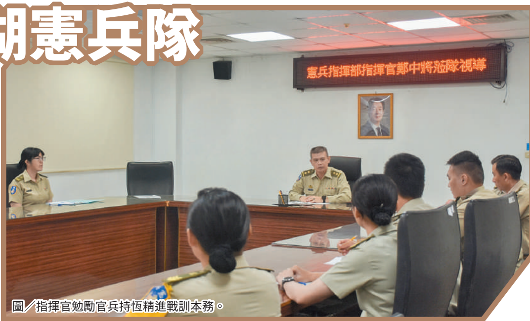
圖／指揮官勉勵官兵持恆精進戰訓本務。

最後，鄭指揮官勉勵單位本次國防部戰技抽測成績優異，官兵訓練沒有奇蹟只有累積，找到適切方法持之以恆才能有成效。