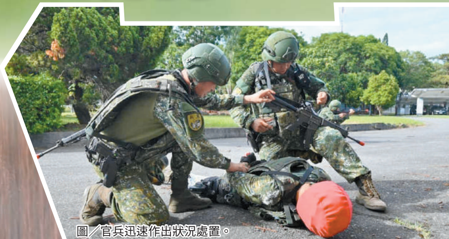
圖／官兵迅速作出狀況處置。