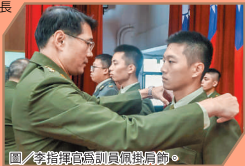
圖／李指揮官為訓員佩掛肩飾。

李指揮官恭喜學員們通過長達 8 週的訓練及考驗，提醒階級是責任與使命的賦予。期勉所屬未來軍旅生涯要秉持不怕苦、不怕難的精神，樹立良好的典範，發揚忠貞優良軍風，迎接未來各項任務及挑戰。