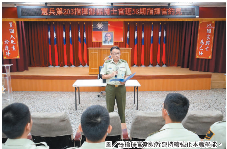
圖／張指揮官期勉幹部持續強化本職學能。

張指揮官表示，結訓人員均有肩膀上被賦予階級的資格，肩上階級更是象徵肩負責任的開始，期許同仁不斷持續精進，提升專業本職學能，成為單位不可或缺的戰力。