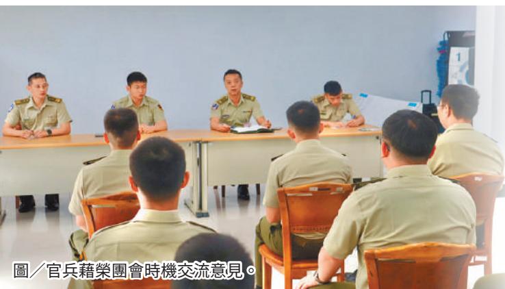
圖／官兵藉榮譽會時機交流意見。