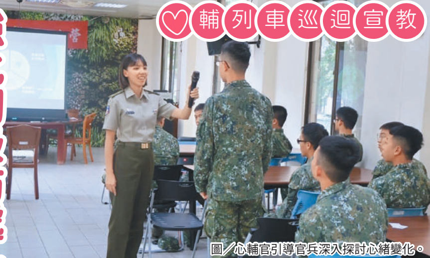
圖／心輔官引導官兵深入探討心緒變化。