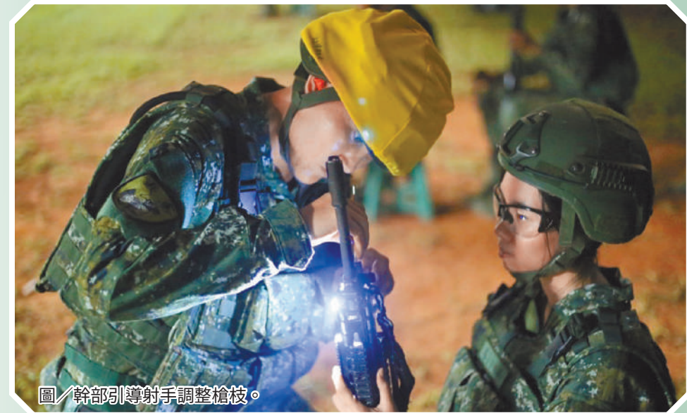
圖／幹部引導射手調整槍枝。