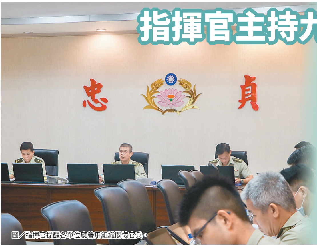
圖／指揮官提醒各單位應善用組織關懷官兵。