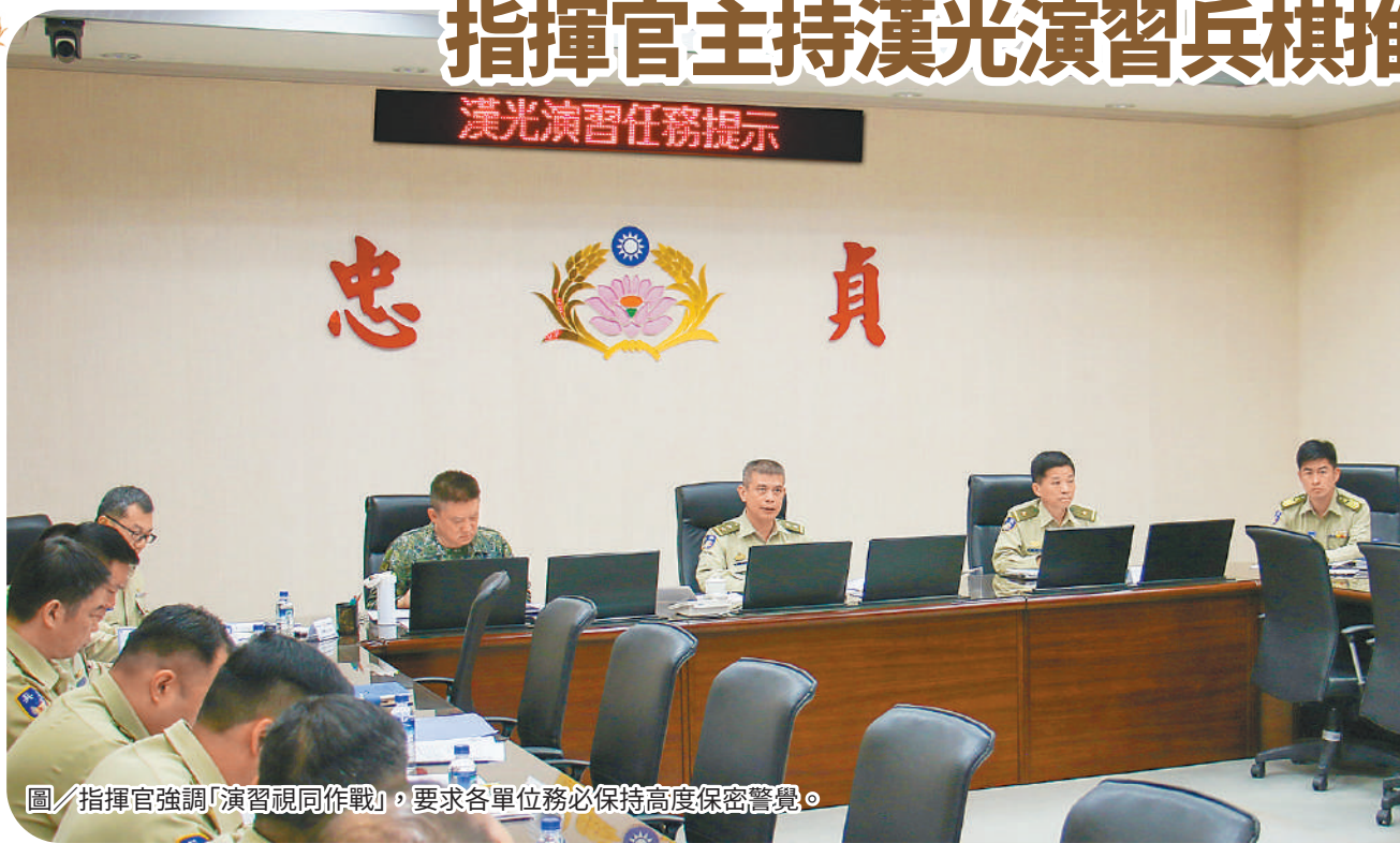
圖／指揮官強調「演習視同作戰」，要求各單位務必保持高度保密警覺。