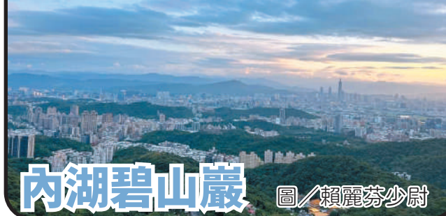
內湖碧山巖

內湖碧山巖是全臺灣最大聖王公廟，更是臺北知名景點，站在觀景平台上，風景十分遼闊，可眺望臺北盆地，101大樓、圓山飯店及松山機場、南港、大臺北東區萬家燈火及川流不息之車陣，美景盡收眼底。