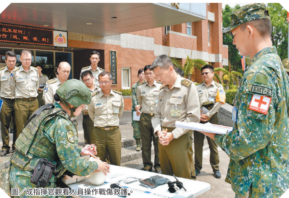
圖／成指揮官觀看人員操作戰傷救護。

此外，潘指揮官叮嚀，幹部須做好官兵身體照護及心緒狀況掌握，落實風險管控作為，並運用建制體系，關注官兵訓練狀況，規劃適切訓練方法，以提升部隊訓練成效，確維部隊戰力。