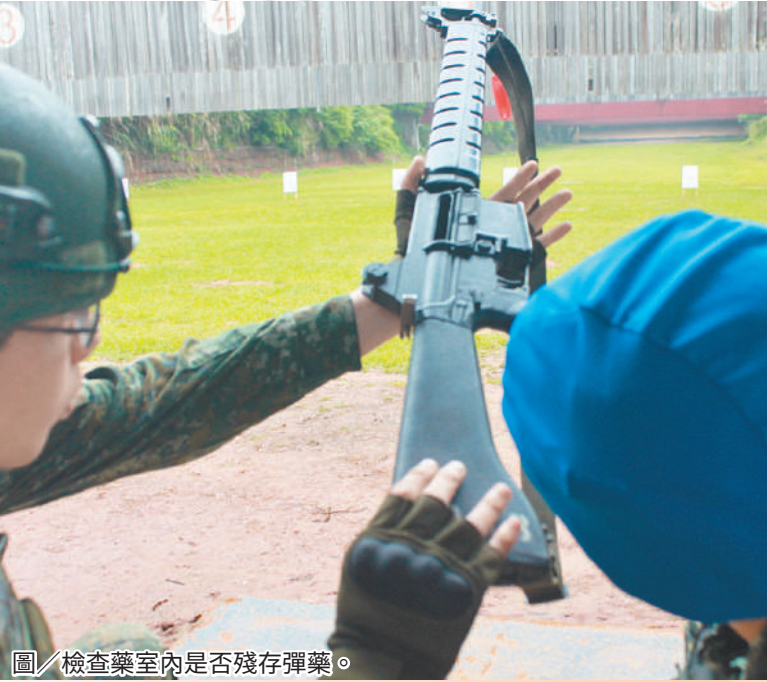
圖／檢查藥室內是否殘存彈藥。

射擊時，全體射手確遵「程序、步驟、要領」，逐一完成射擊訓練，並透由教官引導武器操作及指導射擊技巧，使射手熟悉個人配賦武器，確達「為用而訓，訓後能戰」的目標。