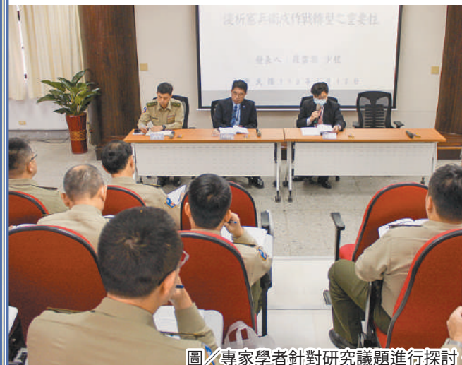
圖／專家學者針對研究議題進行探討。