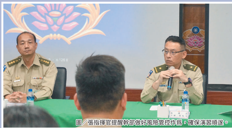
圖／張指揮官提醒幹部做好風險管控作為，確保演習順遂。

所屬官兵知悉演習期間的相關注意事項，以利幹部做好風險管控作為，確保演習順遂。此外，張指揮官叮嚀，相關科室業管參謀須落實一級督導一級制度，提醒下級單位建立正確觀念，以鞏固部隊安全。