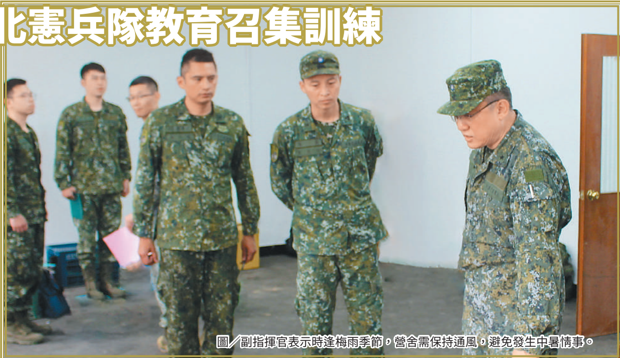
圖／副指揮官表示時逢梅雨季節，營舍需保持通風，避免發生中暑情事。

最後，副指揮官提醒所有車輛機動需注意行車安全、保持安全車距及駕駛精神狀態，以免肇生危安事件。