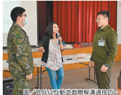
圖／官兵以互動遊戲瞭解溝通技巧。