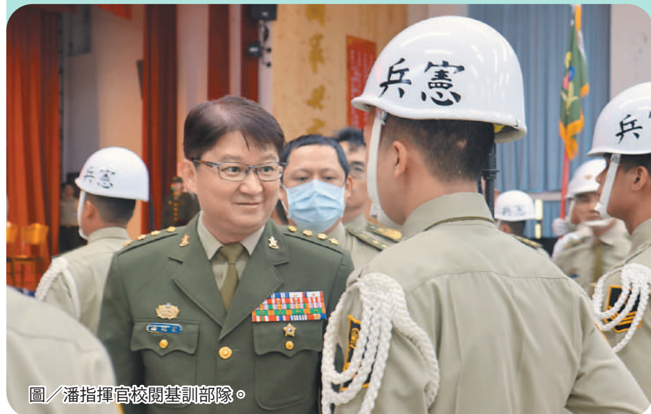
圖／潘指揮官校閱基訓部隊。

成指揮官表示，每位官兵都應瞭解戰傷急救並非單純進行傷患處置，而是在考量當前敵情判斷下，以任務為目的、醫療為手段進行急救，確保戰力得以延續。