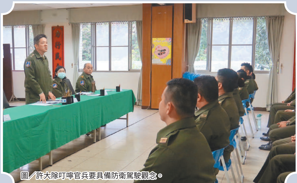
圖／許大隊叮嚀官兵要具備防衛駕駛觀念。

此外，許大隊長提醒幹部對於新進人員，應主動關懷協助，切忌冷漠忽視、言語暴力情事發生，同時鼓勵官兵多讀書，加強本職學能，爭取把握受訓機會，妥善安排生涯規劃。