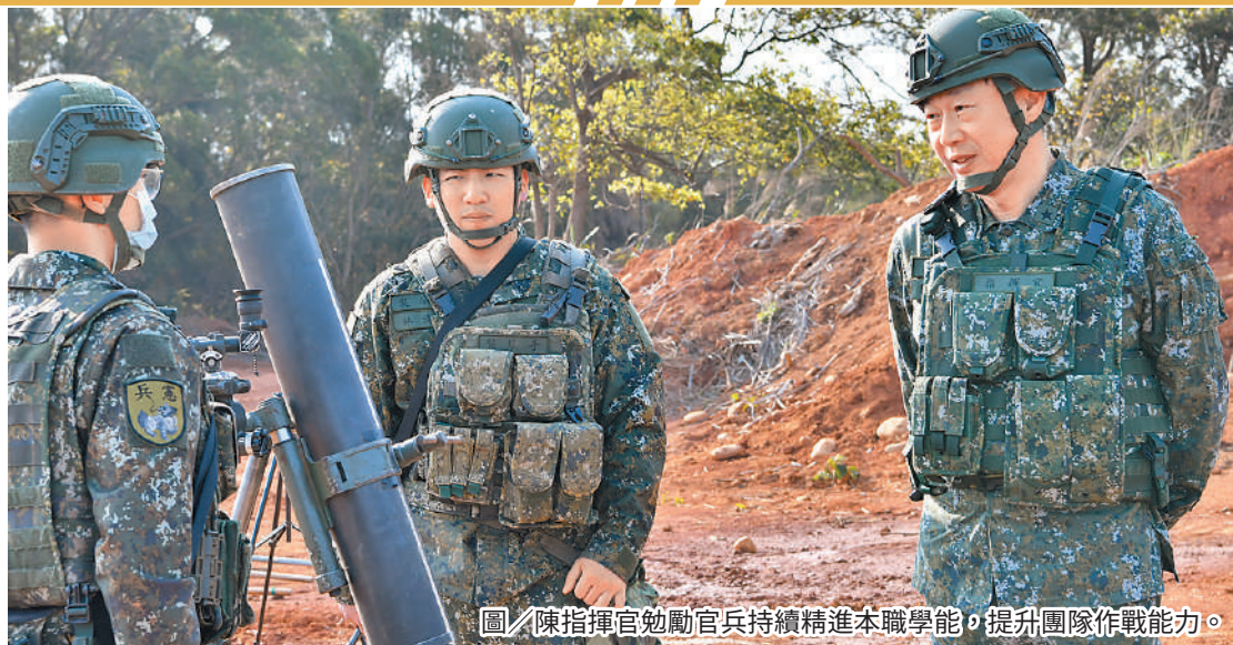
圖／陳指揮官勉勵官兵持續精進本職學能，提升團隊作戰能力。

憲兵第 202 指揮部指揮官陳少將 13 日視導第 228 營基訓部隊實施射擊訓練，陳指揮官表示，迫擊砲屬於曲射武器，易受氣候及風向影響，觀測士、水平手及計算手的任務格外重要，對於觀測與水平計算的專業給予肯定。最後，陳指揮官期許全體官兵，藉由每一次的訓練，提升團體作戰能力，凝聚團隊向心，才能發揚衛戍作戰火力。