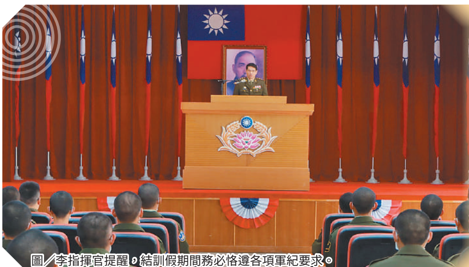
圖／李指揮官提醒，結訓假期間務必恪遵各項軍紀要求。