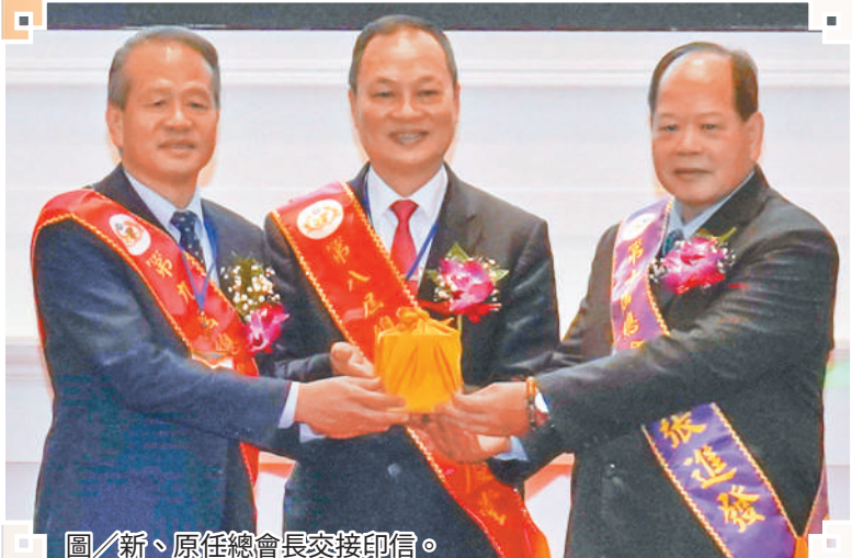
圖／新、原任總會長交接印信。