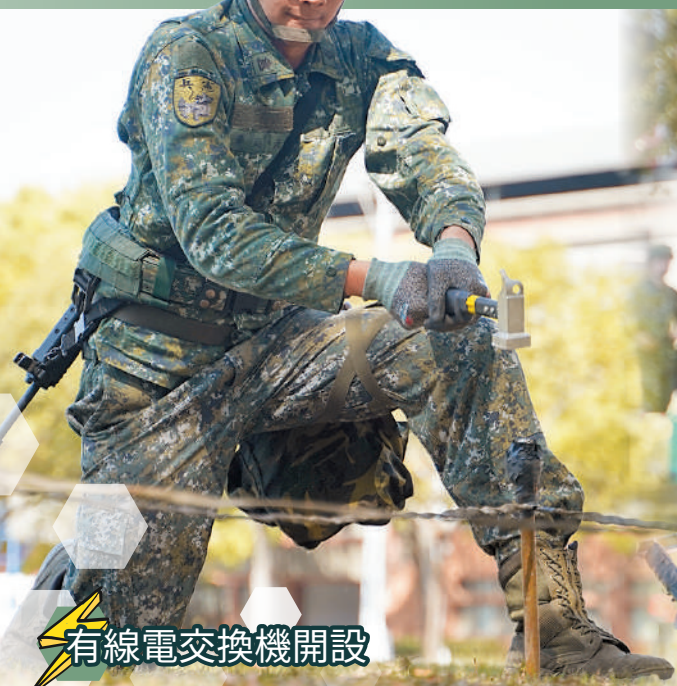
有線電交換機開設