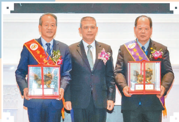
▲指揮官與新、原任總會長合影。 ▶指揮官致贈原任總會長本部精心製作紀念禮品。 ▼新、原任總會長與家人合影。