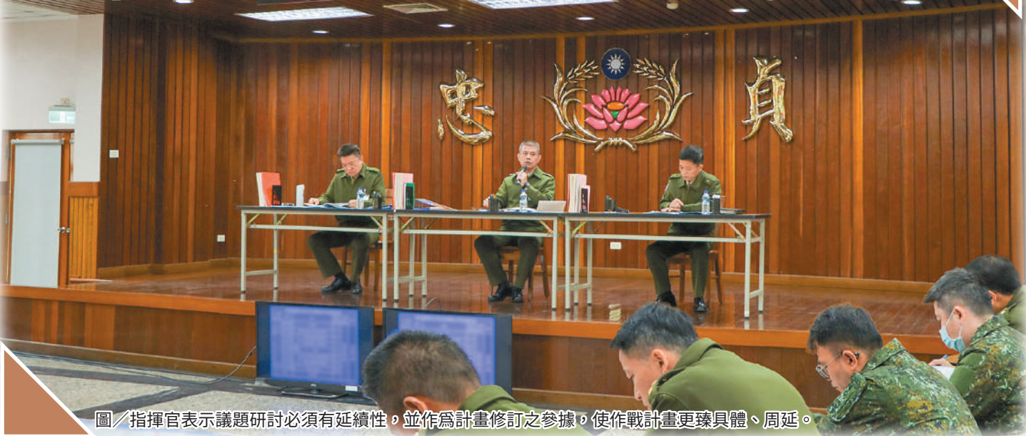
圖／指揮官表示議題研討必須有延續性，並作為計畫修訂之參據，使作戰計畫更臻具體、周延。