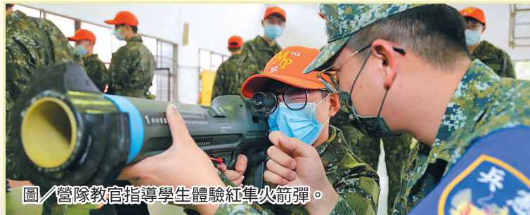
圖／營隊教官指導學生體驗紅隼火箭彈。

此外，政戰主任亦鼓勵有志學員獻身軍旅、挑戰自我，在學期間藉由多元的軍事體驗課程，增進自身對國防事務的瞭解，進而立定從軍志向，為個人生命歷程寫下難忘回憶，強調國家安全有賴眾志成城，希冀每位青年建立全民國防共識，共同支持國防。