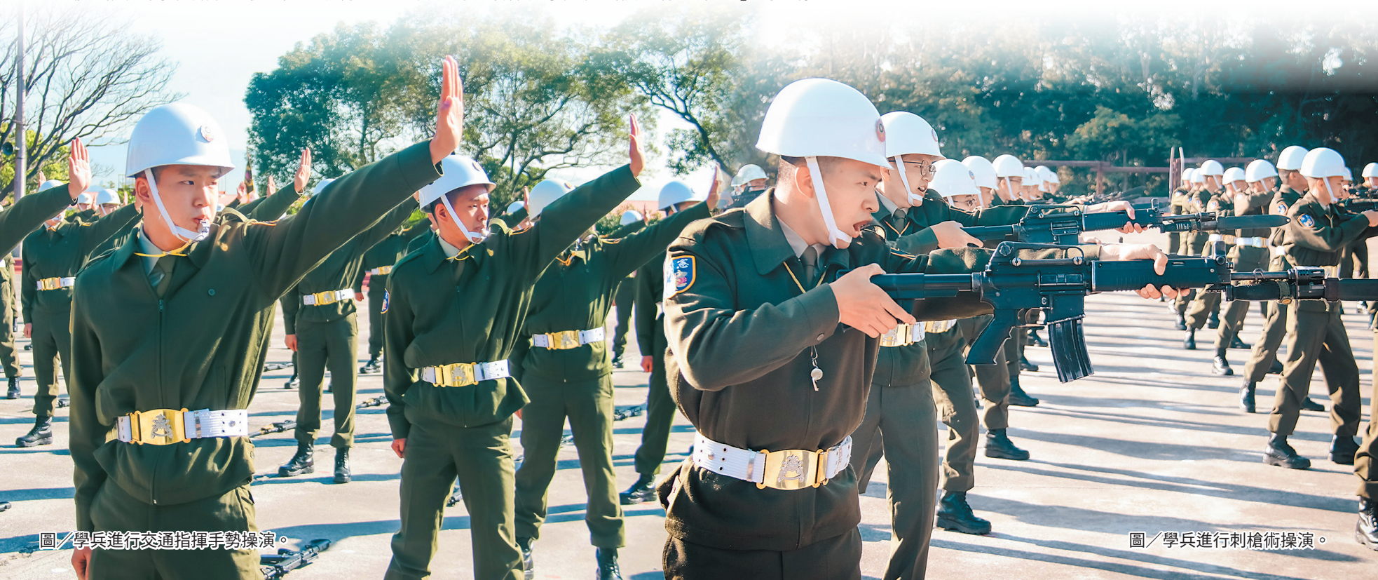
圖／學兵進行交通指揮手勢操演。

分發至憲兵各單位，正式成為憲兵的一員，將繼承憲兵「梅荷志節」，秉持著堅忍不拔、貫徹始終的意志力，迎接各項挑戰，同時以高道德標準約束自我，嚴守紀律，培養高尚品德，並以憲兵為榮，朝「素質高、戰力強、守紀律、有信心」的目標邁進。