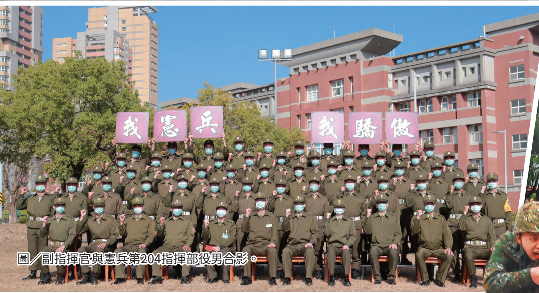
圖／副指揮官與憲兵第204指揮部役男合影。