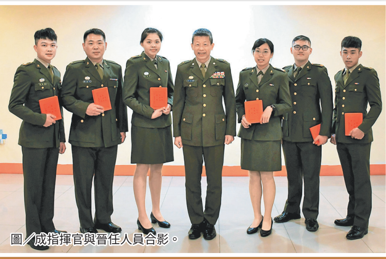
圖／成指揮官與晉任人員合影。