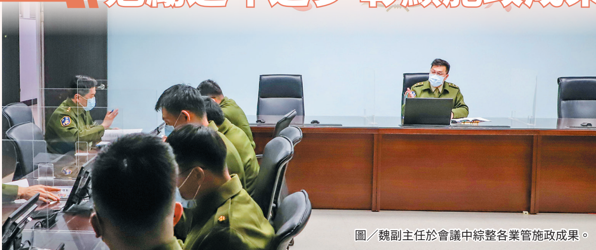
圖／魏副主任於會議中綜整各業管施政成果。

督察室副主任表示，憲兵具有協力治安維護、拱衛中樞及應援反恐行動等多元任務職責，需透過各部門之協力合作，逐步務實地達成年度施政目標，並藉成果檢視，研討施政效益及未來精進方向，期能有效運用國防資源，發揮施政最大效益。