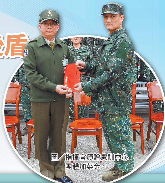
圖／指揮官頒贈憲訓中心團體加菜金。

此外，指揮官亦指導單位持續強化忠貞氣節教育，並由軍事幹部負責指導、講授，平時可運用各式集會時機介紹憲兵由來、憲兵先烈及光榮戰史等內容，進而發揮最大教育成效，並期許所屬在這四個月的軍事訓練中有所成長，返回社會後，繼續做國家社稷堅實後盾。