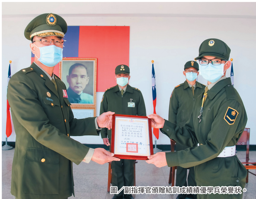
圖／副指揮官頒贈結訓成績績優學兵榮譽狀。

副指揮官夏少將日前主持志願役士兵 111—5 梯成果驗收暨結訓典禮，全體學兵精神抖擻、整齊劃一，展現嚴謹訓練成果，副指揮官指出奪刀、奪槍、擒拿術、近戰格鬥及交通指揮手勢為憲兵基礎戰技，要求單位完成新兵結訓測驗後，應註明於訓練績效卡內，以利管制訓練成效，提醒幹部針對因喪假、病痛等事故未參與操演之人員，需與分發單位會銜交接，後續由建制單位加強訓練，確保官兵具備合格戰技技能。