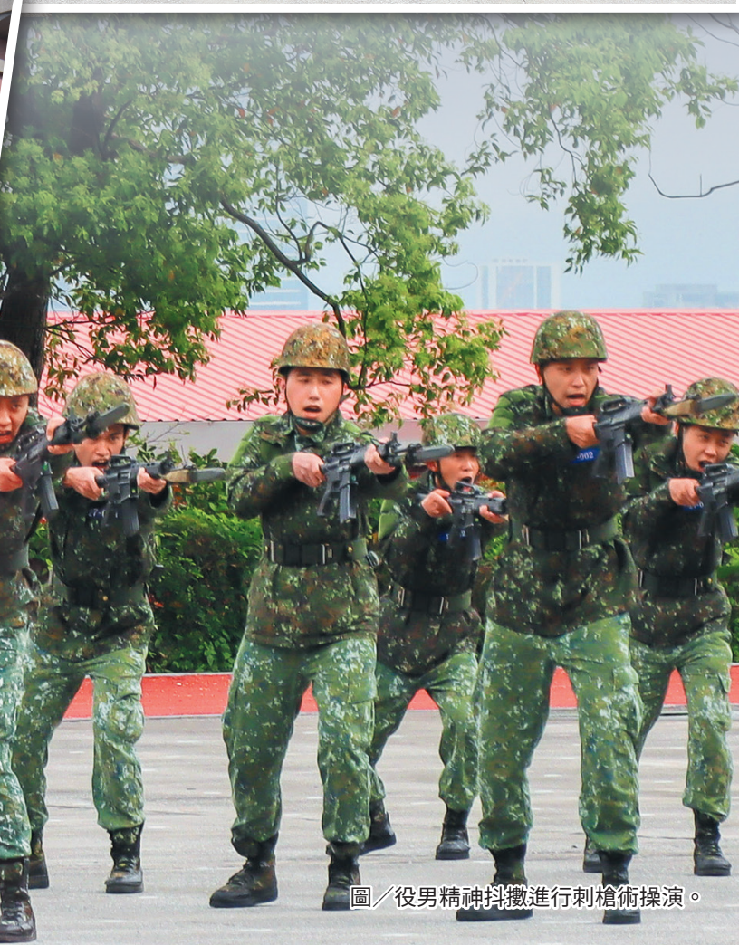
圖／役男精神抖擻進行刺槍術操演。