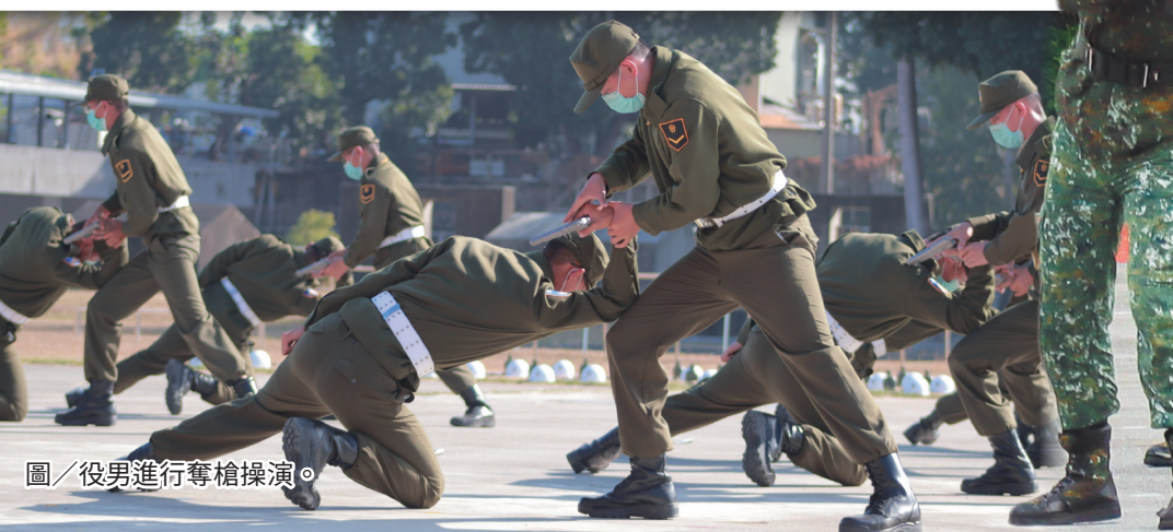
圖／役男進行奪槍操演。