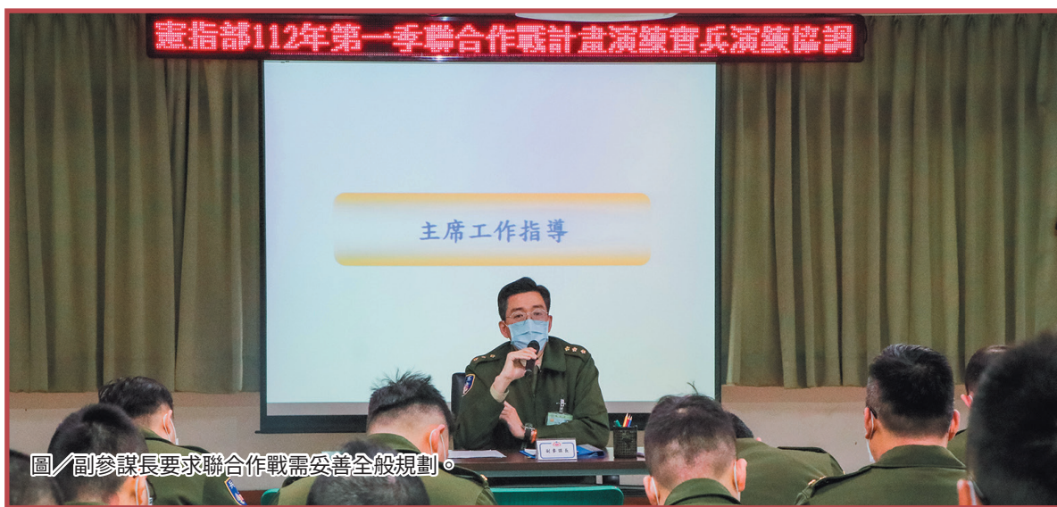
圖／副參謀長要求聯合作戰需妥善全般規劃。