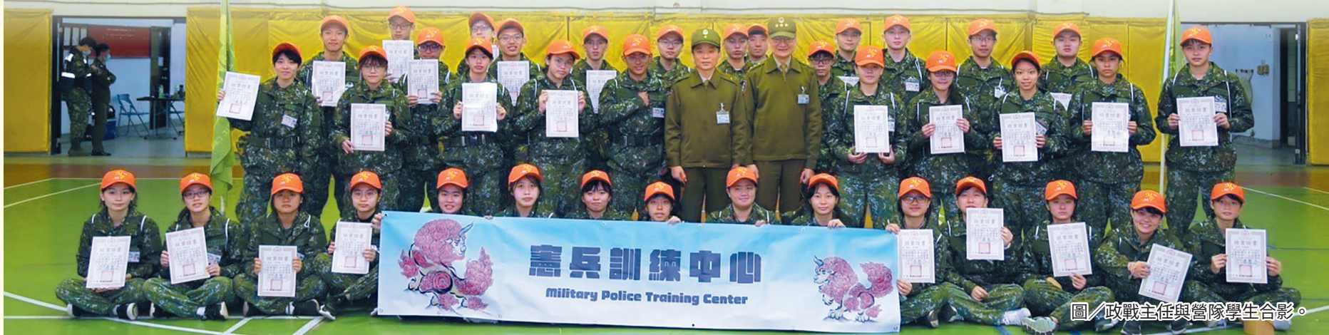
圖／政戰主任與營隊學生合影。