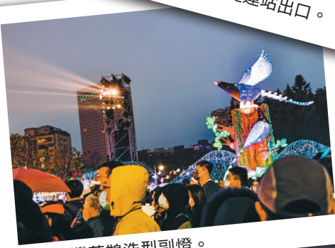
圖／臺灣藍鵲造型副燈。