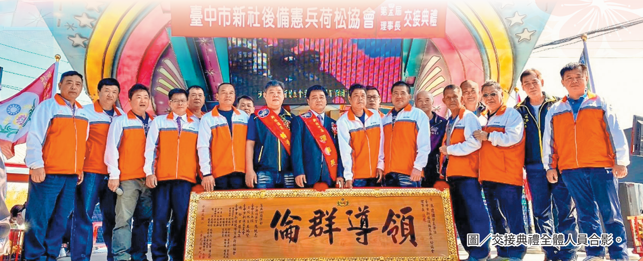
圖／交接典禮全體人員合影。