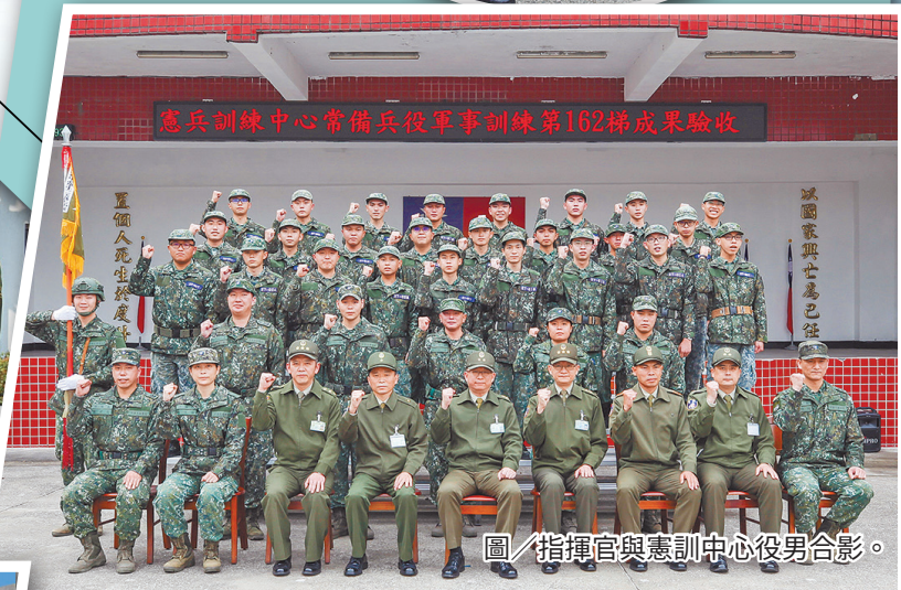
圖／指揮官與憲訓中心役男合影。