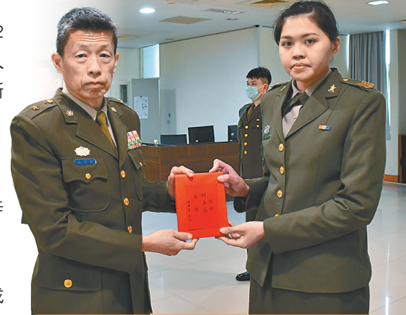
圖／成指揮官頒贈晉任人員晉升禮盒。

成指揮官表示，晉升是責任的加重，期許同仁在未來的軍旅亦持續精進，勇於面對挑戰、完成各項任務，同時感謝眷屬們在背後辛勤支持，讓官兵得以在崗位全心付出；此外，成指揮官亦表揚近期各項工作表現優異人員，提醒所屬持續秉持存誠務實的態度，戮力完成各項戰訓本務。