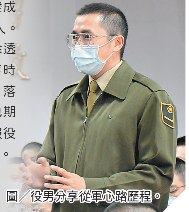
圖／役男分享從軍心路歷程。

張指揮官表示所屬官兵除透過榮譽團會時機提出建議，平時遭遇疑難時便應勇於反應，落實建制組織功效，最後，也期許役男勇敢面對挑戰，讓服役所學成為往後人生堅強力量。