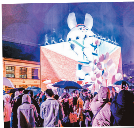
圖／民眾熱烈參觀燈會。