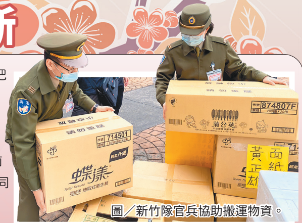
圖／新竹隊官兵協助搬運物資。

組織未來將繼續秉持「把忠心給國家，把愛心獻給社會」之愛民精神，持續推動公益活動，並邀請憲兵隊同仁一同參與，使「前憲後憲，連成一線」，共同發揮愛心、關懷社會。