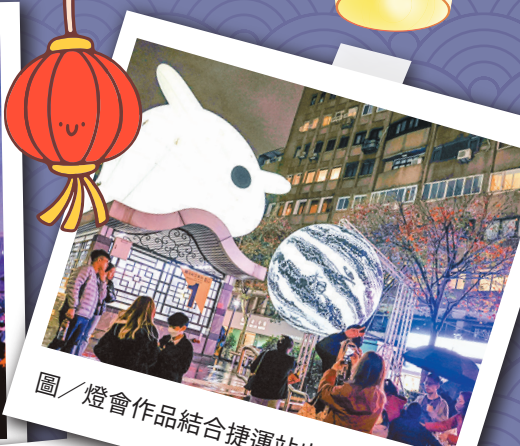
圖／燈會作品結合捷運站出口。