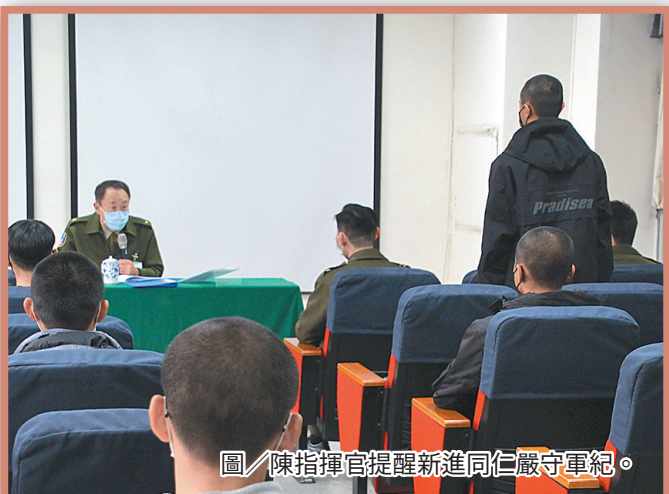
圖／陳指揮官提醒新進同仁嚴守軍紀。

陳指揮官強調，軍人需嚴守軍紀營規，不得將個人帳戶資料或存摺、提款卡借予家人以外的人，避免涉犯司法案件留下案底，且嚴禁營內外兼職兼差等情事；此外