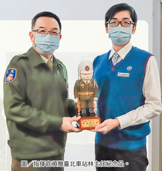
圖／指揮官頒贈臺北車站林主任紀念品。

最後，指揮官強調，現代戰爭常運用高科技武器癱瘓指管系統做為開端，且具備全天候、全方位、全縱深立體作戰之特性，各級幹部應從嚴考量敵情威脅，平日落實部隊戰備訓練，於聯合作戰演練中納入指管系統遭敵破壞想定，有效磨練單位指揮所轉移能力及指管機制恢復韌性，並積極戰場經營作為，整合作戰地境內常備、後備及民防團隊等戰力，藉演訓驗證相互支援作為，進而提升防衛作戰能量，確保我國家安全。