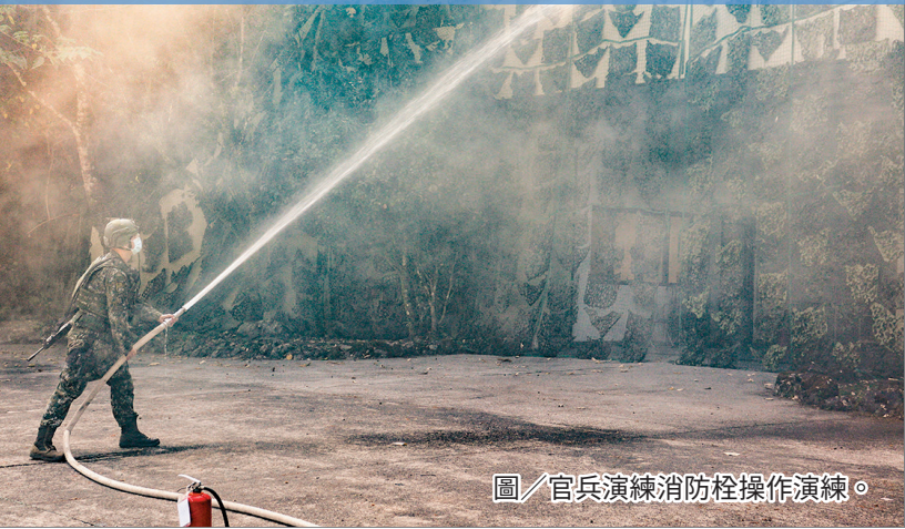
圖／官兵演練消防栓操作演練。