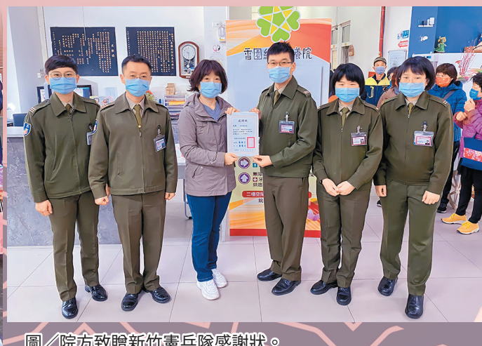
圖／院方致贈新竹憲兵隊感謝狀。