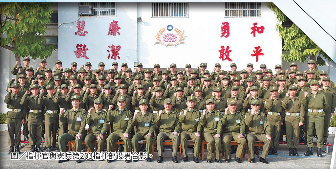
圖／指揮官與憲兵第203指揮部役男合影。