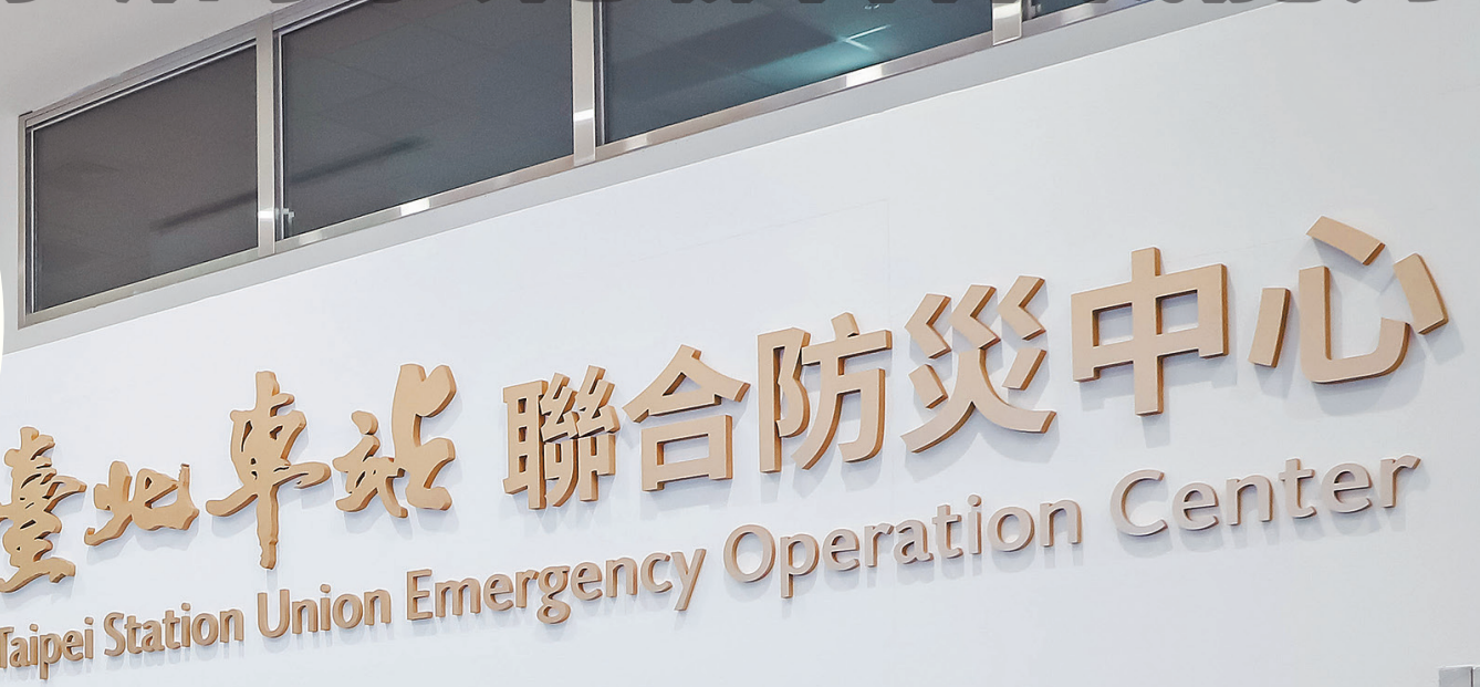
圖／指揮官強調中樞防衛需發揮聯合作戰效能。