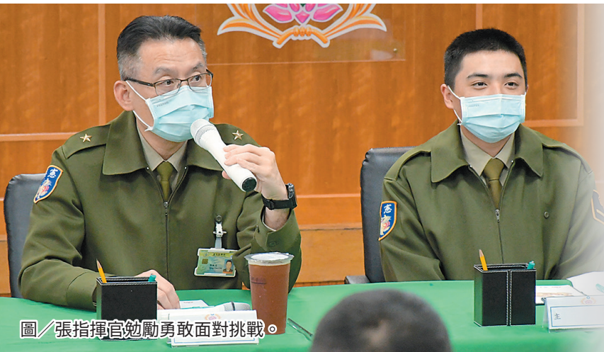
圖／張指揮官勉勵勇敢面對挑戰。