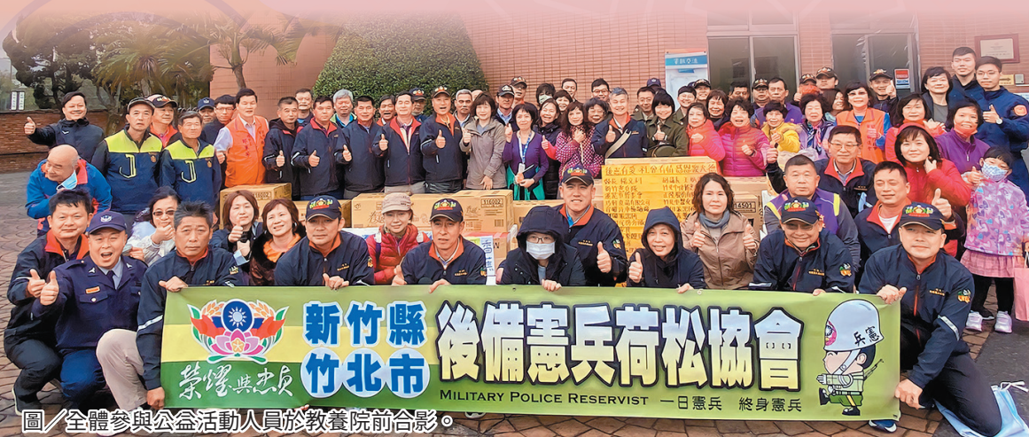
圖／全體參與公益活動人員於教養院前合影。