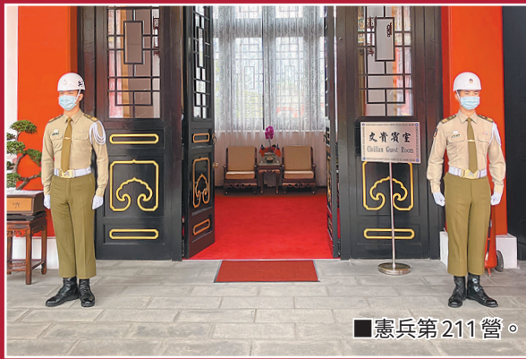
■憲兵第 211 營。

202 指揮官陳少將表示，秋祭是年度重點勤務之一，先賢先烈為國犧牲的愛國情操，是全體官兵效法的典範。延續先烈們的精神，官兵更應體認