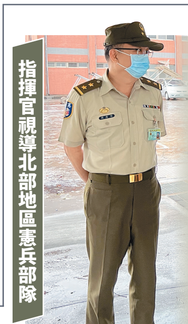
指揮官視導北部地區憲兵部隊