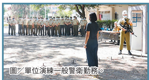
圖／單位演練一般警衛勤務。

最後，夏副指揮官強調，基層單位任務多元且繁瑣，幹部執行工作應以部頒及憲指部制定之準則、規範為根基，擬定標準作業程序，運用建制組織編組，建立幹部督管機制，以提升單位作業紀律及工作效能，確保作業安全無虞。