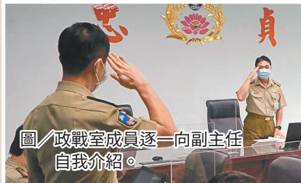
圖／政戰室成員逐一向副主任自我介紹。