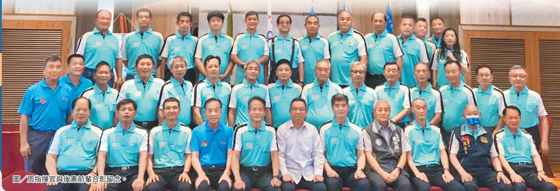
圖／周指揮官與後憲前輩合影留念。

周指揮官表示，後憲組織對地方貢獻是有目共睹的，深獲各界好評，在後憲先進努力經營下，積極推動社會公益及協力維護社會治安工作，展現憲兵作為「民眾之祿、軍武之師」的優良形象。藉此機會，謹代表全體現役憲兵，向後憲前輩致上謝意，期望未來能持續給予現役同仁鼓勵。