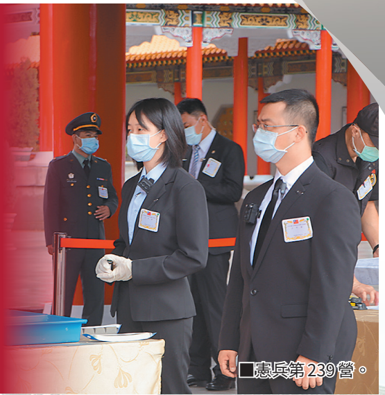
■憲兵第 239 營。