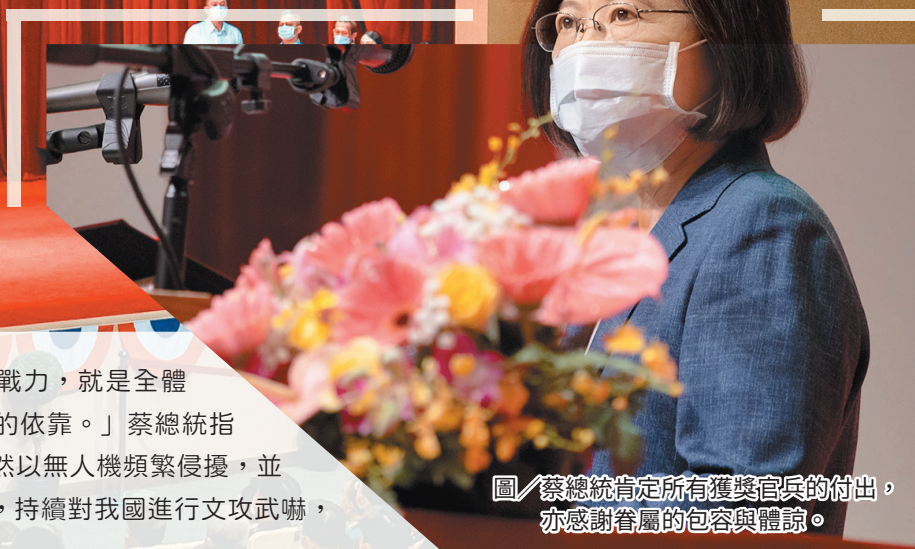
圖/蔡總統肯定所有獲獎官兵的付出，亦感謝眷屬的包容與體諒。