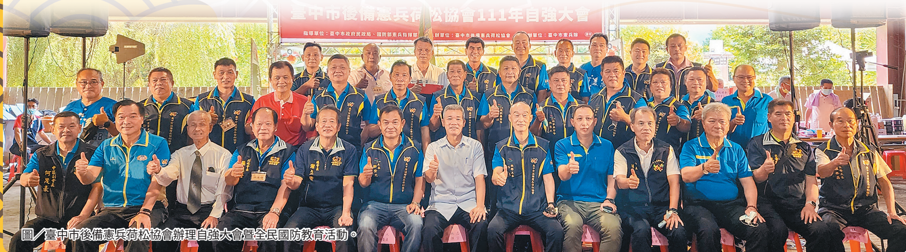
圖／臺中市後備憲兵荷松協會辦理自強大會暨全民國防教育活動。