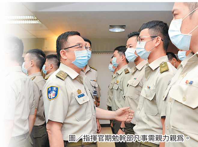
圖／指揮官期勉幹部凡事需親力親為。

最後，指揮官期勉幹部凡事需親力親為，對官兵更要視如己出，做好生活照顧及引導生涯規劃，鼓勵同仁勇於接受挑戰完成學歷向上升遷，以自身服役經驗作為招募宣導，吸引有志在地青年投入憲兵的行列，有效提升單位人力質量。