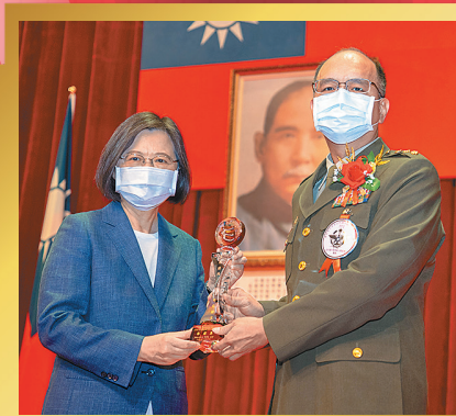
全民國防教育傑出貢獻獎