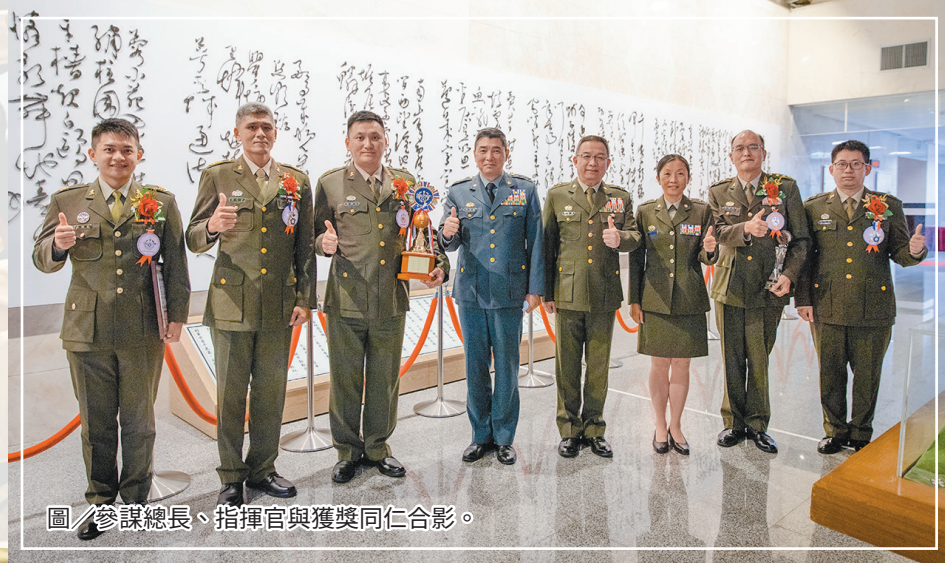
圖/參謀總長、指揮官與獲獎同仁合影。

最後，蔡總統再次恭喜所有得獎者，並感謝所有國軍眷屬的包容和體諒，這份堅定的支持，讓同仁們能無後顧之憂，堅守崗位。