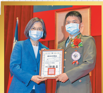
全民國防教育傑出貢獻獎