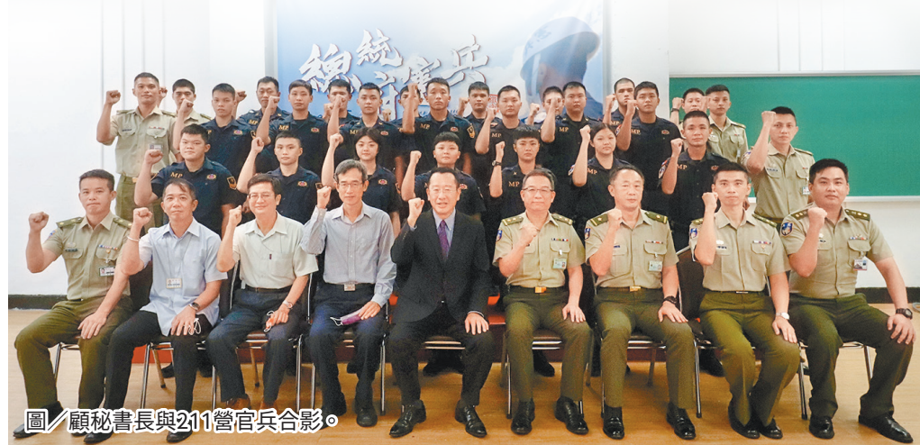
圖／顧秘書長與211營官兵合影。

外(離)島軍事營區，單位應強化府區周遭狀況監控與無人機處置作為教育訓練，每位官兵均熟稔相關應處之程序、步驟及要領，以維府區警衛萬全，並提醒即將執行國慶及元旦升旗等重大任務，勉勵官兵應以身為 211 營一分子為榮，期許秉持優良傳統，完成上級賦予之各項任務，並預祝全體官兵佳節愉快。