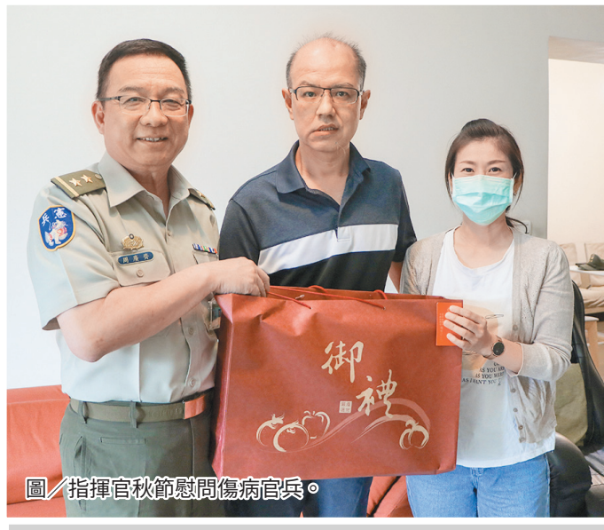
圖／指揮官秋節慰問傷病官兵。