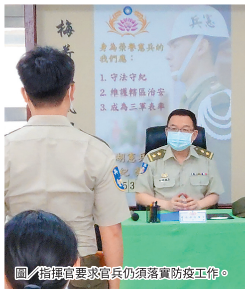
圖／指揮官要求官兵仍須落實防疫工作。