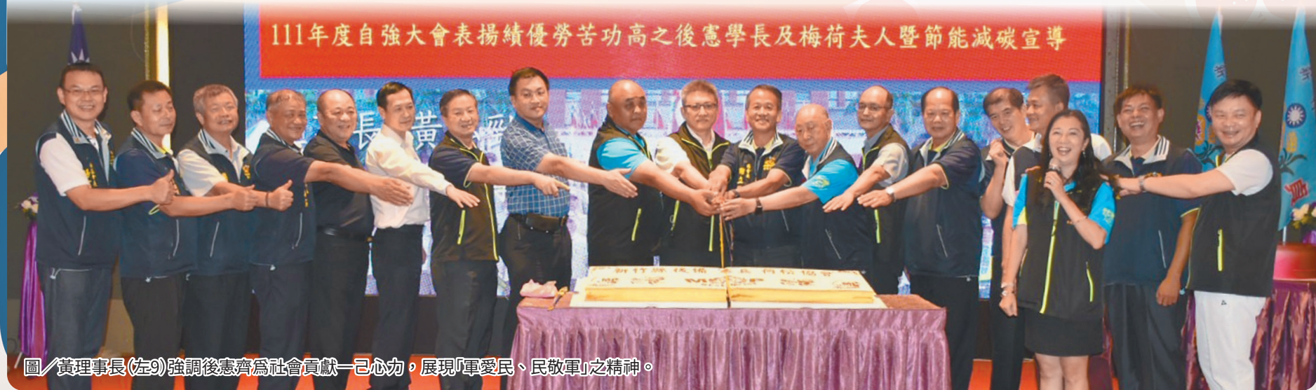
圖／黃理事長(左9)強調後憲齊為社會貢獻一己心力，展現「軍愛民、民敬軍」之精神。