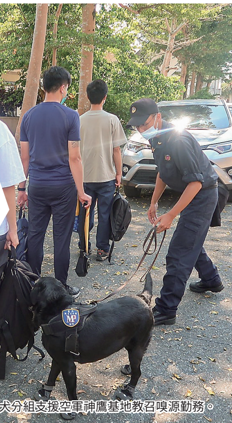
圖／花蓮隊緝毒犬分組支援空軍神鷹基地教召嗅源勤務。