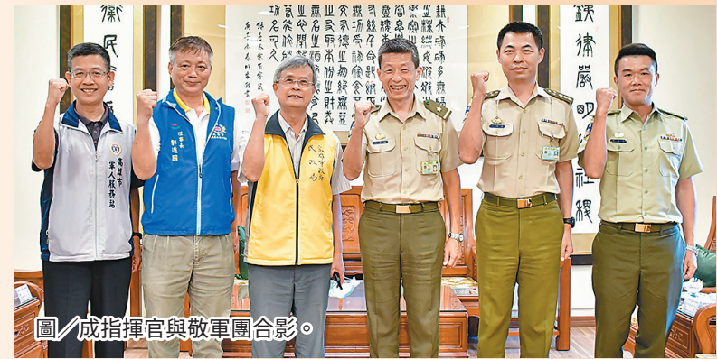
圖/成指揮官與敬軍團合影。