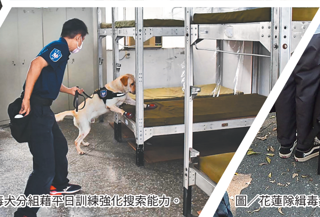
圖／高雄隊緝毒犬分組藉平日訓練強化搜索能力。