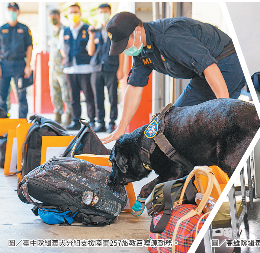
圖／臺中隊緝毒犬分組支援陸軍257旅教召嗅源勤務。