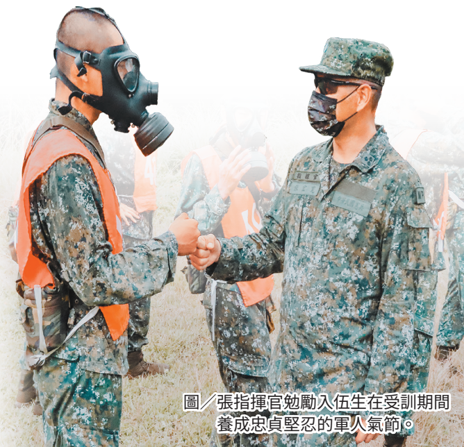
圖/張指揮官勉勵入伍生在受訓期間養成忠貞堅忍的軍人氣節。

最後，張指揮官勉勵全體同仁在入伍訓練期間，除鍛鍊結實的體魄，提升單兵的作戰能力外，更要養成忠貞堅忍的軍人氣節，告訴自己永不放棄、堅持到底，以身為中華民國憲兵為榮！