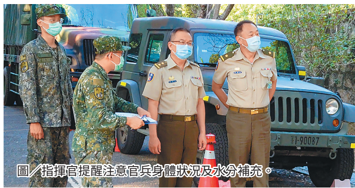
圖／指揮官提醒注意官兵身體狀況及水分補充。

最後，指揮官強調，各級幹部須熟稔單位任務及自身職掌，具備從容自然以口語化方式，結合方向地形地物介紹單位任務，讓蒞部長官能立即了解當前狀況；另叮嚀單位操課前完備急救器材檢整，隨時注意官兵身體狀況及提醒水分補充，慎防熱傷害意外發生。