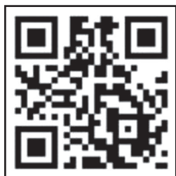
▲有獎徵答 QR Code

國防部提醒，參與此次活動者，須提供真實姓名、身分證字號、地址、電話及年齡等資料，且不得偽造、冒用資料，違者除自負法律責任外，並取消領獎資格。