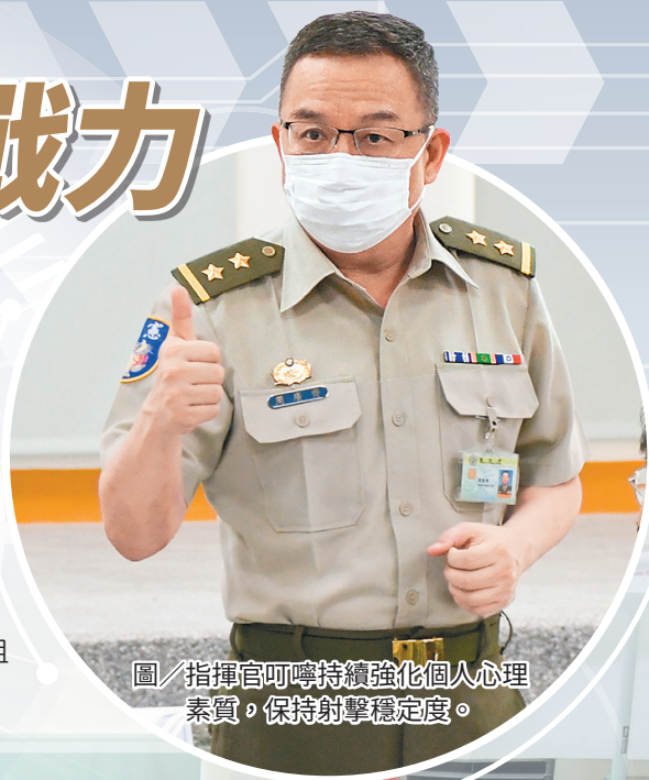
圖／指揮官叮嚀持續強化個人心理素質，保持射擊穩定度。

最後，指揮官強調，幹部應以鼓勵代替責備，透過課後檢討與訓後分析，找出問題並修正訓練方式，進而提升單位整體成績，並強調狙擊手培訓不能侷限於狙擊手競賽，應運用老手帶領新手累積經驗與精進技術，使單位狙擊手量能倍數增長，厚植關鍵戰力。