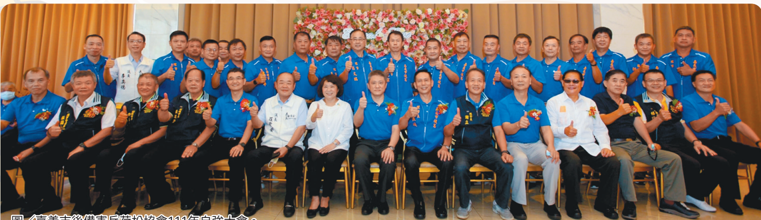
圖／嘉義市後備憲兵荷松協會111年自強大會。

于參謀長表示，後備憲兵成員在鄉服務，秉持「一日憲兵、終身憲兵」優良傳統，善盡己責，為國家盡心盡力，期盼未來能持續延伸服務能量，讓憲兵的精神繼續發揚到社會每個角落。