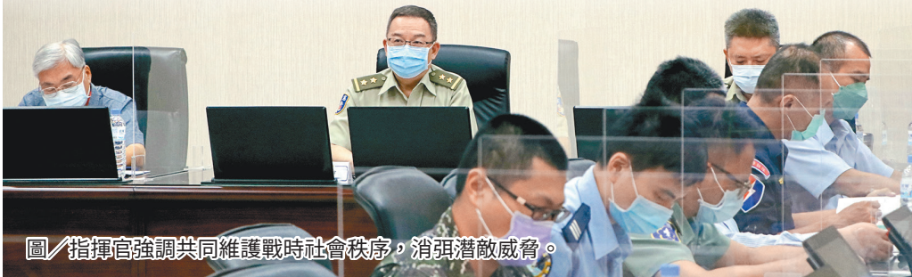
圖／指揮官強調共同維護戰時社會秩序，消弭潛敵威脅。

最後，指揮官強調，現代戰爭發展節奏快速，前後界線模糊，須藉責任地境內警、消、民防團隊等單位，共同維護戰時社會秩序，消弭潛敵威脅，並藉簽署支援協定，戰時徵用、購民間糧秣及油料補給等，化民力為我力，維繫部隊戰力持恆不墜，強化衛戍作戰效能。