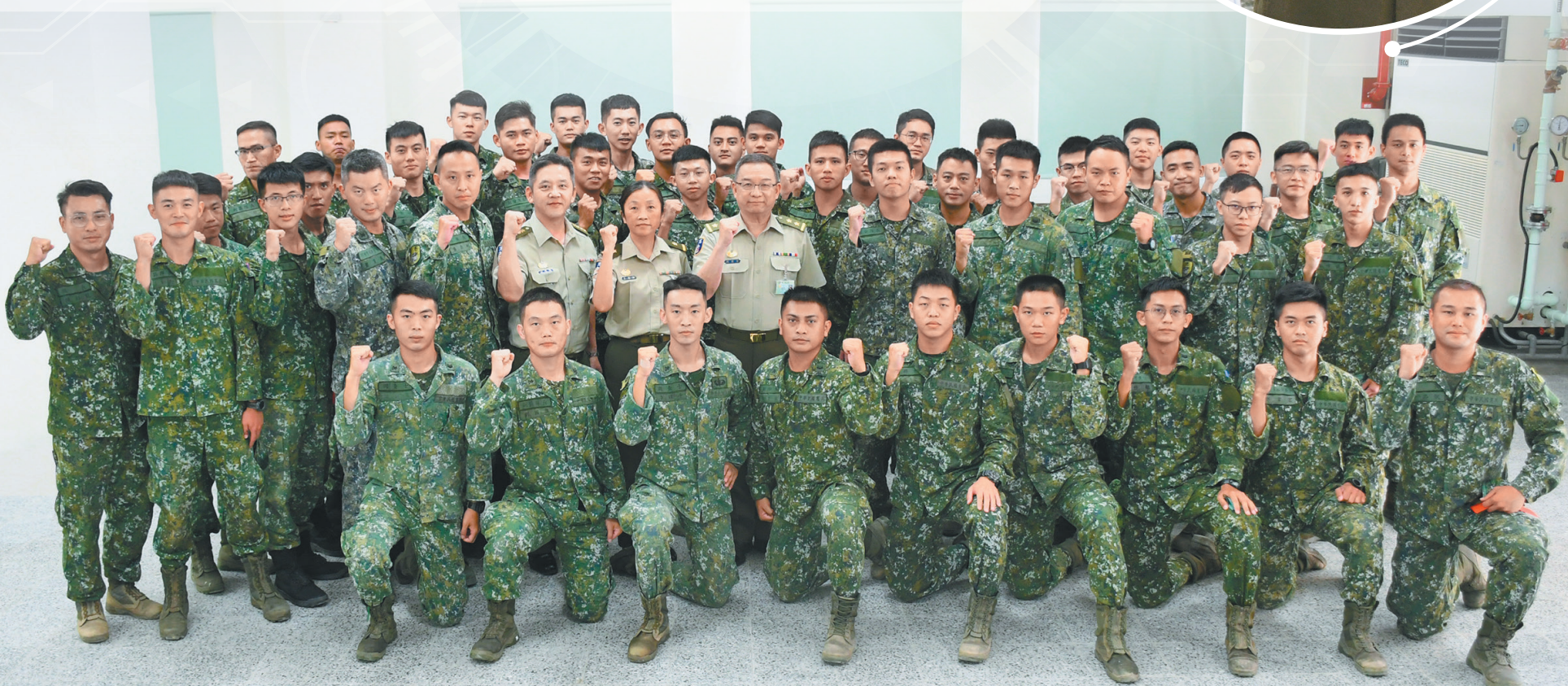
圖／指揮官與狙擊隊集訓人員合影。