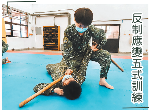
反制應變五式訓練