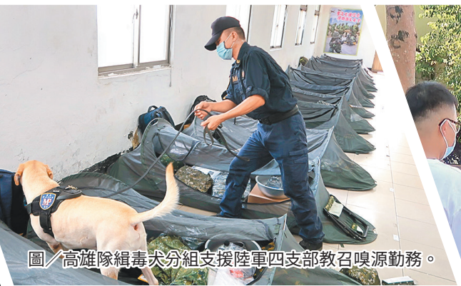
圖／高雄隊緝毒犬分組支援陸軍四支部教召嗅源勤務。