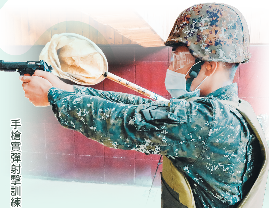
手槍實彈射擊訓練