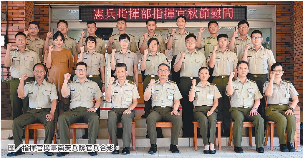
圖/指揮官與臺南憲兵隊官兵合影。