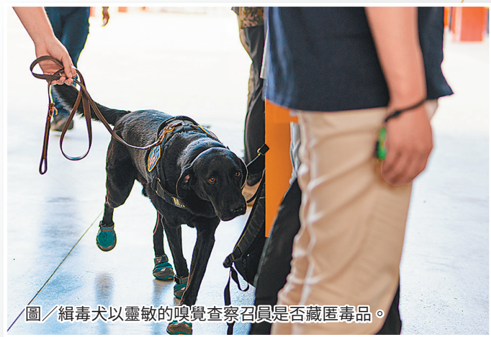
圖／緝毒犬以靈敏的嗅覺查察召員是否藏匿毒品。