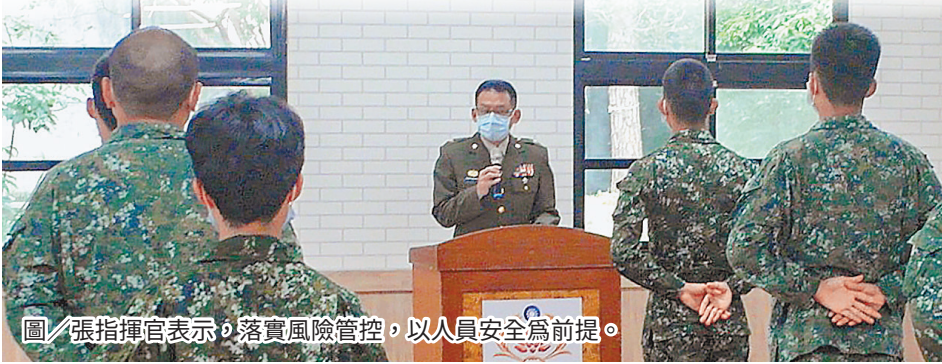
圖/張指揮官表示，落實風險管控，以人員安全為前提。