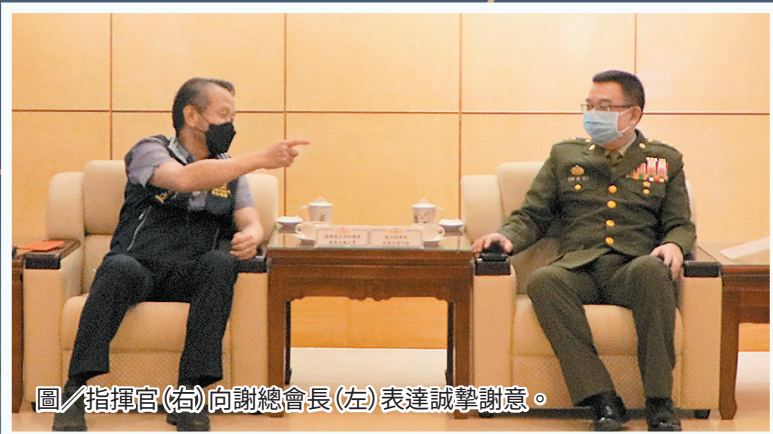
圖／指揮官(右)向謝總會長(左)表達誠摯謝意。

指揮官致詞時歡迎憲兵前輩蒞臨，一同回首憲兵成長歷程，並見證憲兵部隊的成長與進步，期許前憲、後憲共同持續精進，發揮最大戰力。謝總會長則表示近期國內疫情嚴峻，現役官兵不畏辛勞，仍為民站在第一線，堅定的愛國精神令人感佩，特藉端午前夕蒞部慰問，也獻上後憲同仁的關懷與問候，祝福全體官兵佳節愉快，身體健康。