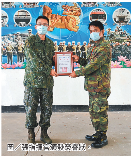
圖／張指揮官頒發榮譽狀。

最後，張指揮官肯定全體召員為保家衛國的付出與貢獻，並表揚教召期間表現優異人員，期勉召員於解召後持續支持國防事務，秉持「在營為良兵，在鄉為良民」的信念，為全國民國防貢獻一己之力。