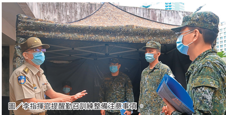
圖／李指揮官提醒勤召訓練整備注意事項。