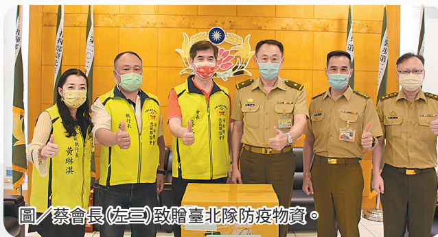
圖／蔡會長(左三)致贈臺北隊防疫物資。

蔡會長表示，憲兵隊官兵平時擔任軍、司法警察職務，協力警方執行治安維護工作，且現值疫情高峰期，國軍傾力協助執行快篩國家隊、環境消毒等疫情防堵工作，更要給予現役官兵支持與鼓勵，故號召後憲同仁力量，共同致贈防疫物資，也向全體官兵說聲「您辛苦了」！。