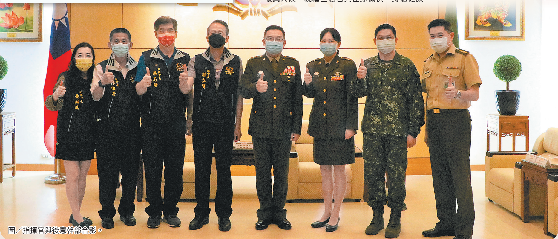
圖／指揮官與後憲幹部合影。