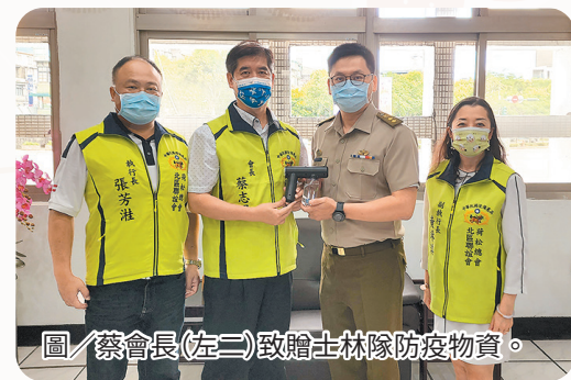
圖／蔡會長(左二)致贈士林隊防疫物資。