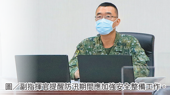
圖／副指揮官提醒防汛期間應加強安全整備工作。

最後，夏副指揮官指出，單位戰力維持有賴人力資源永續經營，期勉各級幹部推廣終生學習，以身作則帶動單位正向風氣，鼓勵所屬進修獲取學歷及考取專業證照，為部隊培育及儲備優質人才。