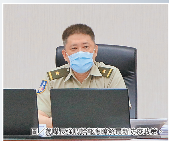
圖／參謀長強調幹部應瞭解最新防疫政策。

最後，于參謀長要求各級單位落實預算執行管制，並提醒裝備採購及工程建案，應嚴格查驗督管，確維建案能如期、如質完成，有效提升單位戰力。