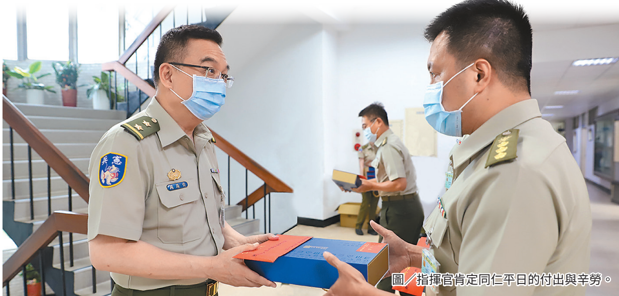
圖／指揮官肯定同仁平日的付出與辛勞。

最後，指揮官表示，端節連假期間以「防疫」為優先考量，鼓勵改由視訊團聚的方式解思鄉之情，減少人群接觸，也避免出入人潮擁擠、密閉空間等危安熱點場所，保護自身與家人的安全。最後，預祝同仁端節愉快，平安健康。