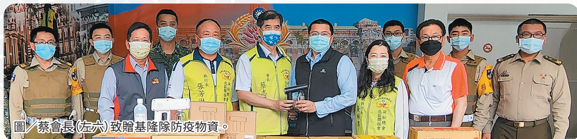
圖／蔡會長(左六)致贈基隆隊防疫物資。