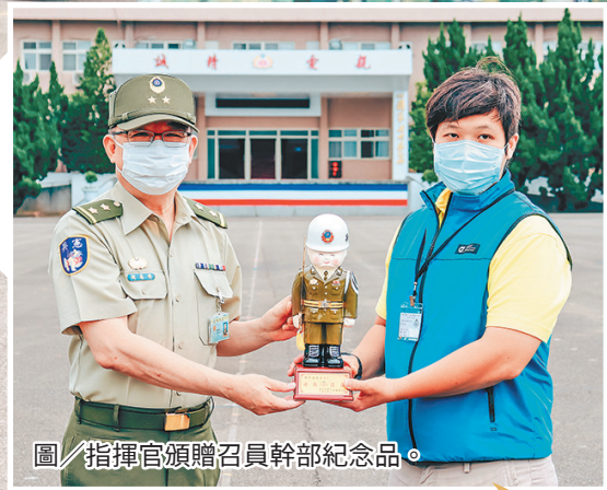
圖／指揮官頒贈召員幹部紀念品。

最後，指揮官要求接訓幹部，須完善實彈射擊訓練各項編組及安全管控，確遵準則教範要求，善盡督管責任，落實按表操課，避免肇生危安情事，以提升教召訓練成效。