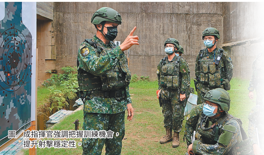
圖／成指揮官強調把握訓練機會，提升射擊穩定性。