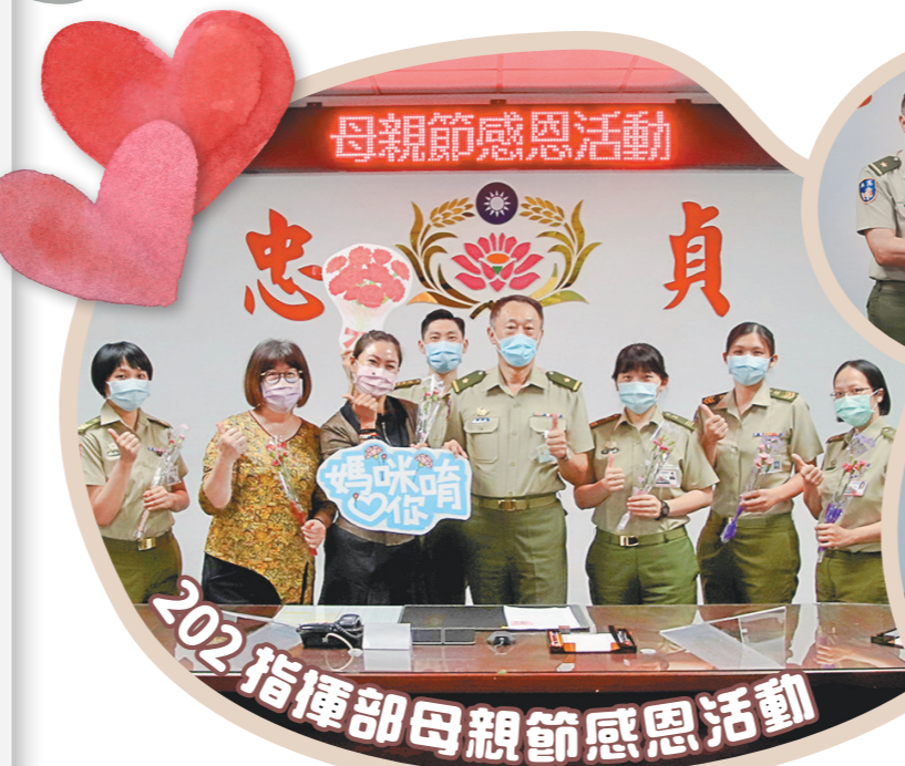
202 指揮部母親節感恩活動

天空廣闊，比不上母親的博愛；太陽溫暖，比不上母親的真情；鮮花燦爛，比不上母親的微笑，祝福天下媽媽母親節快樂，身體健康、永遠美麗。