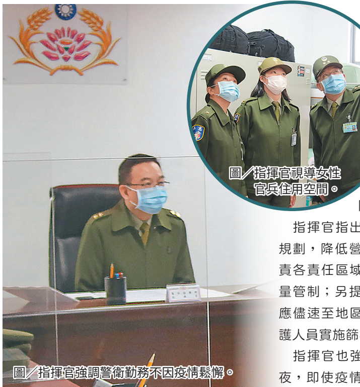
圖／指揮官視導女性官兵住用空間。