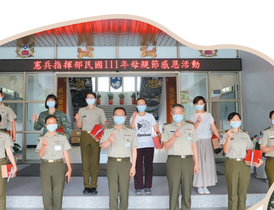
憲兵指揮部母親節感恩活動