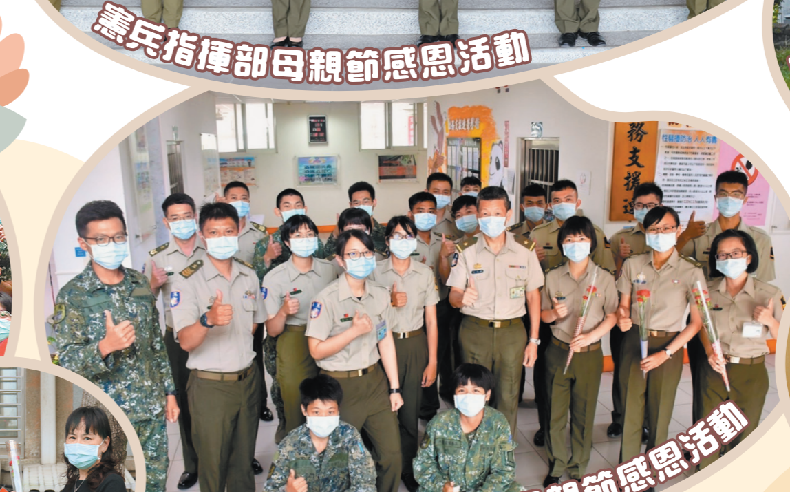
204 指揮部母親節感恩活動