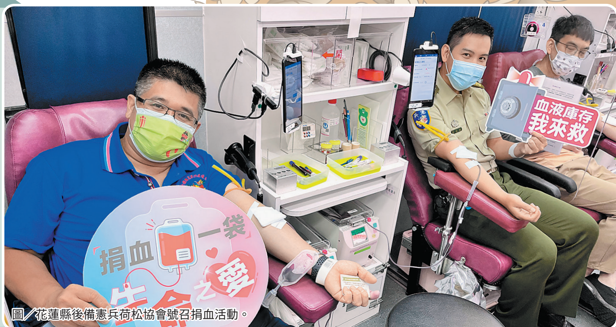
圖／花蓮縣後備憲兵荷松協會號召捐血活動。

陳理事長表示，在疫情衝擊下，國內捐血人數下降，導致血庫各型血包儲量不足，藉由本次活動紓緩國內血荒，緩解醫療燃眉之急，將熱血提供給需要幫助的人，讓寶貴的生命得以延續。