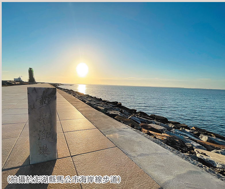
(拍攝於澎湖縣馬公市海岸線步道)

金黃色的光芒映照在海平面上，像是為湛藍的海洋披上一件金色披風，既美麗又神氣。偶然慢跑在澎湖的海邊，意外的落日餘暉卻讓我不捨離去，療癒的畫面便成了我每次運動時最期待的驚喜，紓解平時工作的壓力。每個人的軍旅都有著獨一無二的浪漫故事，而澎湖的夕陽美景已永恆地留在我的記憶。