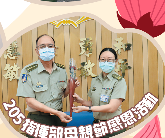
205 指揮部母親節感恩活動