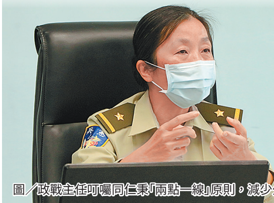
圖／政戰主任叮囑同仁秉「兩點一線」原則，減少外出。