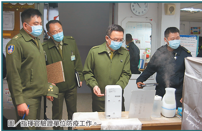
圖／指揮官驗證單位防疫工作。

最後，指揮官再次提醒官兵提高防疫警覺，休假期間減少出門，降低人員接觸風險，如有外出必要，務須配戴口罩，杜絕染疫風險，共同戰勝疫情威脅，維繫部隊戰力。