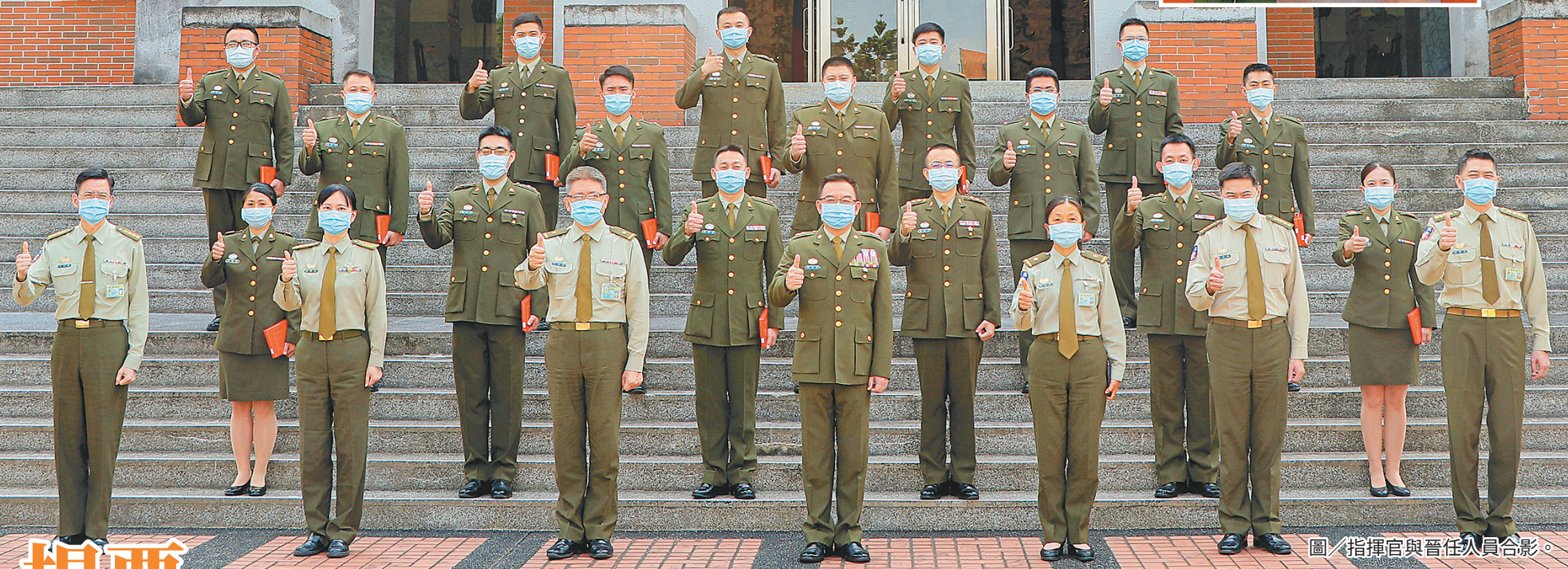
圖／指揮官與晉任人員合影。