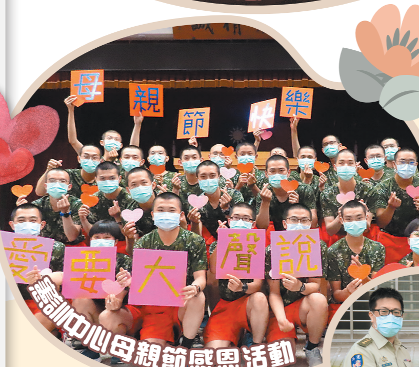
訓練中心母親節感恩活動