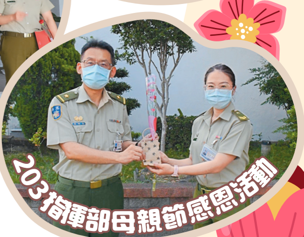
203 指揮部母親節感恩活動