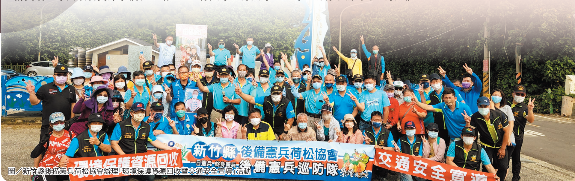
圖／新竹縣後備憲兵荷松協會辦理「環境保護資源回收暨交通安全宣導」活動。

最後，黃理事長強調，本次活動更是以實際行動發揚忠貞憲兵「愛國、愛鄉、愛土」之精神，秉「身教重於言教」理念，帶領子女共同維護自己的家鄉，培養兒童愛護環境的情操，增進環境保育知能。