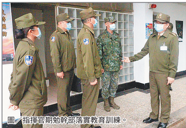
圖／指揮官期勉幹部落實教育訓練。

訓練，確依國防部政策指導，按部就班完成各階段任務，並做好風險管控措施，強化各項突發狀況應變處置能力；另藉由此次任務，提升人員編實與裝備庫儲管理效能，整合民、物力動員能量，期達「及時