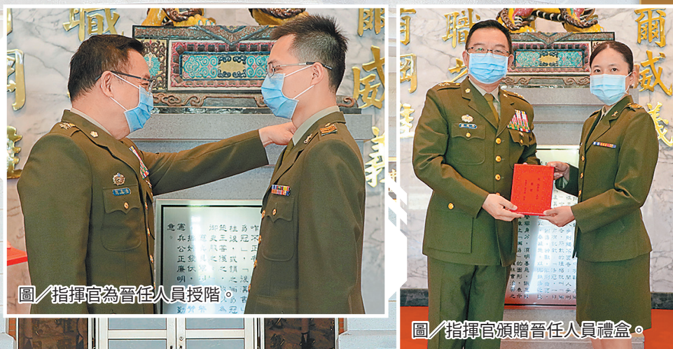
圖／指揮官為晉任人員授階。

指揮官表示，晉任是責任的加重，身為憲兵，凡事更應守法重紀；身為領導幹部，應以身作則，期勉晉任同仁勇於任事，落實命令貫徹，並持恆精進本職學能，發揮個人專業專長，創造「服務機會」與「自我價值」，在軍旅生涯中更上層樓。