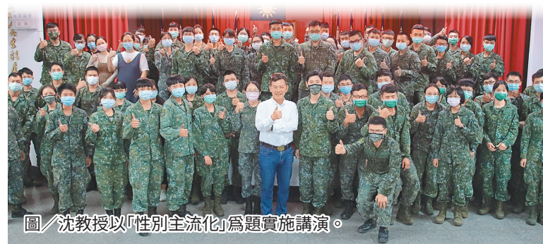
圖／沈教授以「性別主流化」為題實施講演。