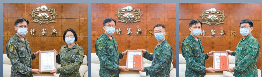
圖／袁指揮官表揚軍偵績效優異人員。

最後，袁指揮官勉勵，近期天氣逐漸轉涼，官兵同仁們應注意身體保健，各級幹部應落實內部管理，強化幹部領導統御，並以「身教重於言教」之態度帶領官兵，秉持「完全負責、全力以赴」的精神，不論遇到任何問題，都應立即向上級反映，再由幹部適予協處，共同營造和諧愉悅的環境，確維部隊整體戰力。