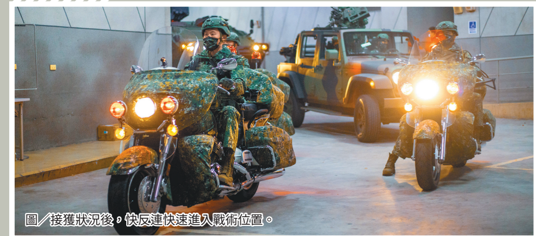
圖／接獲狀況後，快速反應連迅速進入戰術位置。

絕交通要道。各單位在接獲狀況後，立即實施戰備集合及裝載，由各級主官完成任務賦予、機動路線確認及重點提示，操演官兵隨即出發前往任務位置，模擬各項狀況並處置，衛戍重要防護目標。 (文／本報訊)