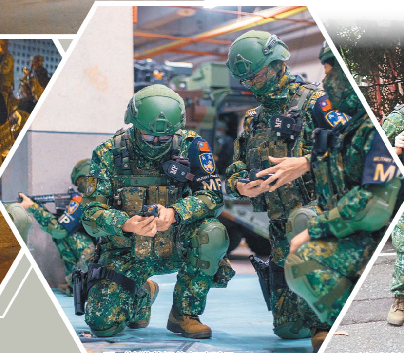
圖／接獲狀況後任務賦予。