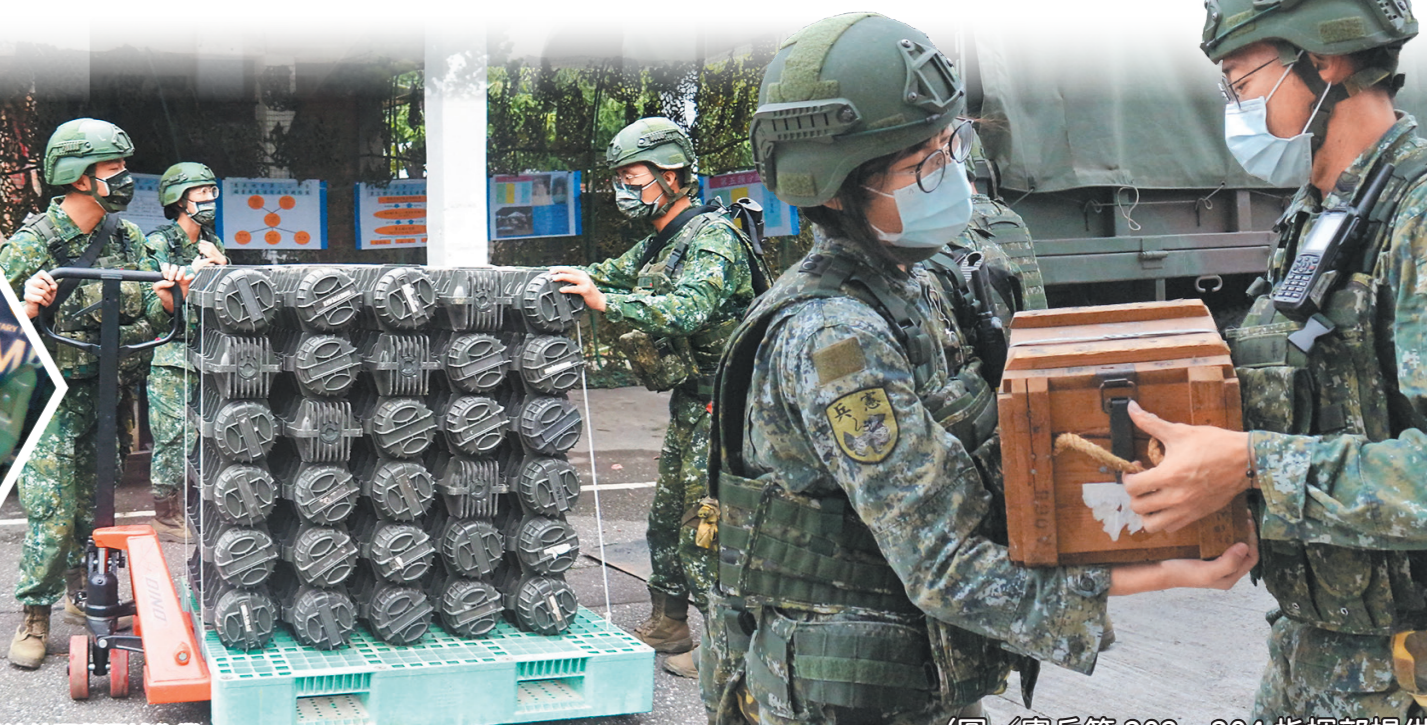
圖／官兵演練彈藥運補作業。