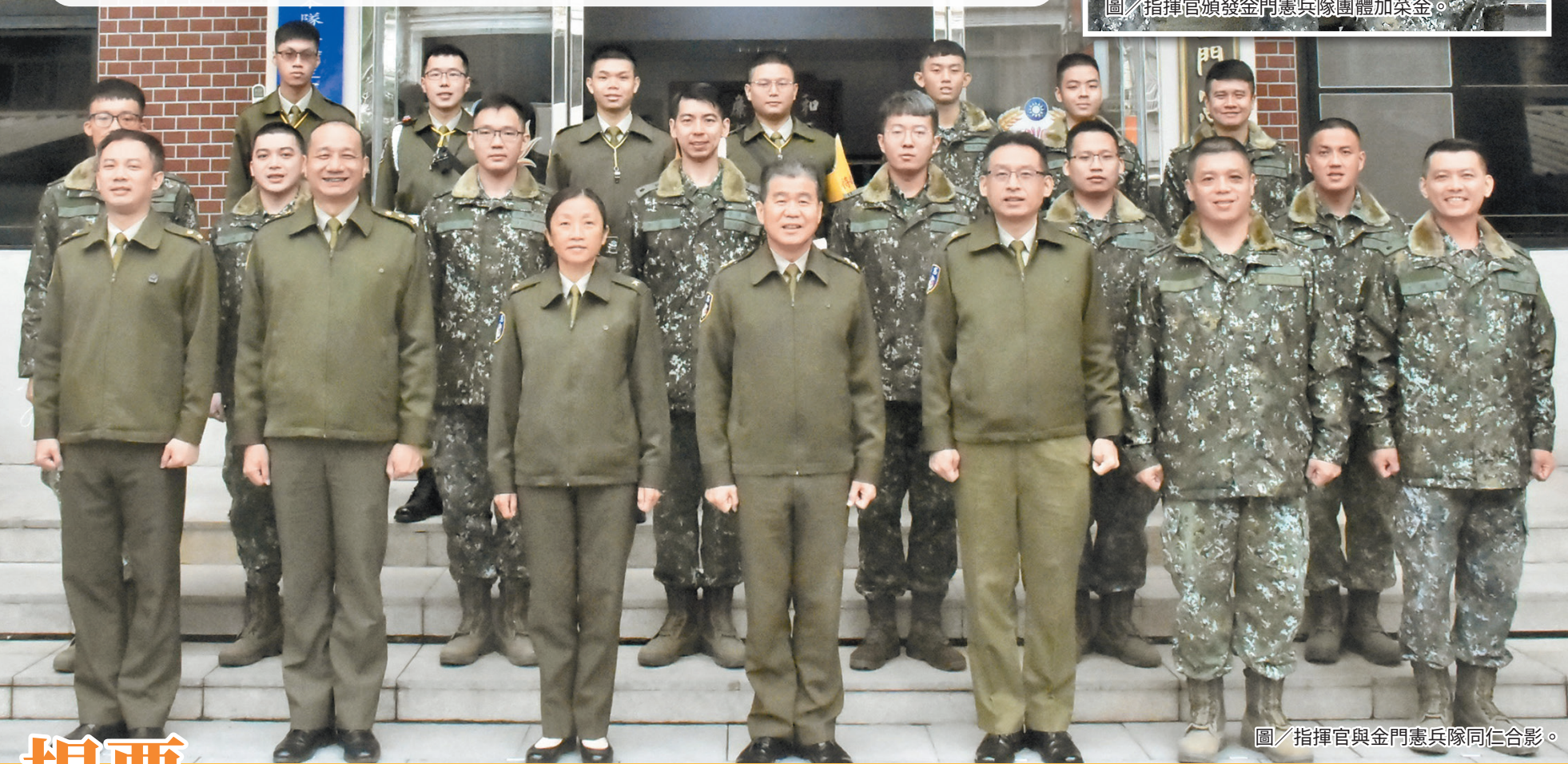
圖 / 指揮官與金門憲兵隊同仁合影。