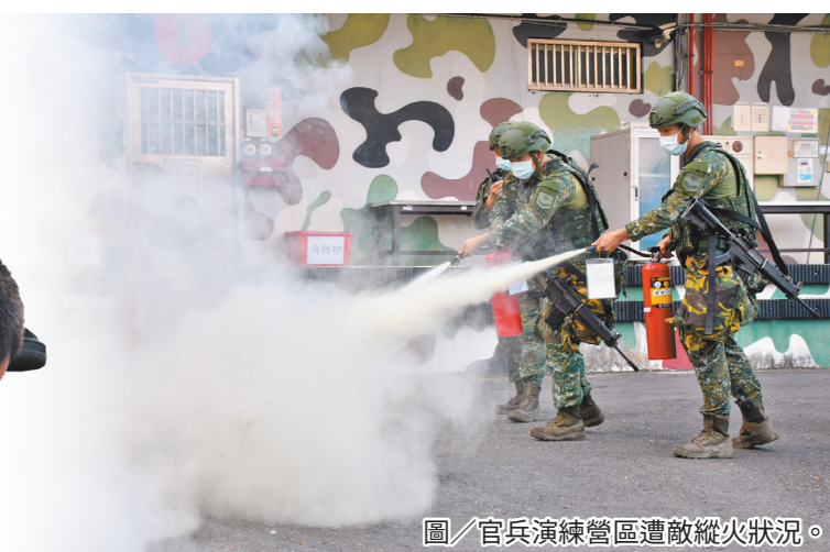
圖／官兵演練營區遭敵縱火狀況。

為強化營區安全狀況應處，突發狀況處置能力，憲兵第 202、204 指揮部分別於中華營區、鐵衛營區執行安全防護演練。狀況發布後，各編組迅速進入戰術位置，編成防空火網對四周空域實施警戒，接著，先後針對衛兵遭敵攻擊、弟兄產生怯戰及突入之敵對我營內重要設施進行縱火等狀況實施演練，使官兵熟稔各項狀況處置流程及磨練個人戰鬥技巧，同時強化幹部應變處置能力，確保營區安全。 (文／憲兵第 202 指揮部詹効耘中尉)