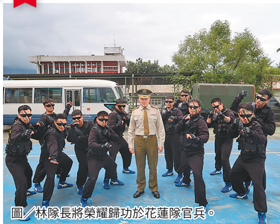
圖／林隊長將榮耀歸功於花蓮隊官兵。