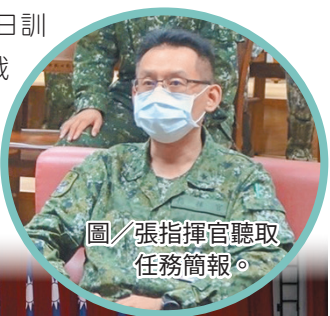
圖／張指揮官聽取任務簡報。

張指揮官表示，戰訓為軍人本務，同仁應把握平日訓練機會，提升專業戰鬥技能，以利戰時有效發揮戰力；另提醒同仁近期適逢時節交替，請幹部務必落實關懷所屬身體保健，如有身體不適等狀況應立即就醫，以安全為首要，杜絕訓練失慎情事。