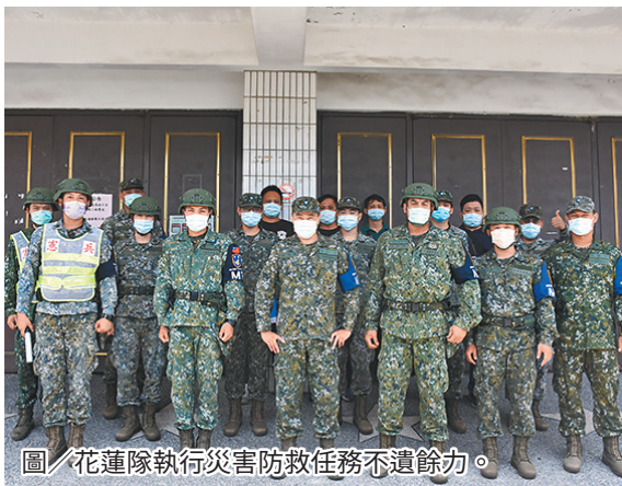
圖／花蓮隊執行災害防救任務不遺餘力。