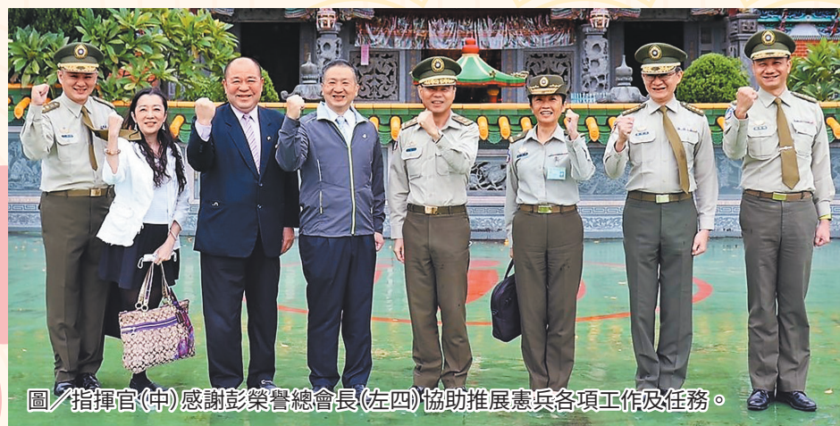
圖／指揮官(中)感謝彭榮譽總會長(左四)協助推展憲兵各項工作及任務。

最後，指揮官特別感謝彭榮譽總會長、後憲先進及其寶眷們，給予現役官兵莫大的支持與鼓勵。