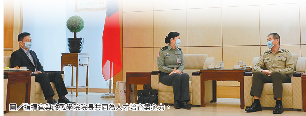
圖／指揮官與政戰學院院長共同為人才培育盡心力。