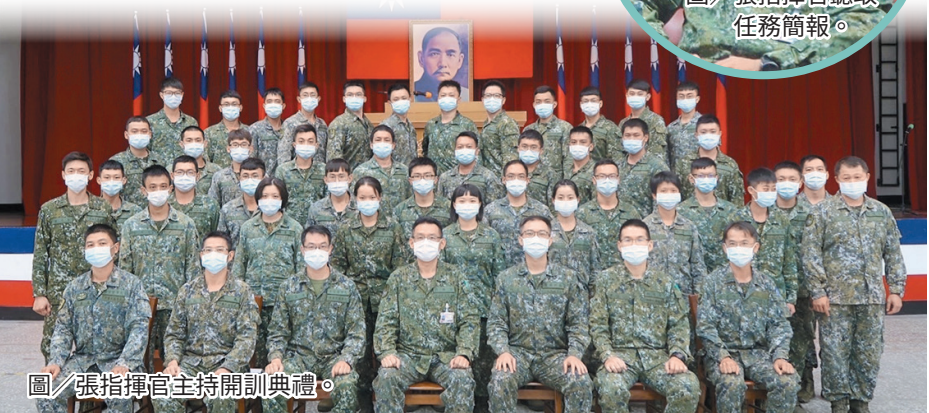
圖／張指揮官主持開訓典禮。