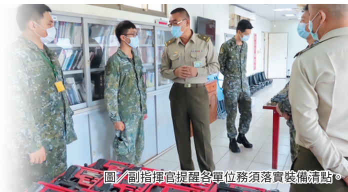
圖／副指揮官提醒各單位務須落實裝備清點。