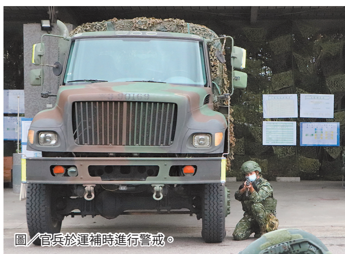
圖／官兵於運補時進行警戒。

憲兵第 202 指揮部第 239 營及第 228 營實施「機動全裝載暨戰力保存」演練，部隊採「實兵實裝、異地縮距」方式進行驗證，並依作戰想定進程及當前狀況實施前支作業，驗證後勤指管機制與運補時空因素。 在接獲開設命令通報後，營部連依計畫於營指揮所周邊開設第一類糧秣、第三類油料、第五類彈藥分配點、第八類救護站及第九類修補站等輜重編組。後勤設施為持續部隊戰力及支援作戰的重要環節，藉演練完善後勤支援作業機制，以達支援作戰之目的。 (文／憲兵第 239 營謝儀臻上尉)