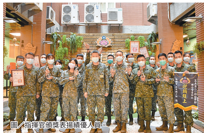
圖／指揮官頒獎表揚績優人員。

最後，成指揮官期許官兵展現身為三軍表率的精神與士氣，嚴守紀律、恪盡職責，建立紀律嚴整、戰力堅實的憲兵部隊。