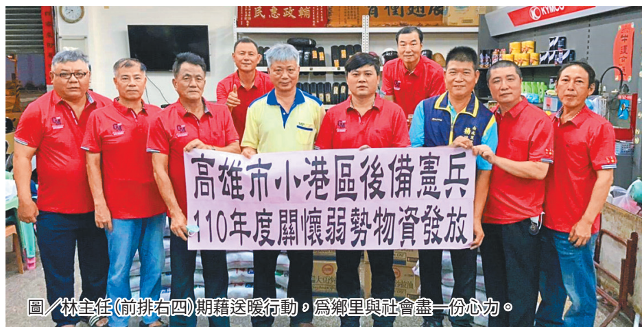
圖／林主任(前排右四)期藉送暖行動，為鄉里與社會盡一份心力。

郭理事長表示，今年受疫情影響，弱勢族群生活更為艱苦，後備憲兵秉持「社會有愛、行善最樂」之宗旨，響應地方號召伸出援手，發揮「人飢己飢、人溺己溺」之精神，幫助更多貧苦的人，期藉由此次行動拋磚引玉，為鄉里與社會盡一份心力。