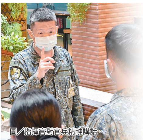
圖／指揮官對官兵精神講話。