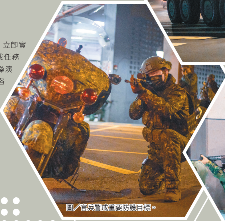
圖／官兵警戒重要防護目標。