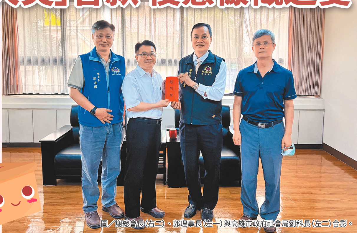
圖／謝總會長(右二)、郭理事長(左一)與高雄市政府社會局劉科長(左二)合影。