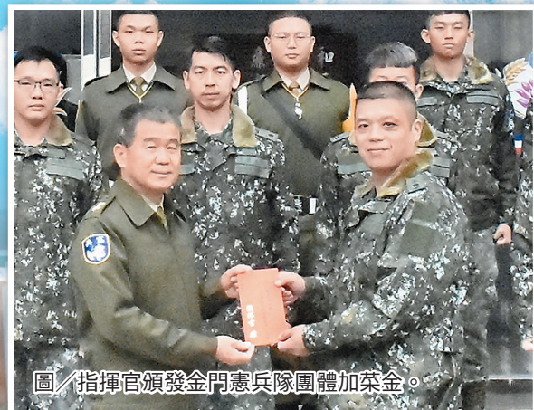
圖 / 指揮官頒發金門憲兵隊團體加菜金。

指揮官要求同仁應「自律」與「慎獨」，以高標準自我要求，持恆鍛鍊強健體魄，戮力執行戰備任務訓練，同時完善生涯規劃，增進本職學能，為建構憲兵戰力貢獻一己之力。