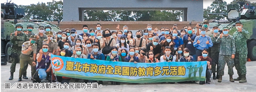
圖／透過參訪活動深化全民國防共識。