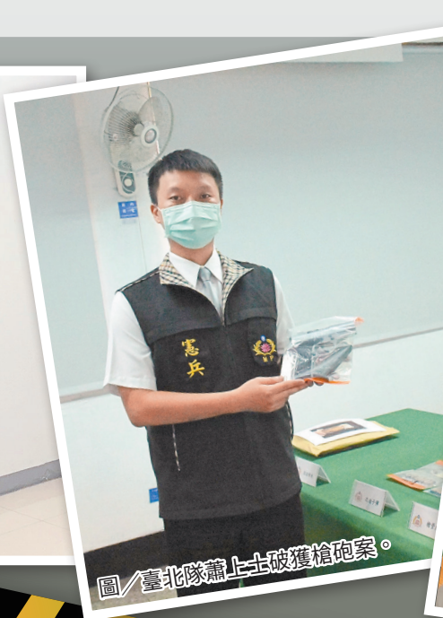
圖／臺北隊蕭上士破獲槍砲案。