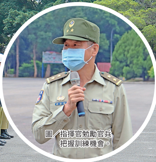
圖／指揮官勗勉官兵把握訓練機會。