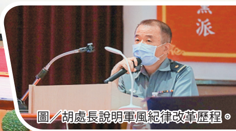
圖／胡處長說明軍風紀律改革歷程。