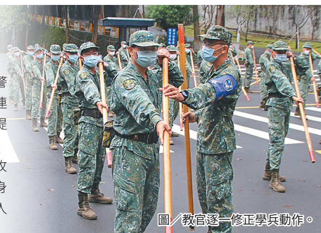
圖／教官逐一修正學兵動作。