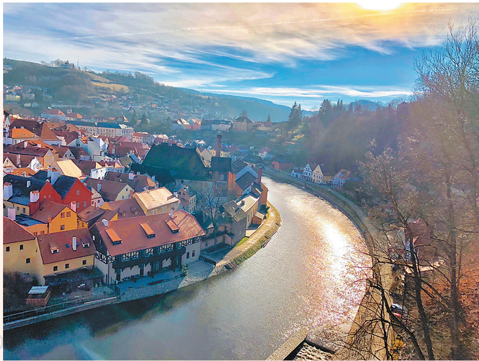
民國 106 年 12 月 7 日 攝於捷克布拉格 庫倫洛夫

結束旅程，我再次燃起熱情與希望，感到疲憊時，只要再看到這張照片，我便能回憶起這道曙光，給予我滿滿的溫暖，成為我堅持不懈的能量。