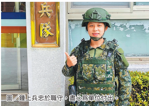
圖／鍾上兵忠於職守，盡心為單位付出。