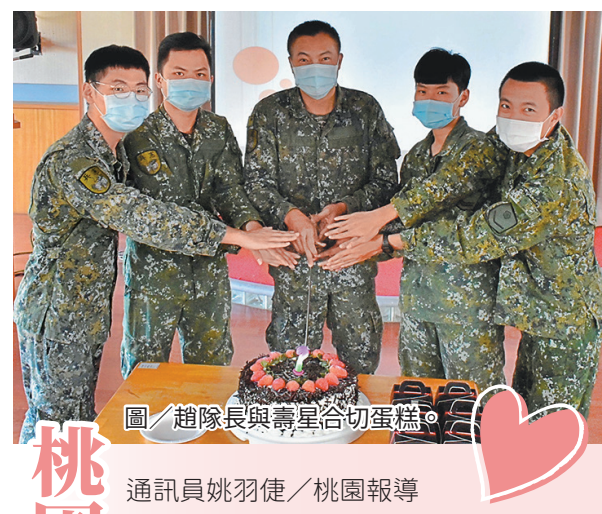
圖／趙隊長與壽星合切蛋糕。