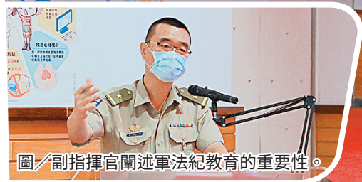
圖／副指揮官闡述軍法紀教育的重要性。