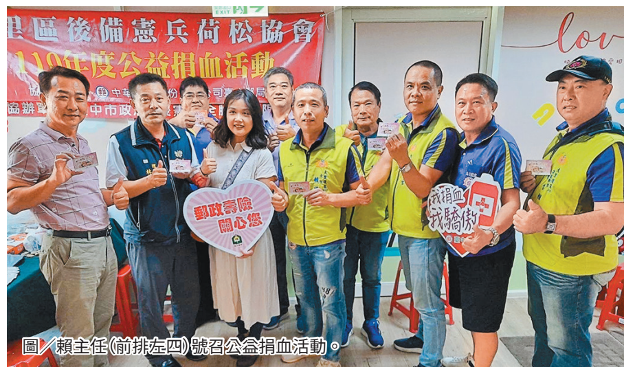
圖／賴主任(前排左四)號召公益捐血活動。

賴主任表示，因疫情導致血庫存量不足，如今疫情已逐漸趨緩，便號召同仁挽袖捐血，募集醫療用血，以供救人之需。期藉由此次行動，帶動社會大眾一同捐血獻愛，為社會公益盡一份心力。