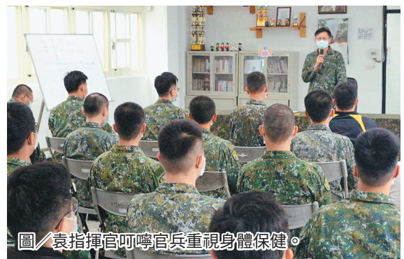
圖/袁指揮官叮嚀官兵重視身體保健。

袁指揮官以友軍近日肇生之軍紀案件為例，提醒各級幹部應主動發掘異常徵候，避免憾事發生。最後，袁指揮官叮嚀天候轉涼，請所屬官兵重視自我身體保健。