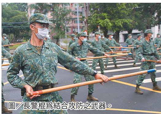
圖／長警棍為結合攻防之武器。

連上士表示，長警棍並非單純的攻擊性武器，而是結合攻防，在執行防暴任務時，用以打擊暴亂分子、應對近距離人身攻擊等，更能應用於日常防身，遭遇危難時挺身而出，保護人民安全，維護社會治安。