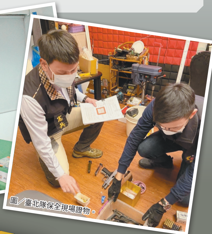
圖／臺北隊保全現場證物。