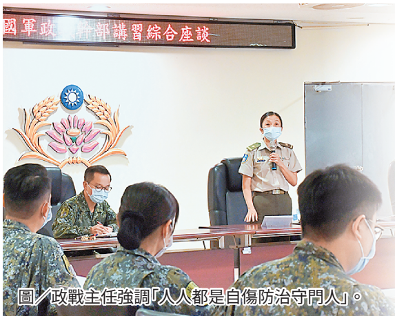
圖/政戰主任強調「人人都是自傷防治守門人」。