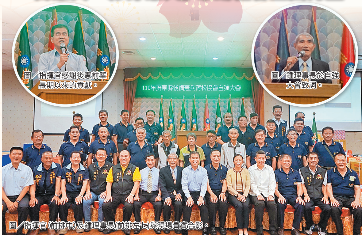
圖／指揮官感謝後憲前輩長期以來的貢獻。

指揮官表示，一日憲兵終身憲兵，後憲前輩利用工作之餘在鄉為社會服務，係現役官兵學習的榜樣。亦感謝全體同仁，共同遵守防疫規範，疫情方能趨緩，並在鍾理事長賢伉儷的努力下，使得本次自強大會成功、圓滿。