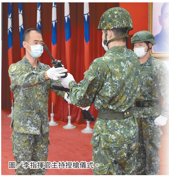
圖/李指揮官主持授槍儀式。