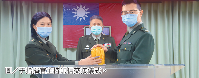
圖/于指揮官主持印信交接儀式。