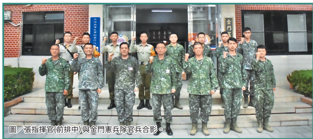
圖/張指揮官(前排中)與金門憲兵隊官兵合影。

安維護工作，單位主官、管應貫徹軍法紀教育工作，運用多元管道活化宣教內容，使法治觀念深植官兵內心，維護軍紀安全。最後，張指揮官叮嚀各級幹部，務須落實官兵照護，運用組織凝聚單位向心，共創優質勁旅。