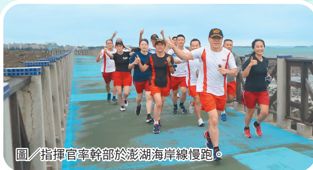
圖／指揮官率幹部於澎湖海岸線慢跑。