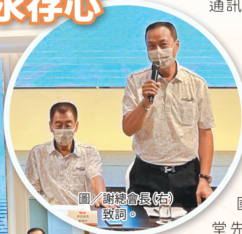
圖／謝總會長(右)致詞。

謝總會長表示，為使南部地區後憲成員能在工作之餘聯繫感情，特別辦理聯誼會活動，除堅定彼此情誼、增進團體向心力，更期勉後憲同仁能持續推動社會公益，為社會挹注正向能量，發揚後憲「情同手足、愛民助民」之精神。