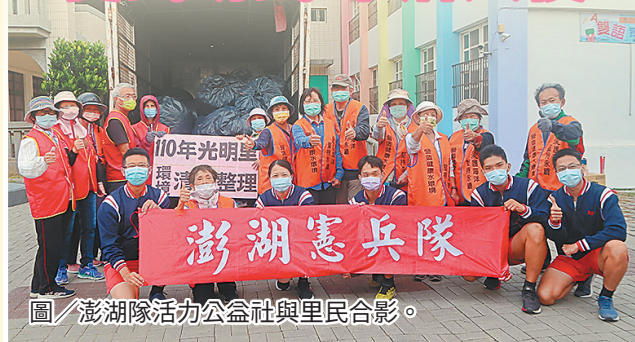
圖／澎湖隊活力公益社與里民合影。