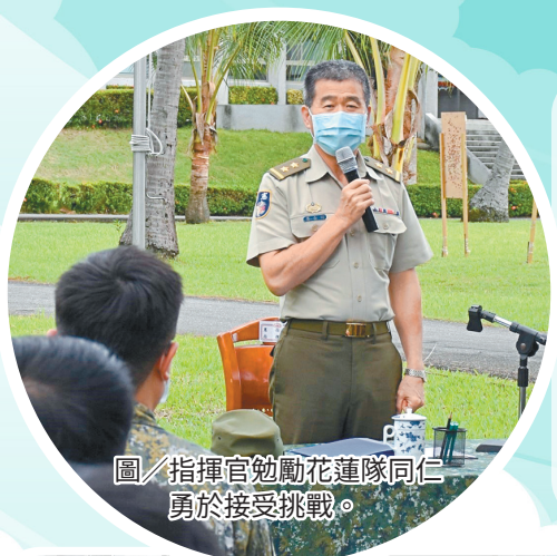
圖／指揮官勉勵花蓮隊同仁勇於接受挑戰。

最後，指揮官期勉所屬官兵均能勇於接受挑戰，做好生涯規劃，把握交織歷練的機會，同時，妥善運用國軍提供的資源，從事終身學習，創造自我價值，塑造團結和諧的優質單位。