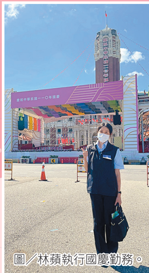
圖／林蘋執行國慶勤務。