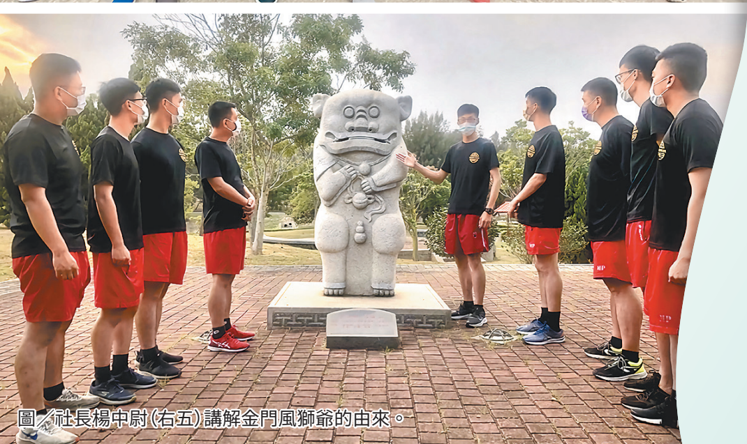
圖／社長楊中尉(右五)講解金門風獅爺的由來。