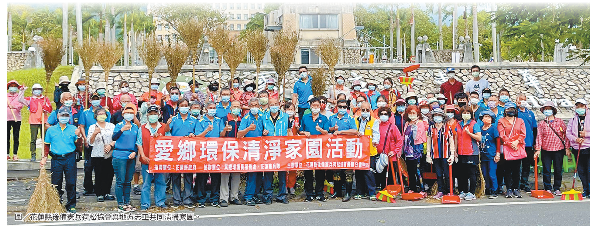
圖／花蓮縣後備憲兵荷松協會與地方志工共同清掃家園。

陳理事長表示，打掃家園、還給鄉里乾淨面貌，是跨出永續發展的第一步，透過發起活動，強化人們對環境保護的重視，為社會帶來「善」的循環，實踐「人人做公益、時時做公益、處處做公益」精神，傳承憲兵愛民助民的優良傳統。