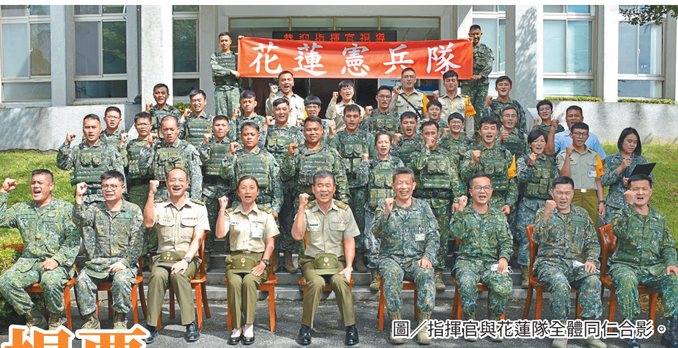
圖／指揮官與花蓮隊全體同仁合影。