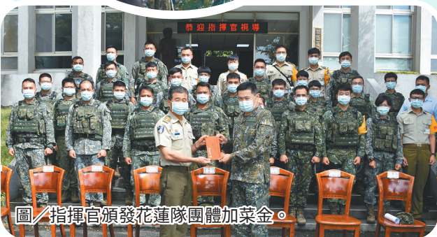
圖／指揮官頒發花蓮隊團體加菜金。