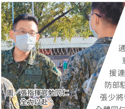
圖／張指揮官勉勵同仁全力以赴。