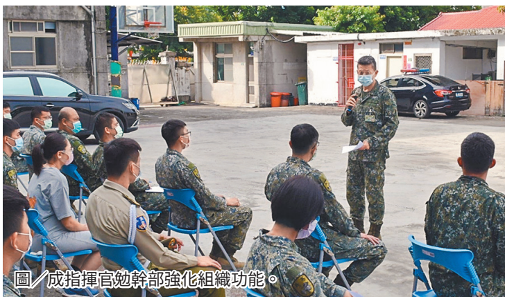
圖／成指揮官勉幹部強化組織功能。

此外，成指揮官提醒，近期日夜溫差較大，各級幹部應掌握熱食(水)供應是否滿足同仁需求，並注意勤務人員身體狀況，貫徹「一級輔導一級」，強化組織功能，建構堅不可摧的防衛戰力。