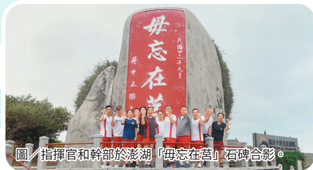
圖／指揮官和幹部於澎湖「毋忘在莒」石碑合影。