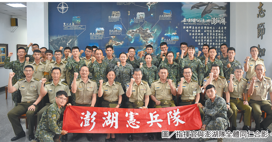
圖／指揮官與澎湖隊全體同仁合影。