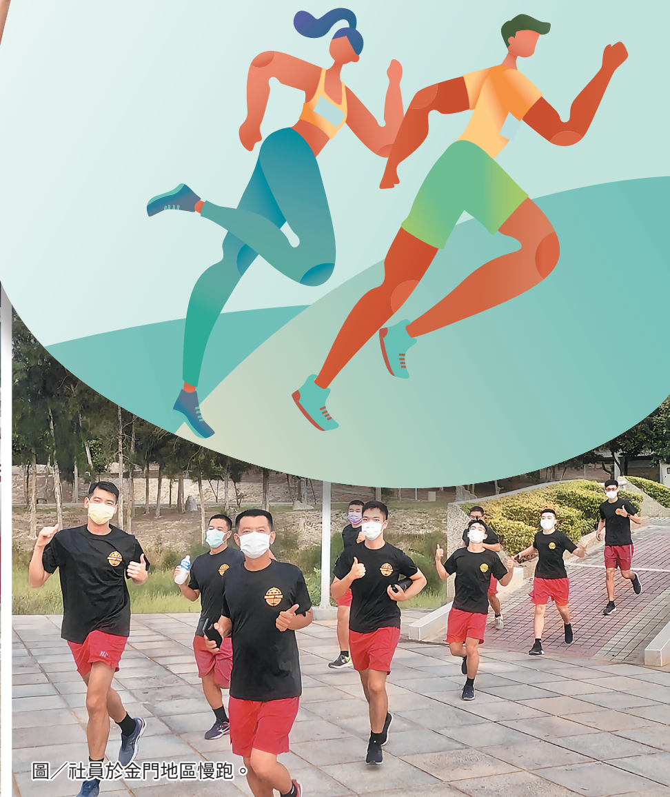
圖／社員於金門地區慢跑。