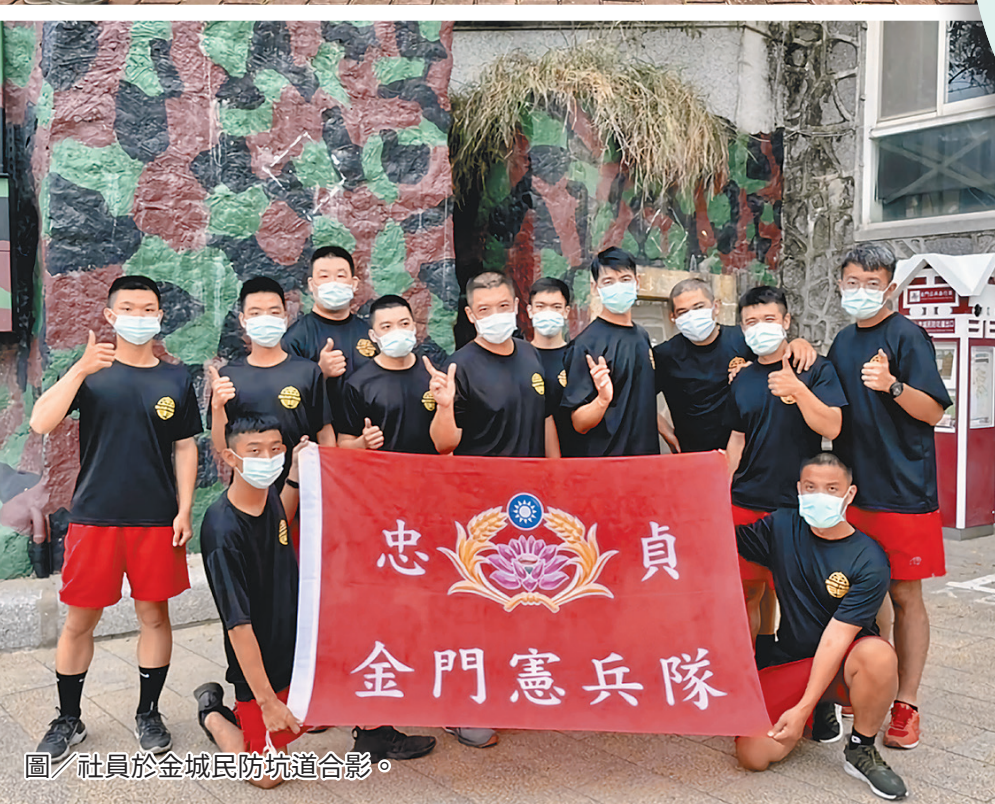
圖／社員於金城民防坑道合影。