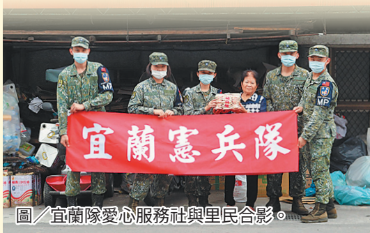
圖／宜蘭隊愛心服務社與里民合影。

進士里里長表示，宜蘭憲兵隊同仁的熱忱與關懷，深深感動了社區的長輩，感謝國軍的付出讓社會變得更美好。隊長徐中校則表示，長輩們的笑容是對同仁最大的肯定，國軍肩負保國衛民使命，期藉愛心服務社散播溫情、照亮社會，展現「軍愛民，民敬軍」之精神。