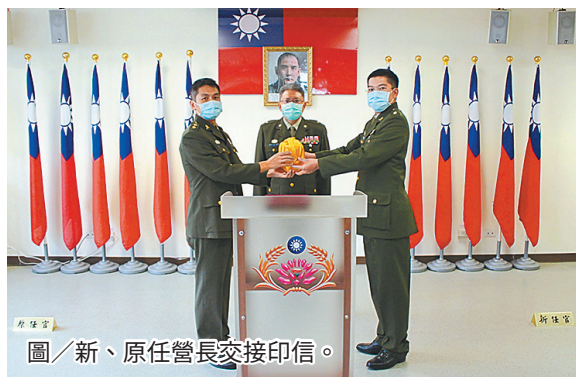
圖／新、原任營長交接印信。