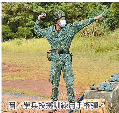
圖／學兵投擲訓練用手榴彈。