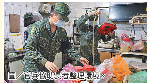
圖／官兵協助長者整理環境。

宜蘭憲兵隊愛心服務社日前配合宜蘭縣進士里參與社區關懷活動，協助長者整理環境、陪伴談心，展現憲兵熱心助民之精神。