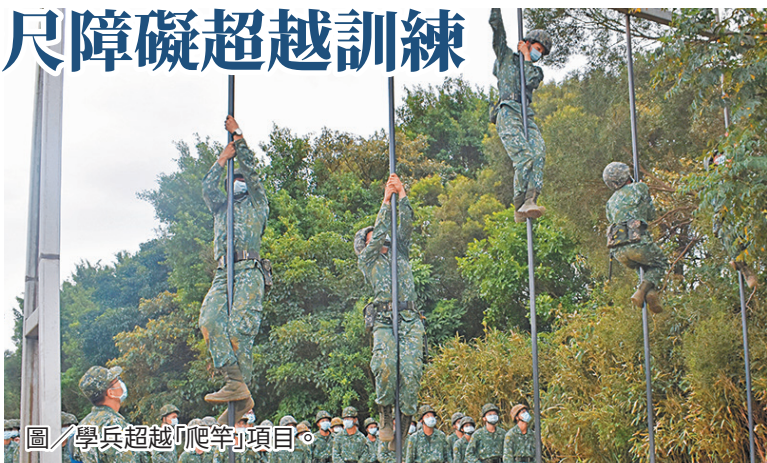
圖／學兵超越「爬竿」項目。

連士官長提醒，投擲手榴彈與五百公尺障礙超越的相同之處在於，並非僅靠「蠻力」，更應懂得技巧及身體的協調，以「爬竿」項目為例，若無法掌握運用小腿力量的技巧，僅依靠上肢臂力、手掌抓握的力量，通過的難度便大幅提升。