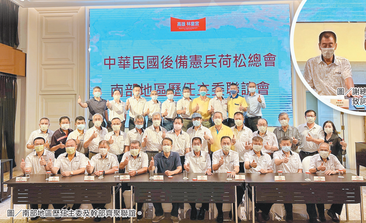
圖／南部地區歷任主委及幹部齊聚聯誼。