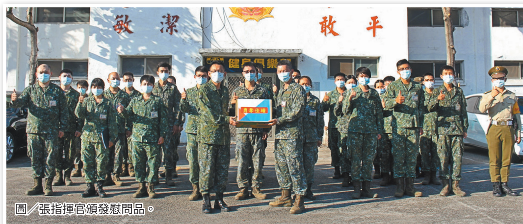
圖／張指揮官頒發慰問品。

張指揮官表示，平時的訓練是執行戰訓本務的基礎，在合理的要求下，無論是基本體能，或是幹部的本職學能，均應從嚴從難，以面對未來各項艱難挑戰。最後，全體官兵在連長的領導下，以高昂的戰志完成鑑測，奪得佳績。