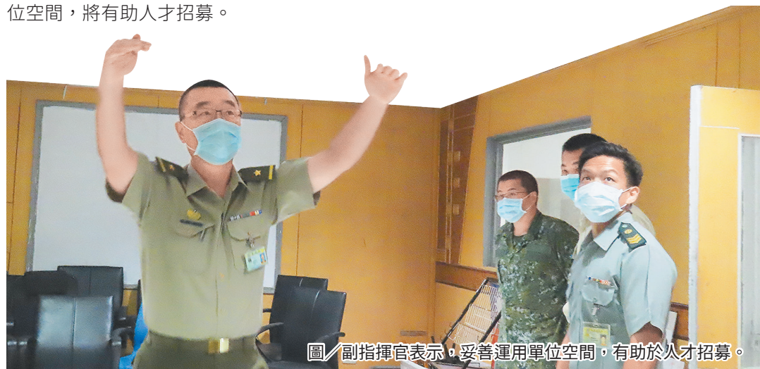
圖／副指揮官表示，妥善運用單位空間，有助於人才招募。

副指揮官強調，國軍每年需要大量優秀人才加入，除了透過多元的招募訊息與管道，提升資訊傳遞效能，更應結合單位特性及地理優勢，善用現有資源與空間提供考生便捷服務，避免因交通不便，舟車勞頓降低考生報考意願，流失優秀人才。