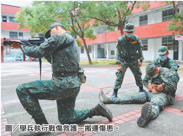
圖／學兵執行戰傷救護—搬運傷患。