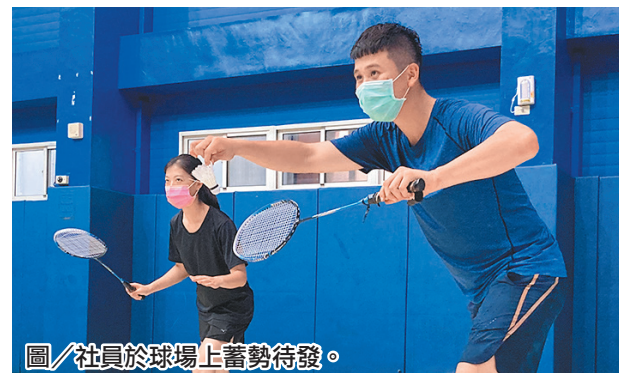
圖／社員於球場上蓄勢待發。