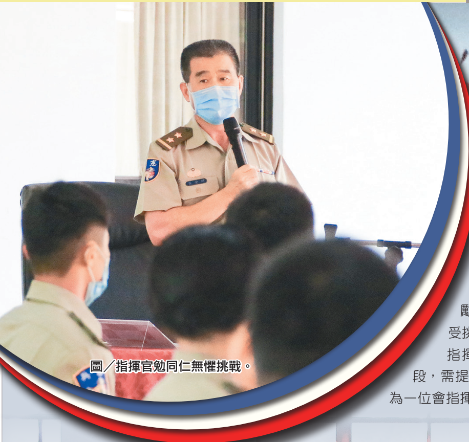
圖／指揮官勉同仁無懼挑戰。

發行人：辜麗都 組長：許紋豪 出版：文宣心戰組 責任編輯：沈育豪 莊好嬋 張修銘 李蕙宇 資鳳英 詹淑君