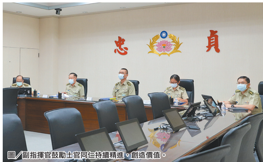
圖 / 副指揮官鼓勵士官同仁持續精進，創造價值。

副指揮官表示，士官督導長為部隊靈魂人物之一，亦為士官兵之表率，凡事以身作則，其個人品德、體能狀況都要在水準之上；本次評選自各單位由下而上、逐級薦報績優士官參選，期勉士官幹部都能持續精進，創造個人價值，發揚憲兵梅荷志節。