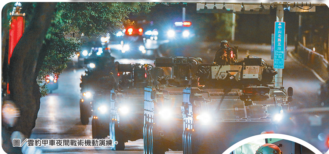
圖／雲豹甲車夜間戰術機動演練。