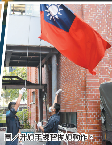
圖／升旗手練習拋旗動作。