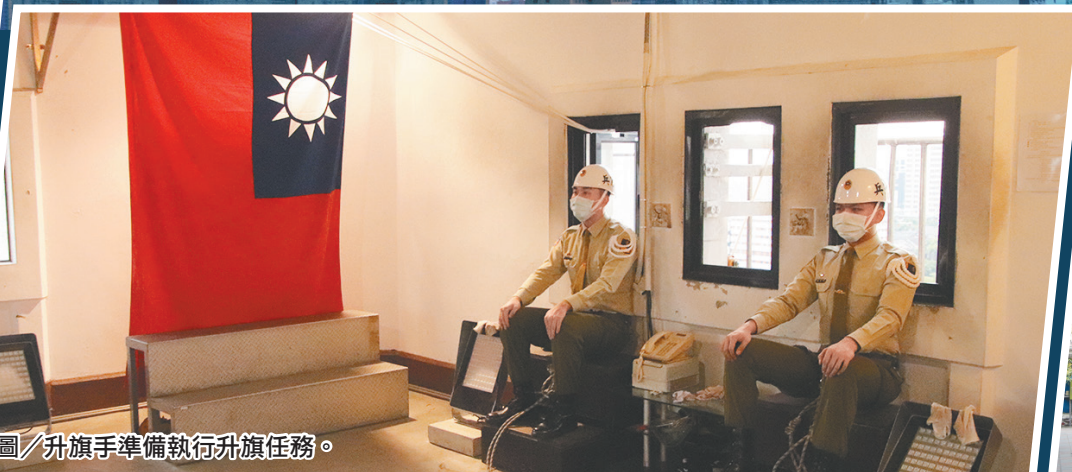
圖／升旗手準備執行升旗任務。