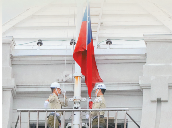
圖／升旗手執行升旗任務。(照片為疫情警戒前拍攝)

「國旗」是國家的標誌，更象徵一個國家的立國精神，我國總統府每日冉冉升起的國旗，代表國家新的一天開始，特別是元旦、國慶升旗任務，更是代表一個國家新的一年開始或者慶祝國家生日，而總統府升旗任務即是由具有優良傳統歷史的憲兵第 211 營擔任。