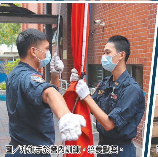
圖／升旗手於營內訓練，培養默契。