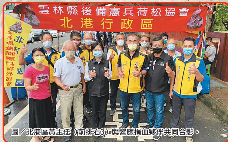
圖／北港區黃主任（前排右3）與響應捐血夥伴共同合影。