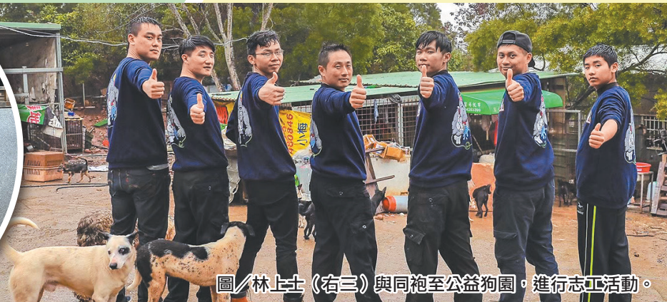
圖／林上士（右三）與同袍至公益狗園，進行志工活動。