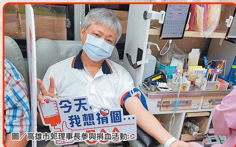
圖／高雄市郭理事長參與捐血活動。