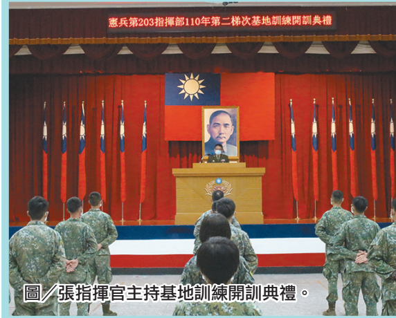
圖／張指揮官主持基地訓練開訓典禮。

張指揮官強調，基地訓練是為了提升及驗證官兵本職學能及體能的重要階段，唯有強化各項訓練，才能培養出團隊合作、訓練有素的優質勁旅，期勉參訓同仁在基訓期間能將平常的訓練成果學以致用，並於結訓歸建後持恆投入戰訓本務工作，延續訓練成效，提升部隊戰力。