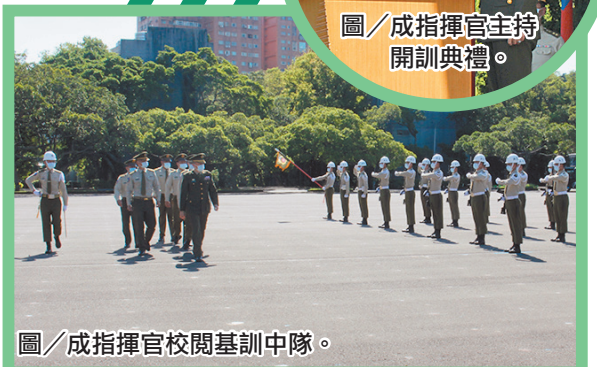
圖／成指揮官校閱基訓中隊。