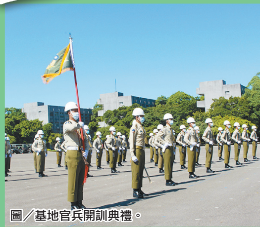
圖／基地官兵開訓典禮。

開訓典禮中，同仁身著甲種服裝，以嚴整部隊展現高昂士氣。成指揮官表示各項訓練須恪遵程序、步驟、要領執行，唯有建立「安全」訓練觀念才能維護部隊戰力，同時精進本職學能及強化個人戰技，期許每位官兵都能順利完成訓練並創造難忘軍旅回憶。