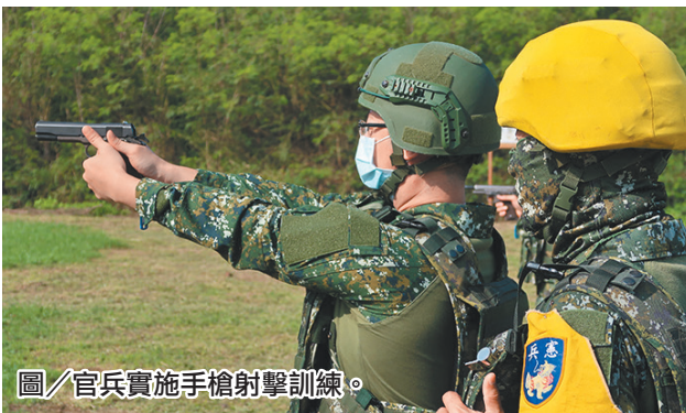
圖／官兵實施手槍射擊訓練。