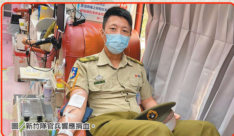
圖／新竹隊官兵響應捐血。