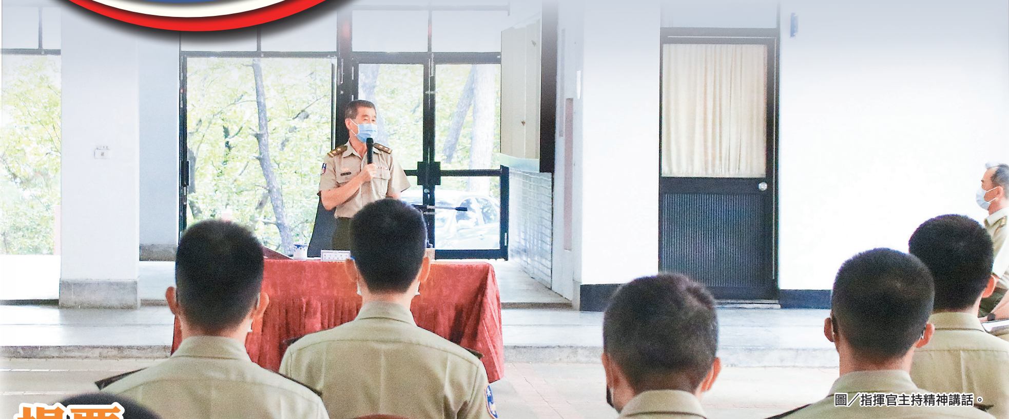
圖／指揮官主持精神講話。

最後，指揮官強調，軍士官幹部為部隊的領導者，帶領官兵執行各項任務，不見得會得到功勞，但經驗和實力，學到了就是自己的，勉勵保持熱情與服務精神，無懼面對未來各項任務與挑戰，率單位官兵勇往直前、戮力以赴。