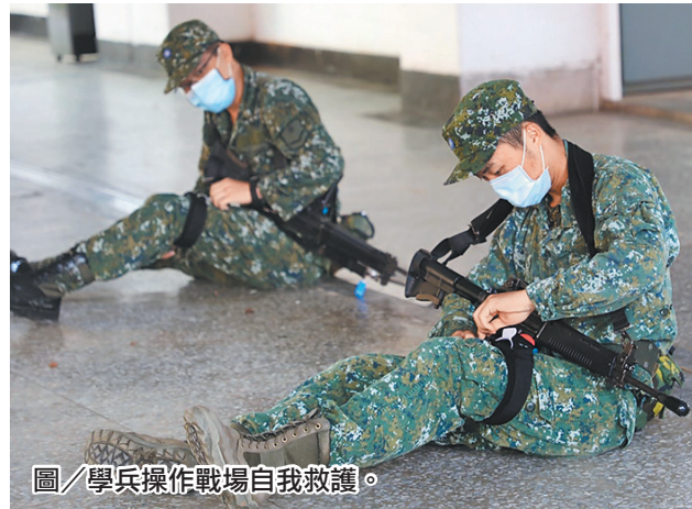
圖／學兵操作戰場自我救護。

本次課程置重點於戰傷救護應處作為及移動方式等基礎戰術動作，同時講授如何進行切角偵查敵方位置等專業戰技，教官表示，城鎮戰鬥為憲兵戍守都會區域之關鍵戰技，唯有具備扎實基礎才有應變的能力，期許學員謹記所學，持恆訓練並靈活運用，厚植憲兵城鎮作戰職能。