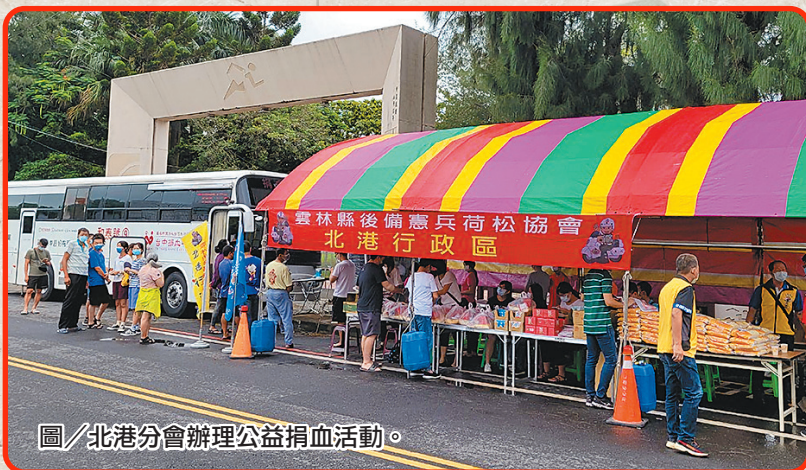
圖／北港分會辦理公益捐血活動。