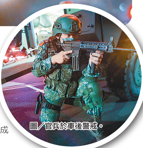
圖／官兵於車後警戒。

指揮官于少將表示，實兵演練的目的，在於驗證部隊作戰能量，以符合作戰需求及戰場景況，提升整體戰力防護成效，展現捍衛國家安全的決心。