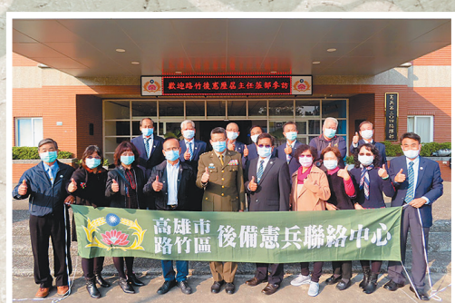
圖／高雄市後備憲兵荷松協會路竹分會參訪鐵衛營區。