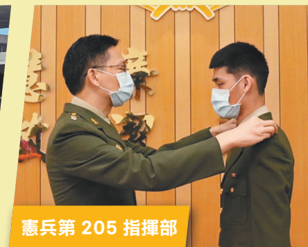
憲兵第 205 指揮部