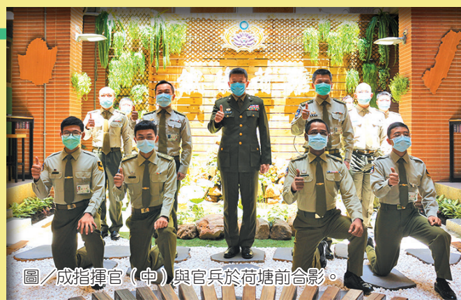
圖／成指揮官（中）與官兵於荷塘前合影。