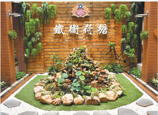
圖／鐵衛荷塘造景落成。