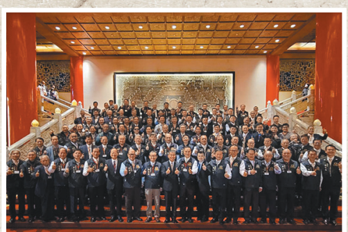
圖／中華民國後備憲兵荷松總會第八屆第二次會員大會。