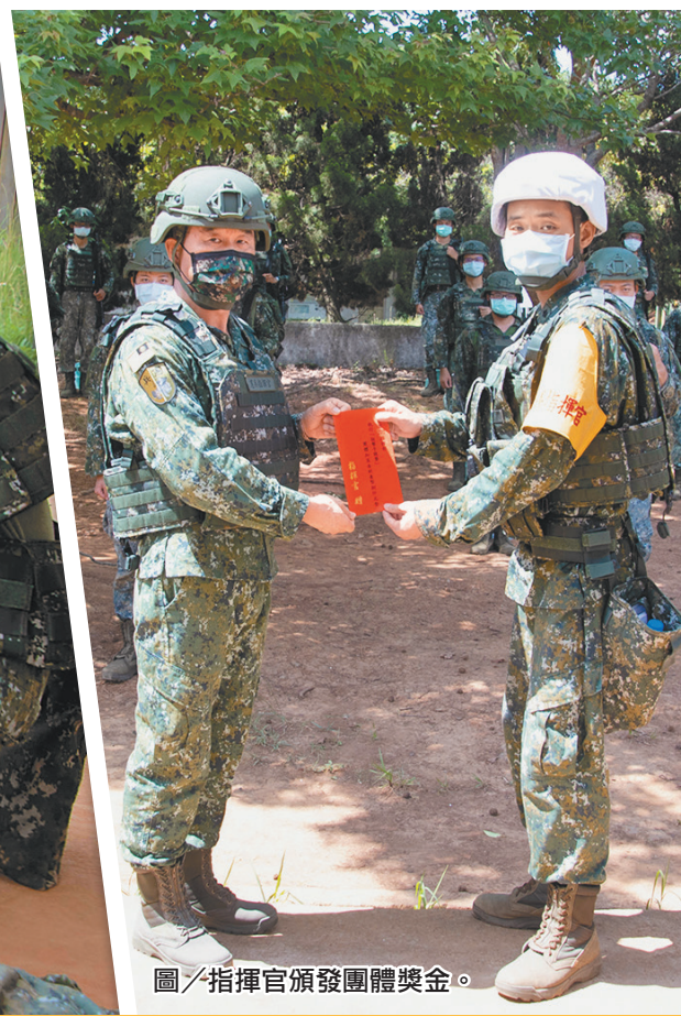
圖／指揮官頒發團體獎金。