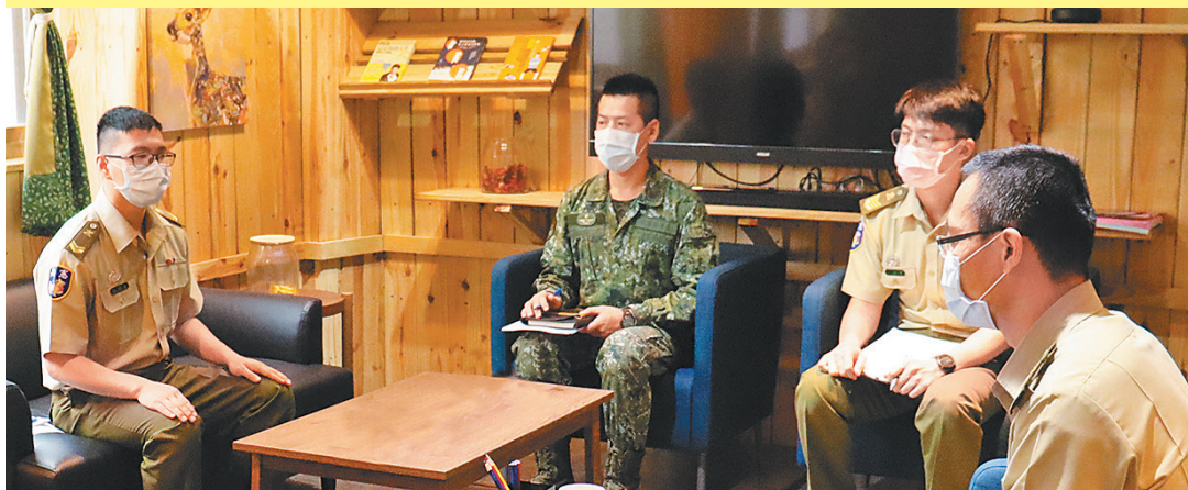
憲兵第 205 指揮部