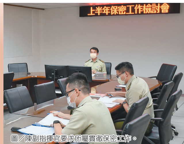
圖／陳副指揮官要求所屬貫徹保密工作。

施宣教，另研討文書處理、通資設備等保密工作執行實務，提醒各單位貫徹執行 MDM 管制軟體查驗等工作，期勉各級幹部持恆精進保密工作，同時落實宣導教育，培養官兵正確保密習性，防杜洩違密肇生。