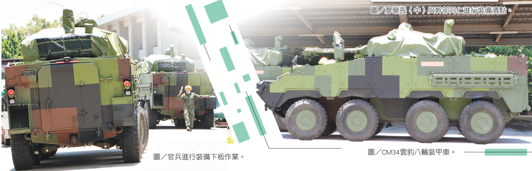
圖／官兵進行裝備下板作業。