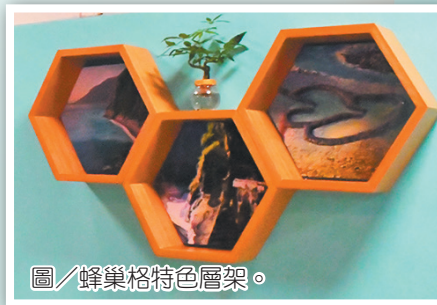
圖／蜂巢格特色層架。