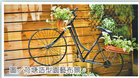
圖／荷塘造型園藝布景。