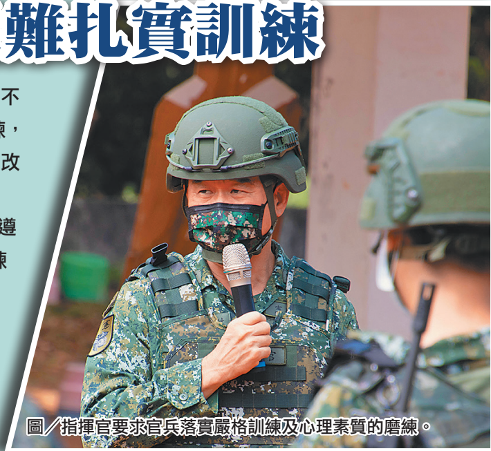
圖／指揮官要求官兵落實嚴格訓練及心理素質的磨練。

最後，指揮官叮嚀集訓同仁，在訓場除恪遵靶場紀律，遵從射擊指揮官命令以確保訓練安全，尤其近期天候炎熱，訓練過程中應注意水份補充，嚴防熱傷害情事肇生，並以「安全」為首要，落實各項訓練防險作為，確保部隊整體戰力。