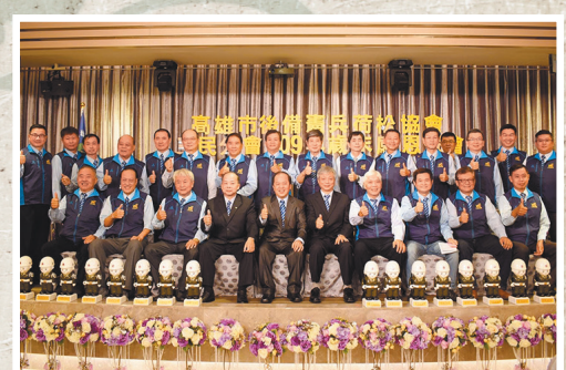
圖／高雄市後備憲兵荷松協會三民分會109年年終歲末感恩餐會同仁合影。