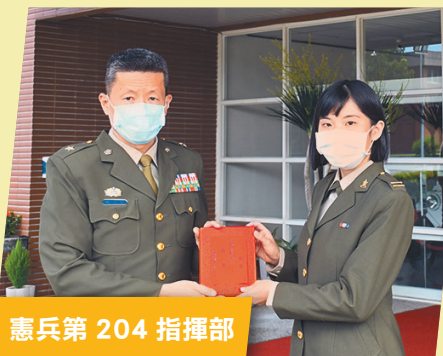
憲兵第 204 指揮部