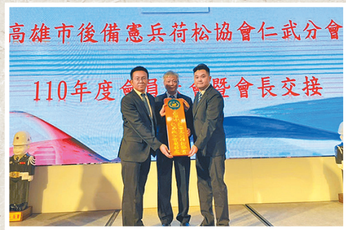
圖／高雄市後備憲兵荷松協會仁武分會會員大會。