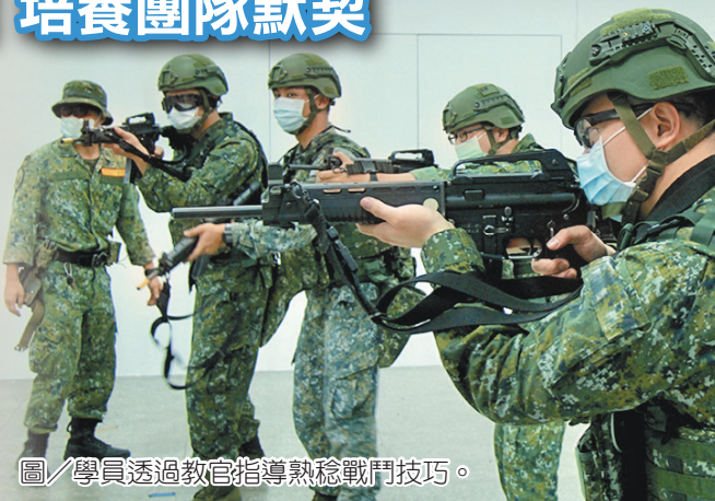
圖／學員透過教官指導熟稔戰鬥技巧。

過程中，設置運用不同組合空間及狀況，來模擬城鎮戰中各種威脅，並透過小組對抗強化臨戰訓練，培養團隊默契及小組溝通效能，使學員藉由持續的練習，增進突發狀況處置能力，厚植憲兵城鎮作戰能量。