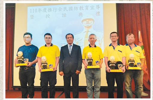
圖／高雄市後備憲兵荷松協會左營分會授證典禮。