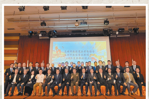
圖／高雄市後憲荷松協會第110年後備憲兵聯絡中心幹部授證大會。