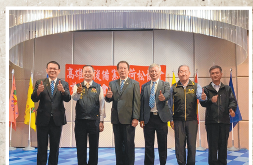
圖／高雄市後備憲兵荷松協會前鎮區幹部授證典禮。