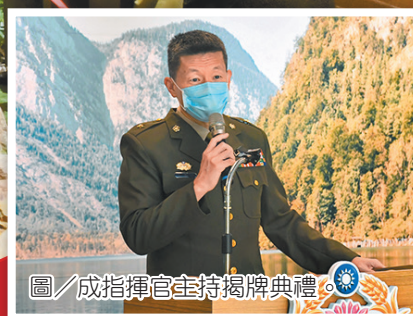
圖／成指揮官主持揭牌典禮。

在粉藍色的牆上，可看見數個六邊形的蜂巢格，格內還有許多名勝景點，此區塊為官兵獨特的創意發想，運用象徵「團結、堅固」的蜂巢六角形設計，為牆面加上造型層架，並在格子內呈現 204 指揮部所屬各駐地的著名景點，如高雄的紅毛港、臺東的三仙台以及澎湖的雙心石滬等，使官兵在鐵衛荷塘談心閒暇之時，也能感受各地區風景名勝，更能妥善規劃假日與親友休閒娛樂的旅遊行程，促進人際互動情誼，也能探索各地的美好風景。