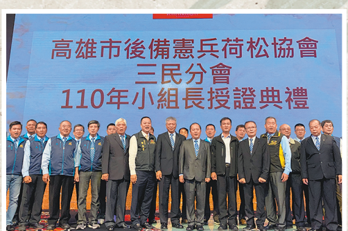
圖／高雄市後備憲兵荷松協會三民分區授證典禮。