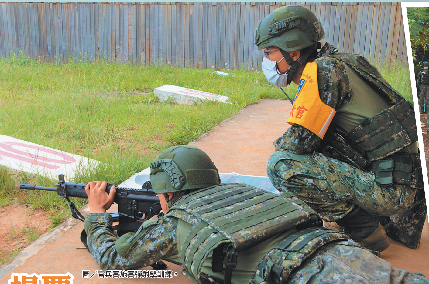
圖／官兵實施實彈射擊訓練。