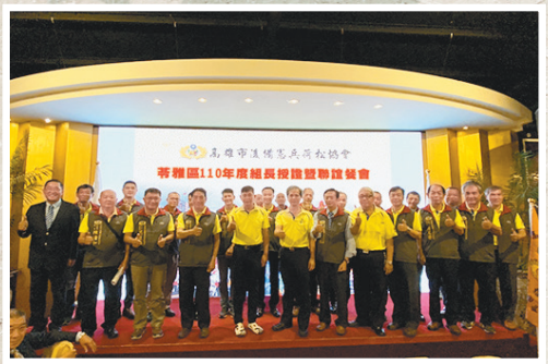
圖／高雄市後備憲兵荷松協會苓雅分會授證典禮。