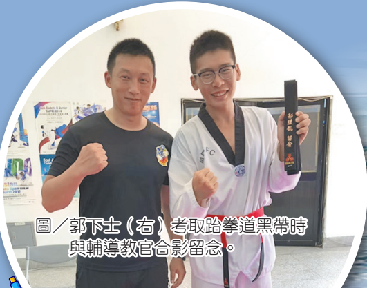
圖／郭下士(右)考取跆拳道黑帶時與輔導教官合影留念。