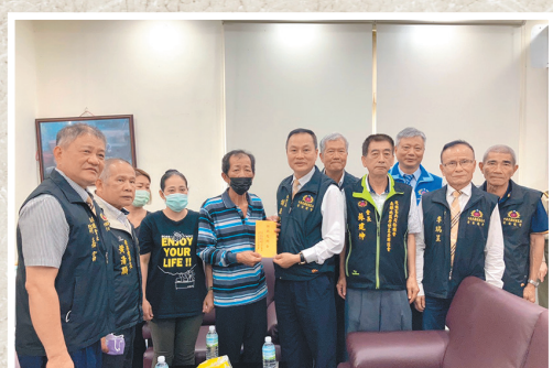
圖／中華民國後憲總會慰問臺鐵事故家屬。