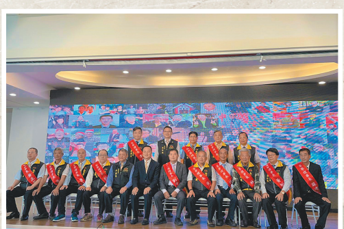
圖／臺南市後備憲兵荷松協會舉辦第10、11屆理事長交接暨幹部授證典禮。