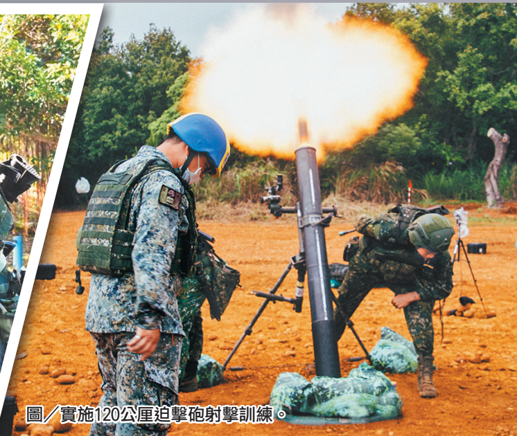
圖／實施120公厘迫擊砲射擊訓練。