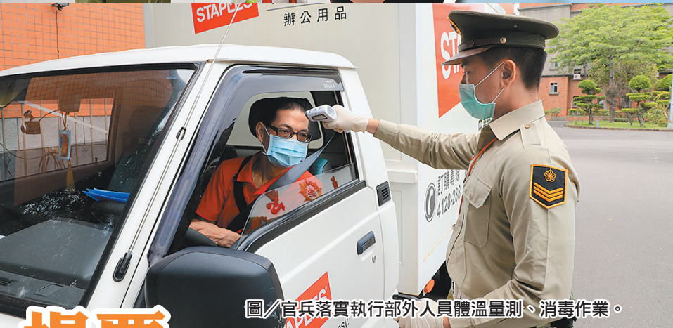
圖／官兵落實執行部外人員體溫量測、消毒作業。