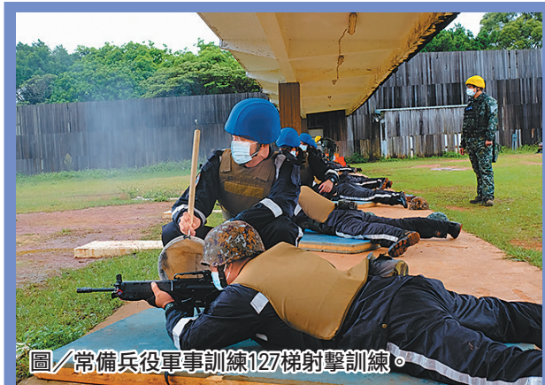
圖／常備兵役軍事訓練 127 梯射擊訓練。