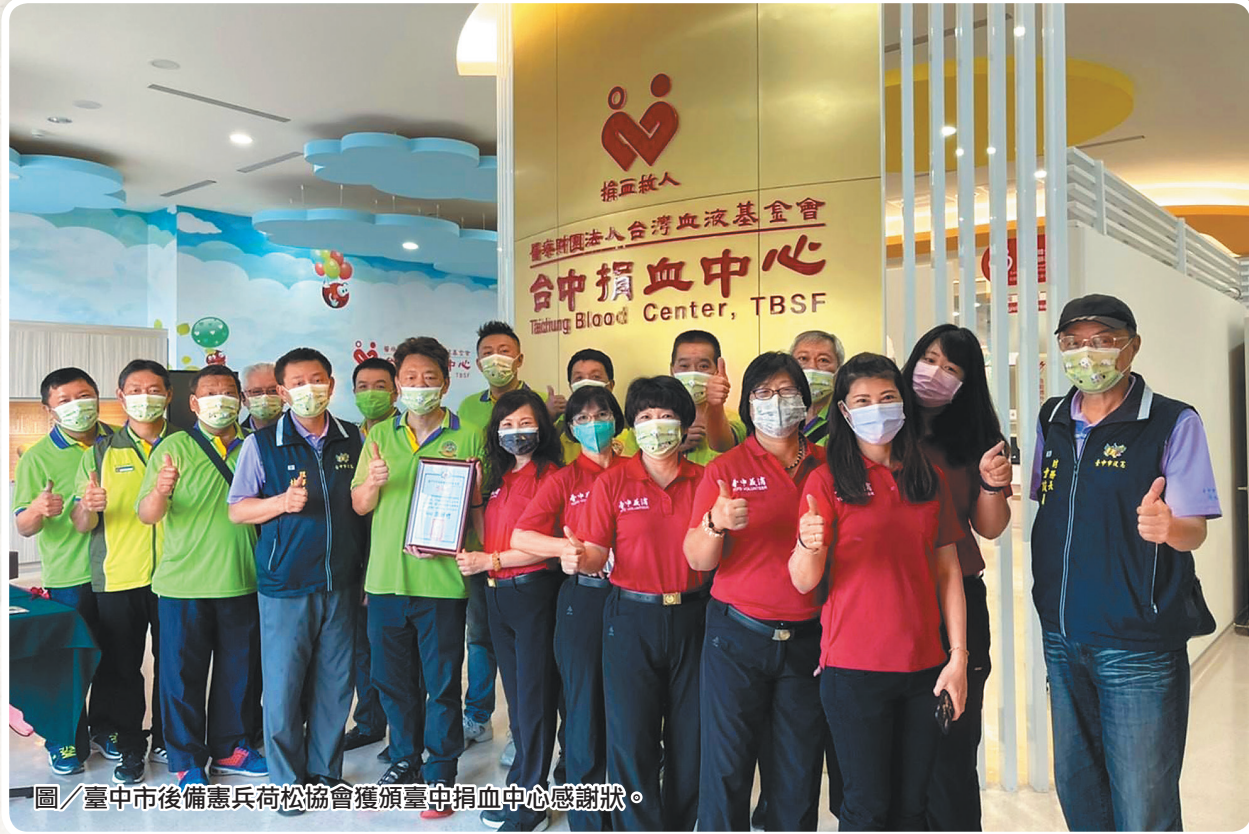
圖／臺中市後備憲兵荷松協會獲頒臺中捐血中心感謝狀。

林理事長表示，協會長期配合臺中捐血中心舉辦捐血公益活動，在去（109）年度捐血量高達 5,892 袋（294 萬 6 千 c.c.），榮獲臺中捐血中心頒贈「109 年度特殊貢獻台灣血液基金會感謝狀」，期許未來協會能持續召集後憲同仁投入捐血活動，集結後憲同袍的力量，為需要的人伸出援手，共同為社會盡一份心力。