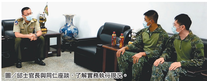
圖/邱士官長與同仁座談，了解實務執行現況。

邱士官長表示，士官幹部是人員管理之重要角色，必須具備高度敏感，見微知著地掌握官兵心緒，並善用組織建制反應網路，強化單位危機處理能力，掌握各項徵候，消弭風險；另近期疫情嚴峻，士官同仁應協助管制各項防疫措施，共同防杜疫情擴散，確保部隊戰力。