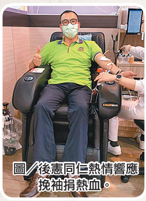
圖／後憲同仁熱情響應挽袖捐熱血。