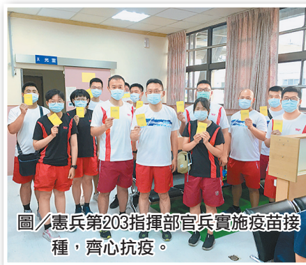
圖/憲兵第203指揮部官兵實施疫苗接種，齊心抗疫。

個人自主意願參加，並由醫官詳細說明相關資訊；另接種前對官兵量測體溫、血壓等健康評估，始實施疫苗接種作業，冀藉疫苗施打強化個人免疫，同時鼓勵同仁踴躍接種，齊心協力抵抗疫情，保有強健體魄，繼續守護國家安全。