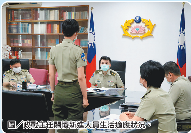
圖/政戰主任關懷新進人員生活適應狀況。