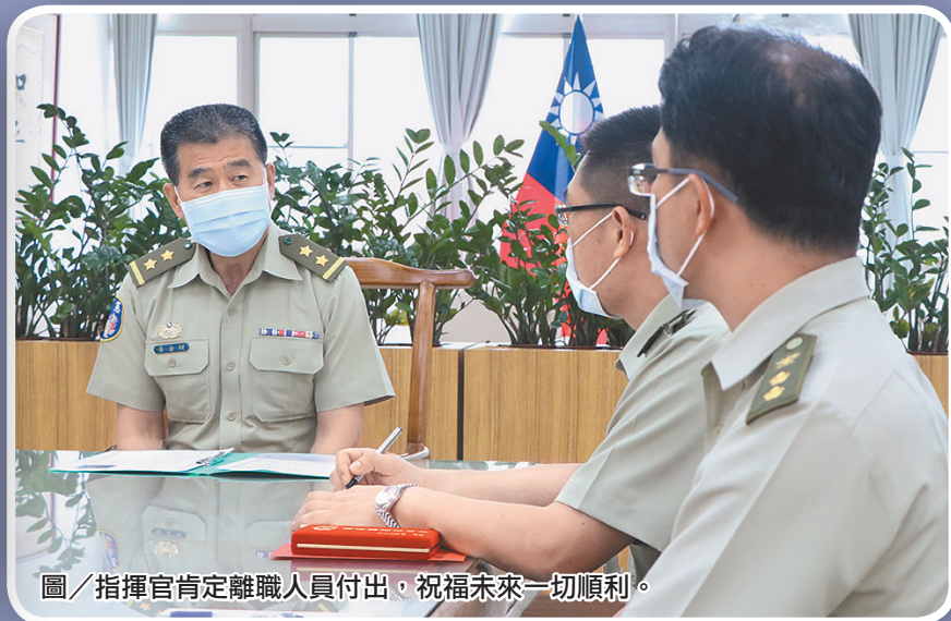
圖／指揮官肯定離職人員付出，祝福未來一切順利。