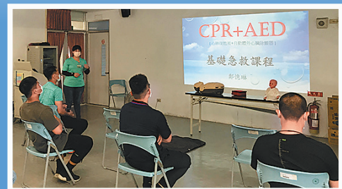
圖／臺東憲兵隊辦理士官職能講習，至臺東衛生所學習急救技能。

鄭講師除了說明急救實務操作要領，更透過各式狀況演練，讓官兵實際操作，熟悉各環節之步驟要領，並於課後實施合格簽證，期藉本次課程強化官兵急救基本知識，即刻應援緊急情況，降低人員損失風險。