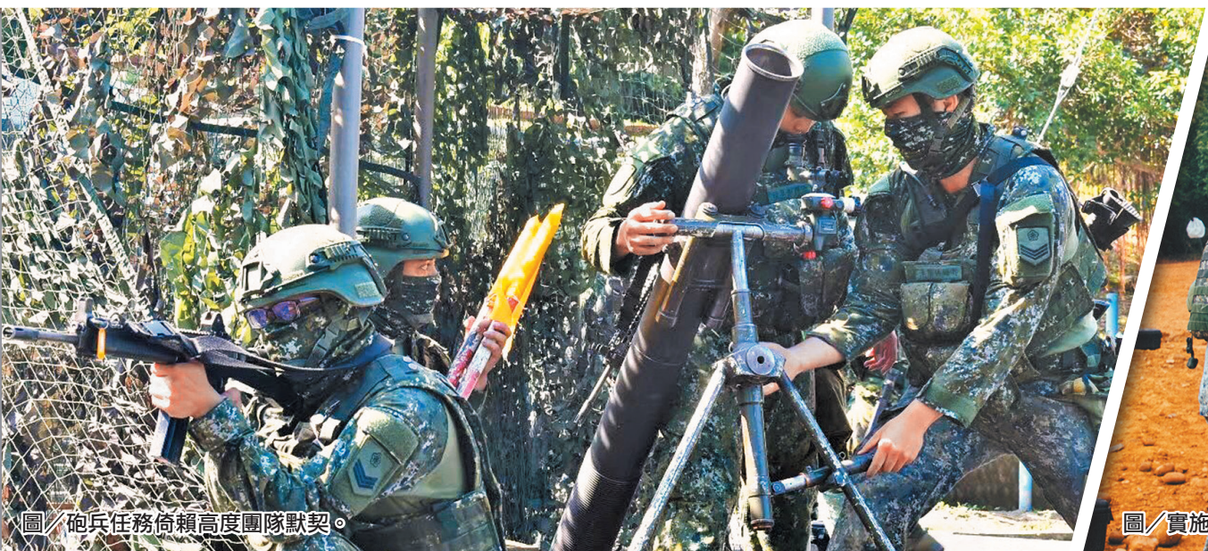
圖／砲兵任務倚賴高度團隊默契。

全體官兵秉持從嚴、從難的精神，每日全體官兵戮力戰備訓練，依照上級想定進行應變，落實各項任務訓練及戰備整備操演，期透過持恆訓練，將建制武器性能發揮極致，成為衛戍作戰中最堅強的火力屏障，達成保家衛國的使命。