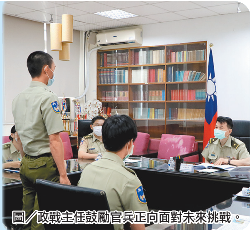
圖/政戰主任鼓勵官兵正向面對未來挑戰。

余主任首先肯定官兵投入軍旅，勇於接受磨練，並以「人因夢想而偉大，夢想因努力而實現」勉勵新進人員，應設定明確目標，並善用軍中資源，朝夢想邁進，創造自我價值；同時提醒官兵，生活中如遇問題需協助，可相互鼓勵或循體系向上反應，共同建立組織支持網路。