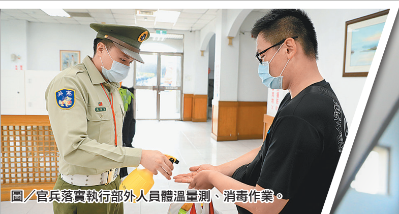
圖／官兵落實執行部外人員體溫量測、消毒作業。