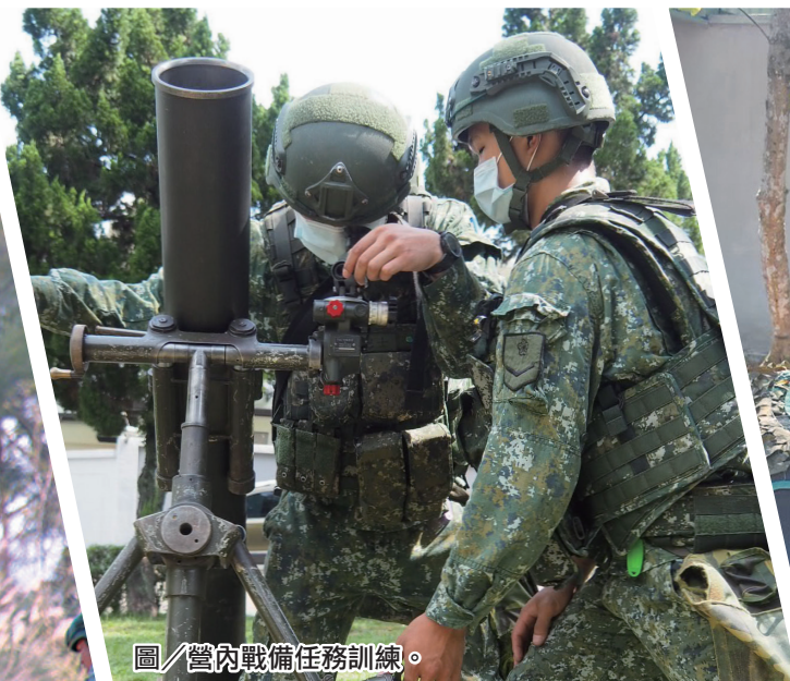
圖／營內戰備任務訓練。