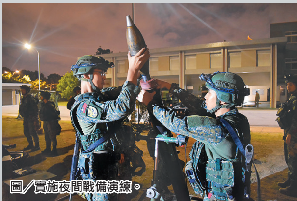
圖／實施夜間戰備演練。