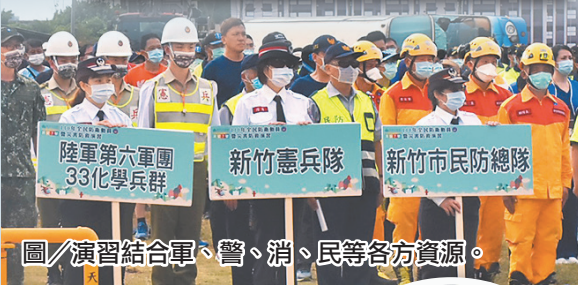
圖／演習結合軍、警、消、民等各方資源。