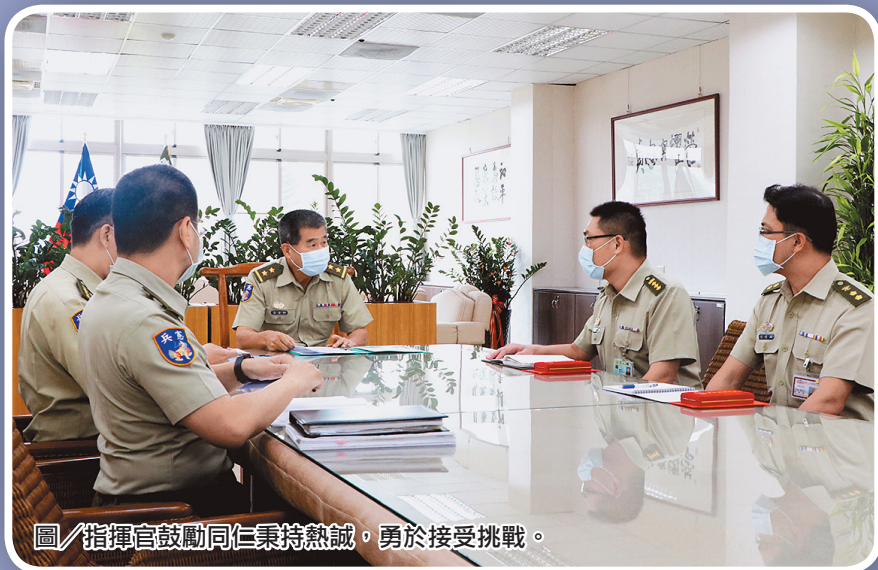
圖／指揮官鼓勵同仁秉持熱誠，勇於接受挑戰。