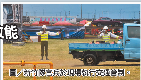
圖／新竹隊官兵於現場執行交通管制。

古隊長表示，本次演練整合軍事與民間力量，不僅驗證部隊平時戰訓成果，亦可培養官兵養成「居安思危，有備無患」的意識，提升防災意識及災害防救效率，共同守護國人生命財產安全。