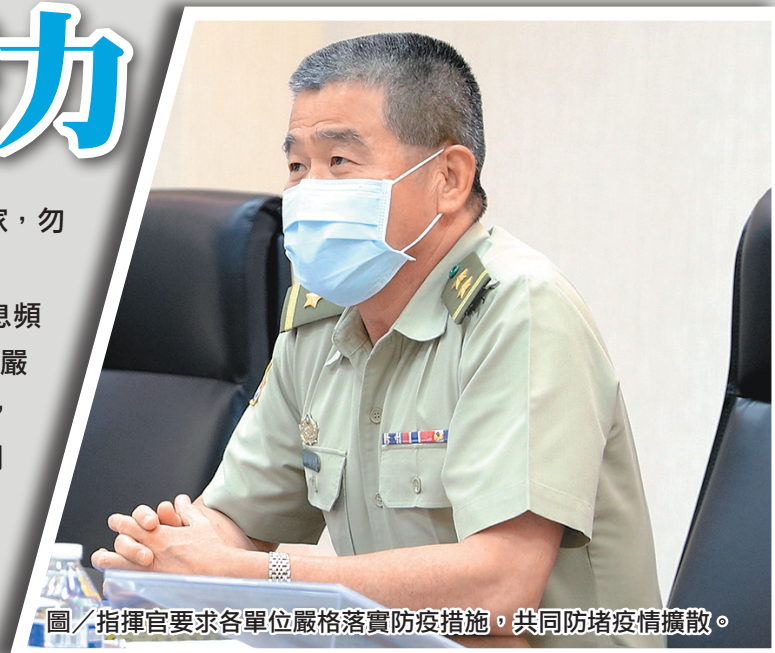
圖／指揮官要求各單位嚴格落實防疫措施，共同防堵疫情擴散。

指揮官強調，鑒於近期疫情假訊息頻傳，各級應針對法治教育加強宣達，嚴禁官兵散播及傳遞未經證實之訊息，以免觸法；最後，指揮官提醒全體同仁，各級主官應全面掌握所屬官兵身體狀況，如有身體不適、疫調活動重疊或與確診案例密切接觸者，應立即處置，以防止疫情擴散。