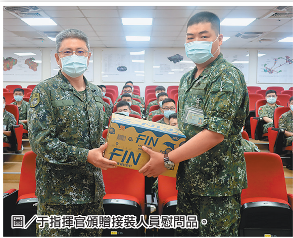
圖/于指揮官頒贈接裝人員慰問品。

于指揮官表示雲豹八輪甲車於撥交部隊前，軍備局第 209 廠均會針對接裝人員進行相關訓練，使其熟悉各項裝備操作技能，勗勉訓員能持續發揮所學，將受訓經驗與學習心得運用於部隊實務，共同提升部隊戰力。