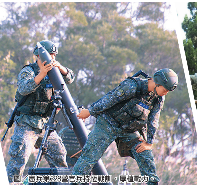
圖／憲兵第228營官兵持恆戰訓，厚植戰力。