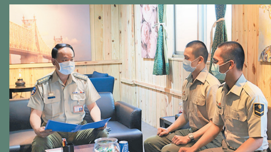
圖／文指揮官鼓勵新進人員精進自我，接受挑戰。