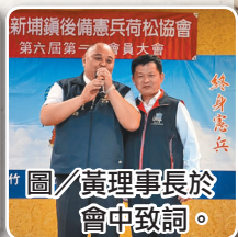
圖/黃理事長於會中致詞。