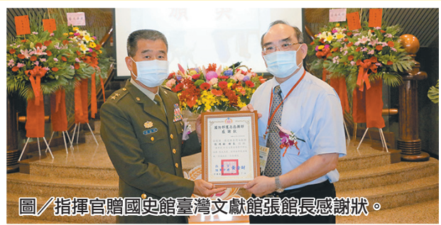
圖／指揮官贈國史館臺灣文獻館張館長感謝狀。