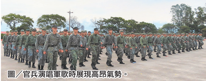
圖／官兵演唱軍歌時展現高昂氣勢。