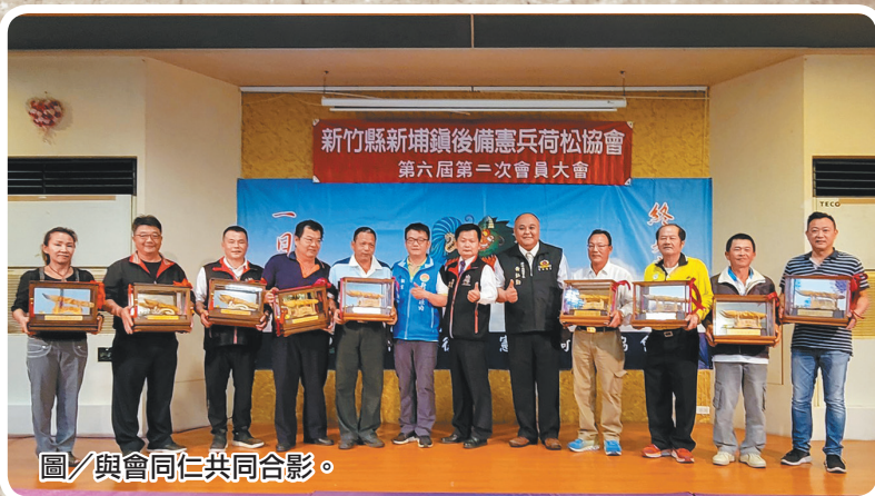
圖/與會同仁共同合影。