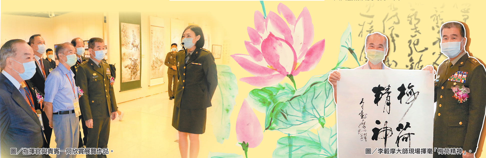
圖／指揮官與貴賓一同欣賞展覽作品。

本次巡迴展於國史館臺灣文獻館史蹟大樓二樓特展室展出，展期為 5 月 7 日至 6 月 11 日止，歡迎民眾踴躍前往參觀，一起了解國軍官兵允文允武與豐富人文藝術涵養的另一面。