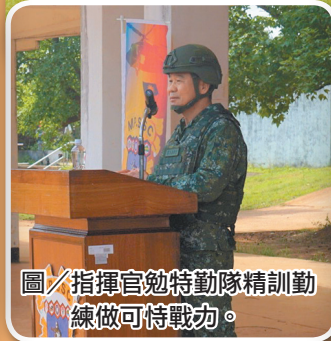
圖／指揮官勉特勤隊精訓練做可恃戰力。