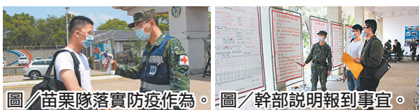
圖／苗栗隊落實防疫作為。

陳副指揮官首先肯定本次所有召員均依時完成報到，展現後備軍人「聞令報到，守法守紀」的高昂士氣；後續將透過專長技能複訓課程，提升作戰能量，厚植後備戰力；同時提醒各級幹部教召期間務必落實各項防疫、消毒作為，防杜新冠肺炎疫情，確保部隊整體戰力。