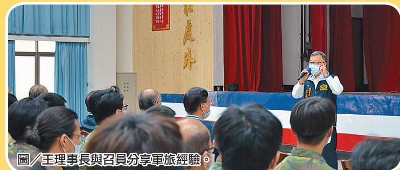
圖/王理事長與召員分享軍旅經驗。