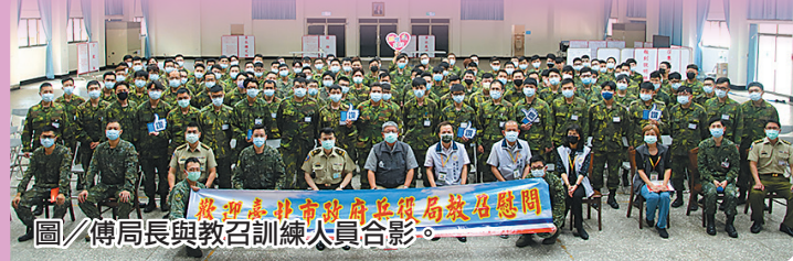
圖／傅局長與教召訓練人員合影。