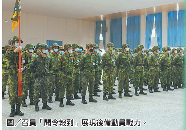
圖／召員「聞令報到」展現後備動員戰力。