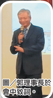
圖/郭理事長於會中致詞。

許區主任首先感謝左營區同仁長期的辛勞及付出，期望藉本次活動強化同仁情誼，增進團隊認同感，為地方盡力付出，也成為現役官兵的堅強後盾，共同守護家園。