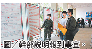
圖／幹部說明報到事宜。