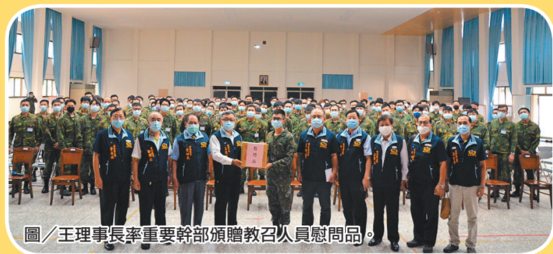
圖/王理事長率重要幹部頒贈教召人員慰問品。