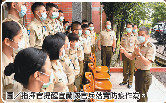
圖／指揮官提醒宜蘭隊官兵落實防疫作為。