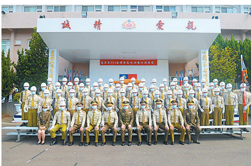
圖／成指揮官勉勵同仁持恆訓練 發揮訓練成果。

間勤訓精練之成果，同時表揚鑑測成績優異官兵，並表示完成基地訓練嚴格的訓練，方能打造勤訓精練的部隊，期勉官兵返回駐地後能持恆訓練，發揮訓練成果，強化部隊戰力。