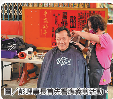
圖/彭理事長首先響應義剪活動。

到溫暖人情味，並與現役同仁一同以行動回饋地方，充分發揮憲兵「愛民助民」之忠貞精神。