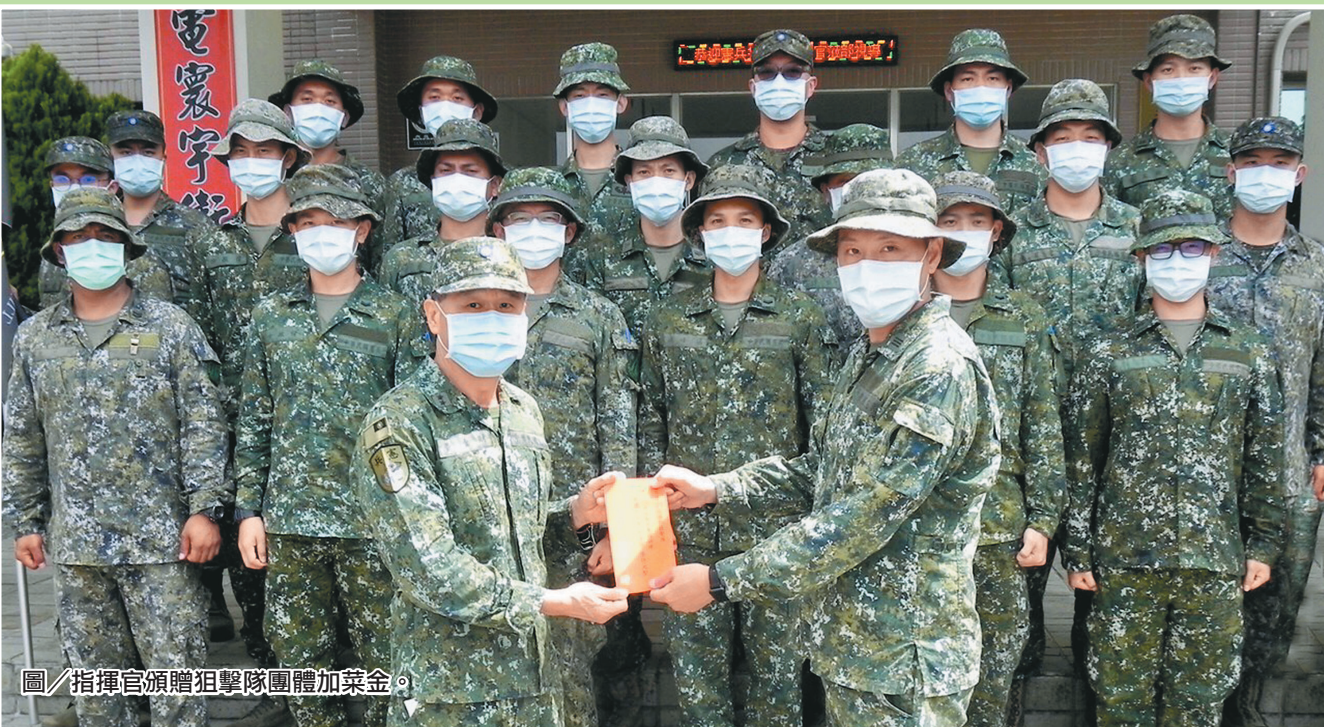
圖／指揮官頒贈狙擊隊團體加菜金。