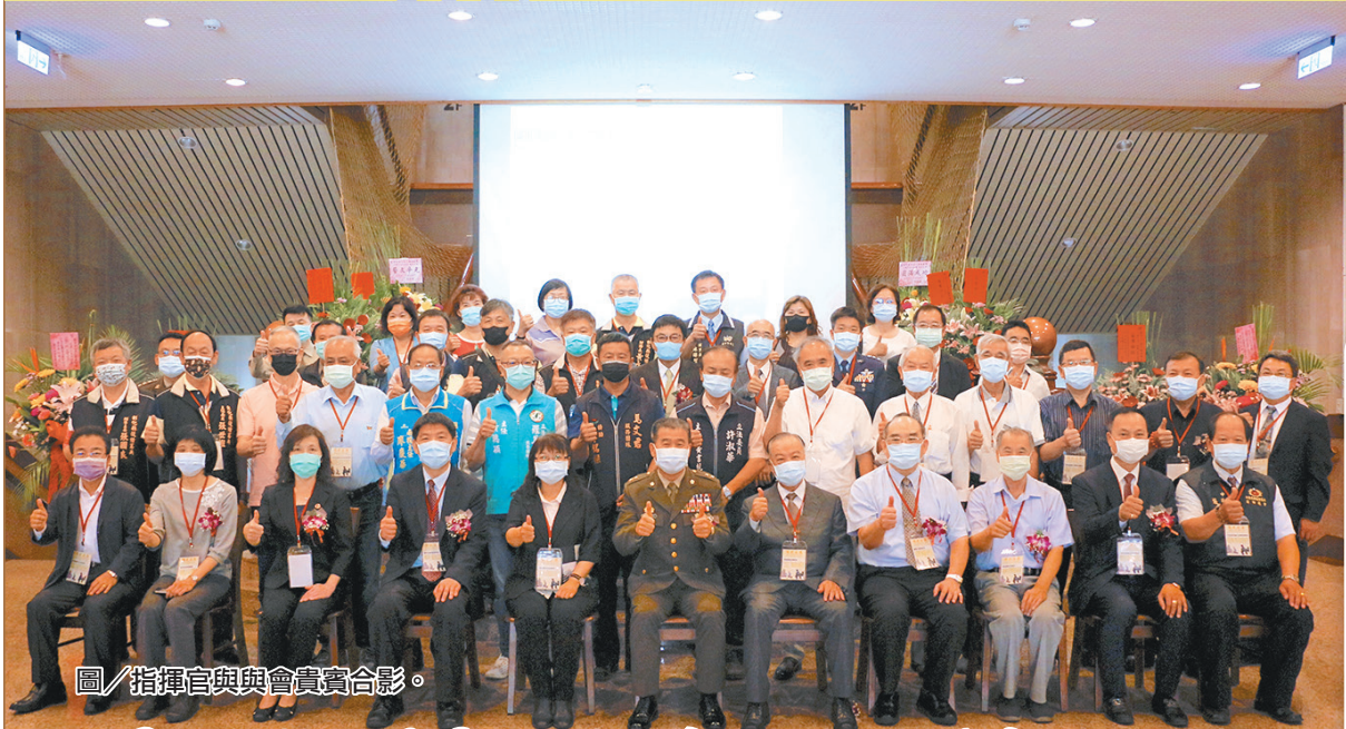
圖／指揮官與與會貴賓合影。