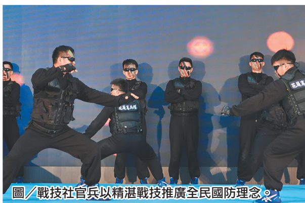
圖／戰技社官兵以精湛戰技推廣全民國防理念。