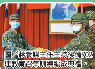
圖／蔣參謀主任主持後備702連教育召集訓練編成典禮。

蔣主任表示召員秉持「聞令報到」的自律精神，按時完成報到程序，同時期許全體召員透過教育訓練，成為「即時動員、即時作戰」的後備軍人，以利有效支援作戰需求。