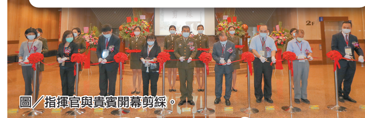
圖／指揮官與貴賓開幕剪綵。