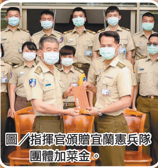
圖／指揮官頒贈宜蘭憲兵隊團體加菜金。