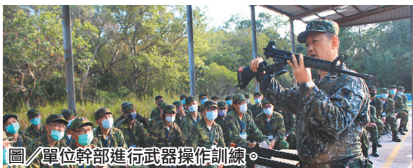
圖／單位幹部進行武器操作訓練。