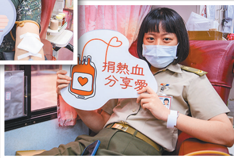
▶官兵捐熱血，為社會挹注正面能量。