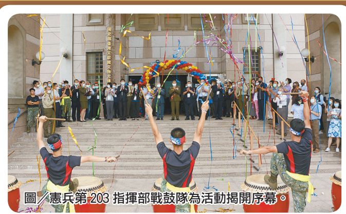
圖／憲兵第203 指揮部戰鼓隊為活動揭開序幕。