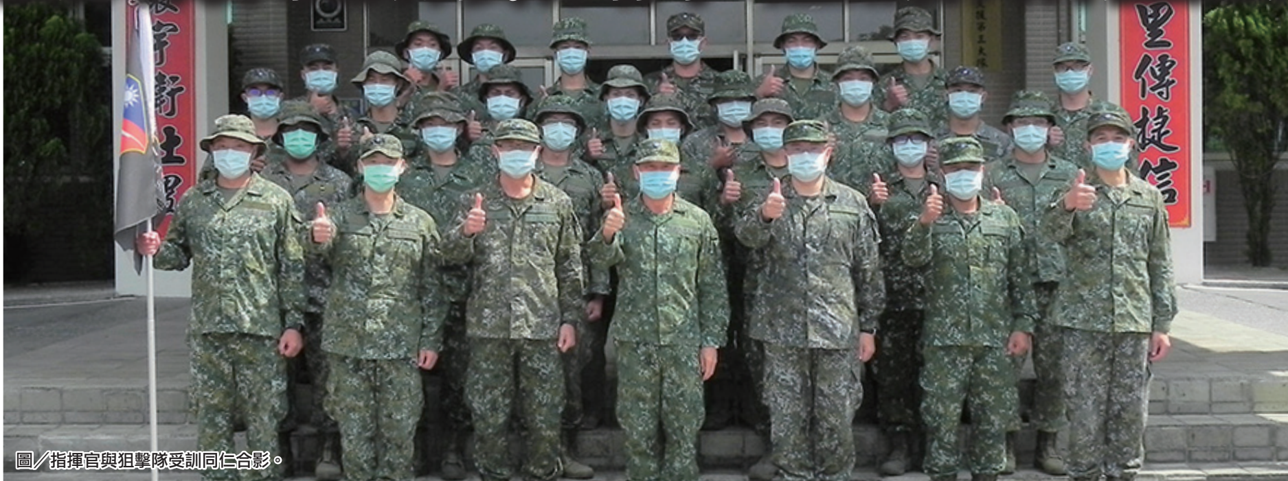
圖／指揮官與狙擊隊受訓同仁合影。