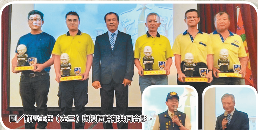
圖/許區主任(左三)與授證幹部共同合影。