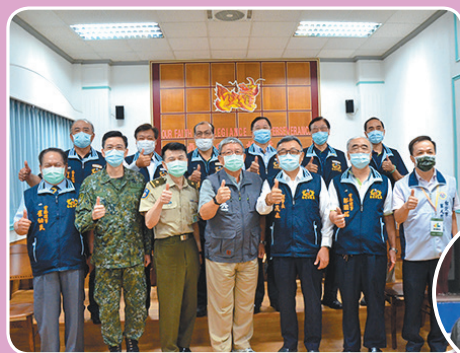
圖／傅局長與後憲幹部共同慰問教召訓員。

傅局長提醒疫情期間，時刻注意自身健康，落實防疫工作，維持部隊戰力；王理事長也頒贈慰問品並祝福後備袍澤在營訓練期間，能有充實豐富的收穫。