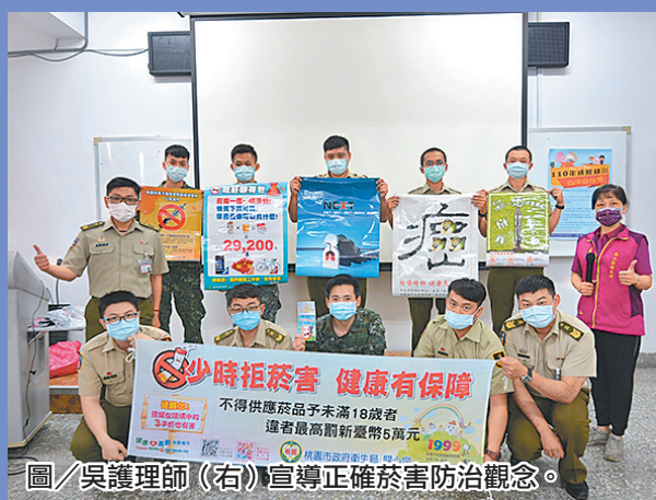
圖／吳護理師(右)宣導正確菸害防治觀念。