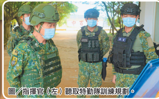
圖／指揮官（左）聽取特勤隊訓練規劃。