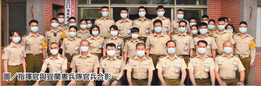
圖／指揮官與宜蘭憲兵隊官兵合影。