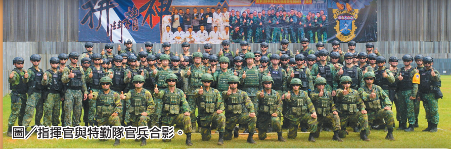
圖／指揮官與特勤隊官兵合影。