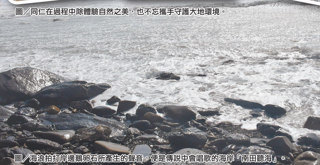
圖／海浪拍打岸邊鵝卵石所產生的聲音，便是傳說中會唱歌的海岸「南田聽海」。

「阿朗壹古道」是一條承載著臺灣東部發展歷史足跡的重要道路，其歷史源自清朝時期，而其名為當地達仁鄉安朔部落的舊稱，全長 8.4 公里，跨足屏東和臺東兩縣，負有人生必走的天然海岸古道盛名，除蘊含歷史人文風貌外，也曾作為軍事管制重地，使古道增添了神秘色彩。