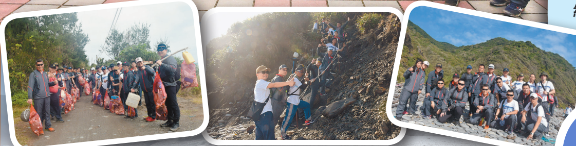
圖／同仁在過程中除體驗自然之美，也不忘攜手守護大地環境。