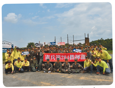
憲兵第 204 指揮部