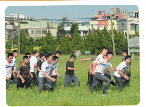
憲兵第 203 指揮部