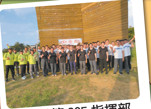
憲兵第 205 指揮部