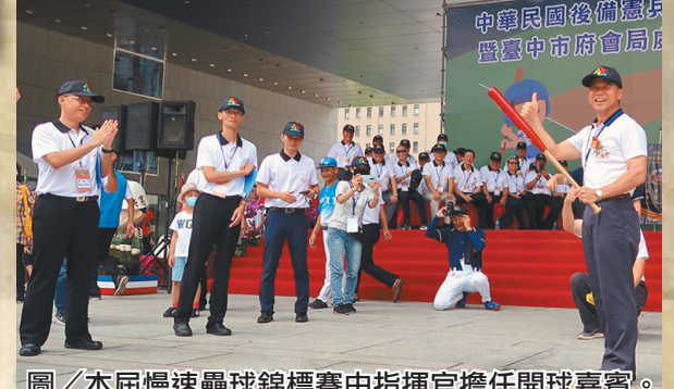
圖／本屆慢速壘球錦標賽由指揮官擔任開球嘉賓。