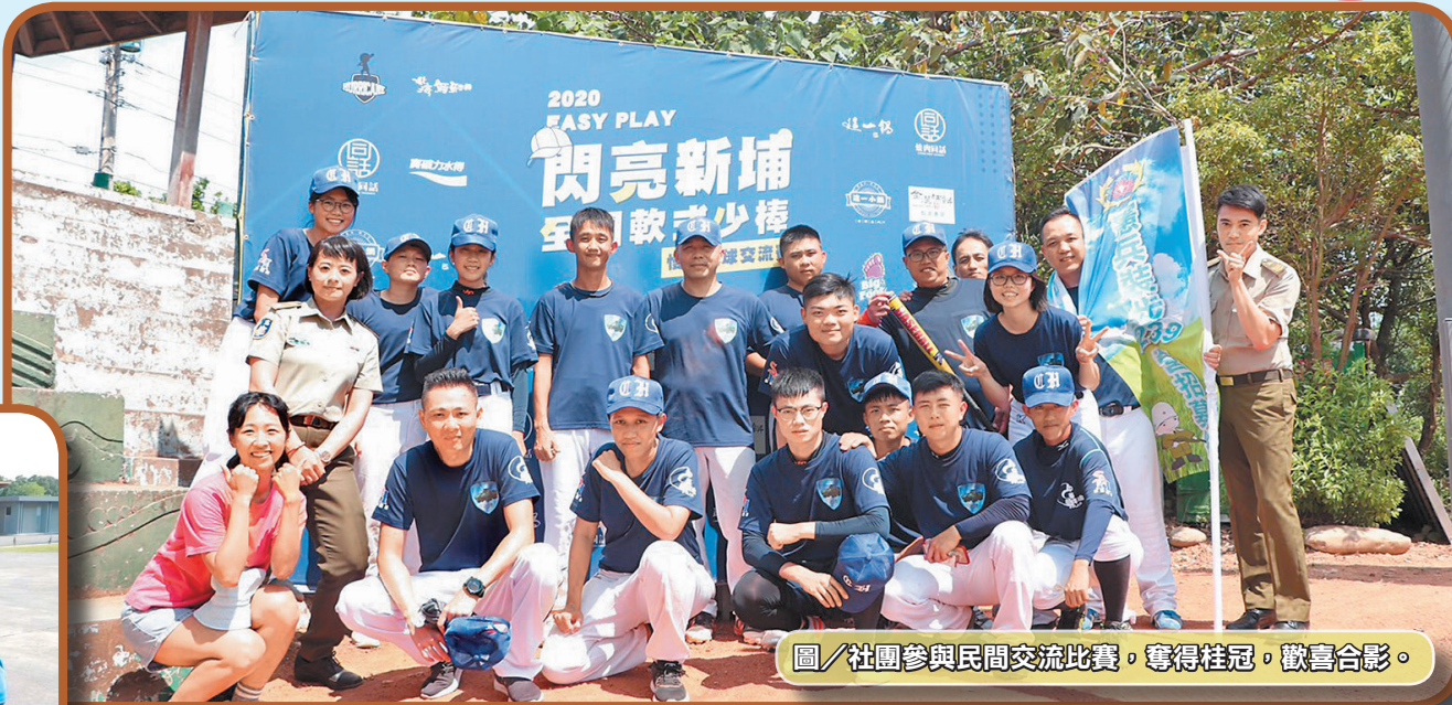
圖／社團參與民間交流比賽，奪得桂冠，歡喜合影。

【通訊員／黃蕙瑤】「全場屏息，打擊者銳利的眼睛看準時機，使勁揮棒！打擊出去！」眼看又是一記令對手心碎的全壘打，球往牆外飛去，憲兵裝步第 239 營慢速壘球社的社員早已大聲歡呼，為第四度奪下總統盃慢速壘球錦標賽「軍憲組」冠軍殊榮而興奮不已，「憲壘炫風」再次席捲全場。