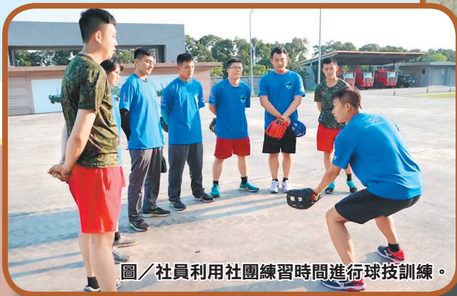
圖／社員利用社團練習時間進行球技訓練。

早在民國 96 年，239 營一群喜愛棒壘球的官兵，自發性組成「憲光壘球隊」並利用部隊公務之餘訓練、參賽，更於今年成立慢速壘球社廣招社員，將慢速壘球這項運動加以推廣，透過社團內有經驗的同仁協助教學，讓官兵一同感受壘球的樂趣，更透過練球的過程，培養團隊默契，更拉近彼此的距離。