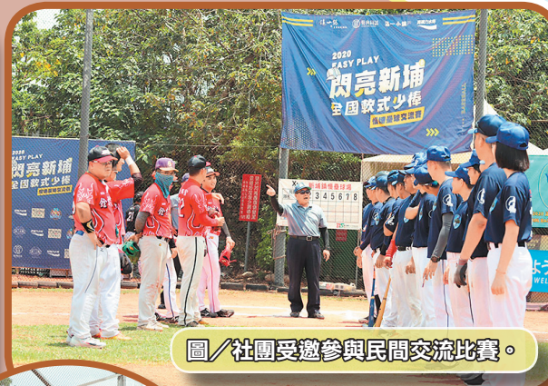
圖／社團受邀參與民間交流比賽。