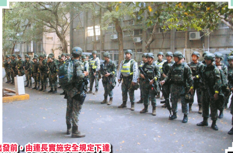
圖／出發前，由連長實施安全規定下達