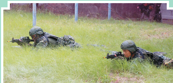
圖／行軍過程，官兵須及時應處教官下達之狀況演練