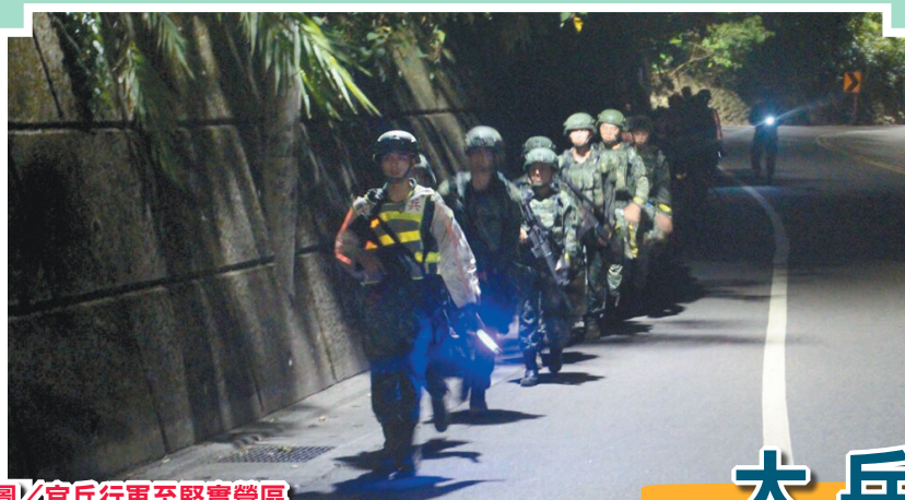
圖／官兵行軍至堅實營區

部隊經過戰術行軍抵達堅實營區，並進行城鎮戰術攻防鑑測，「有充足訓練，才能在防衛作戰中獲勝」，王營長期許官兵發揮平日扎實的訓練成果，在鑑測中充分呈現憲兵部隊勇猛驍悍的精神，爭取單位榮譽及個人佳績，俾維整體堅實戰力。