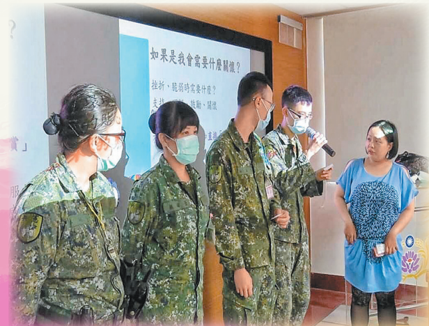
109年初級防處知能研習

洪處長表示，透過本次研習，引導各級幹部建立正確輔導觀念，打破既有思維，主動發掘徵候與異常，以「每個人都是守門員」為目標，提升官兵心輔敏感度，建立綿密支持網路，才能有效預防憾事發生，維繫部隊堅精實戰力。